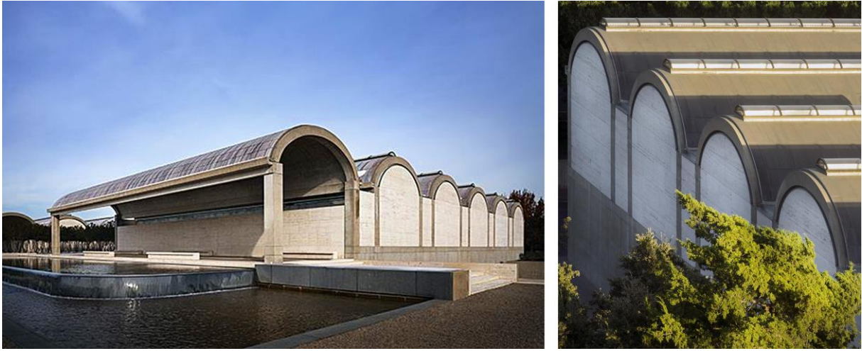
Şekil 2. Kimbell Sanat Müzesi (URL-3; URL-4).

ta ve bu durum da dolaylı olarak birliğe ve bütünlüğe işaret etmektedir. Her bir statik unsur, ritmik olarak bir araya getirilip dinamik öğeler haline gelerek yekpare bir bütünü oluşturmaktadır. Yapıda arkaik bir strüktürel unsur olarak tonozları gerçek anlamlarından soyutlayarak modernist bir yaklaşım ile yeniden yorumlanarak belleğin sürekliliğinin sağlanması ve bunu betonarme tonozlar ile traverten duvarları yani hem doğal hem sunî malzemeleri bir arada kullanarak birleştirmesi, “tarihselci olamayacak kadar modernist ve bir modernist olamayacak kadar tarihselci” (Togay, 2002) yönünün bir yansıması olarak ifade edilebilmektedir. Ayrıca, yapıda kullanılan beton ve traverten yüzeylerdeki düzensizlikleri, bozuklukları, pürüzleri gizlenmeden, doğal dokusuna dokunmadan olduğu gibi bırakılıp doğal ışık ile bu kusurlu yapı vurgulanarak malzemenin gerçekliğine aracısız olarak tanıklık edilmektedir. Arkaik bir mimari eleman olarak tonozlar ile betonun saf halinin birlikte kurgulanması yapının anıtsallığını ve tektonik şiirselliğini ortaya koymaktadır.