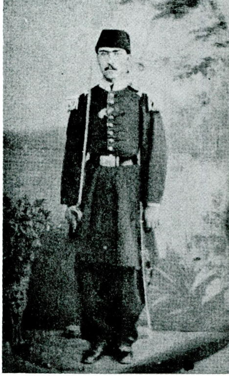
Atatürk'ün Babasının gönüllü zabıt kıyafeti