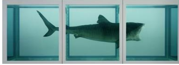
Şekil 11. Damien Hirst, The Physical Impossibility of Death in the Mind of Someone Living, 2170x5420x1800 mm – 85.5x213.4x70.9 inç, Cam, Boyalı Çelik, Silikon, Köpekbalığı ve Formaldehit Çözeltisi, 1991.

Web11: https://scalar.fas.harvard.edu/resources-for-loss/the-physical-impossibility-of-death-in-the-mind-of-someone-living-by-damien-hirst-contributed-by-so