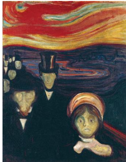
Şekil 8. Edward Munch, Kaygı, 1894, 94x74 cm, Tuval Üzerine Yağlı Boya, Munch Müzesi, Oslo, Norveç.

Web8: https://tr.m.wikipedia.org/wiki/Dosya:Edvard_Munch_-_Anxiety_-_Google_Art_Project.jpg