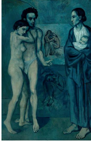
Şekil 12. Pablo Picasso, “Yaşam” , 1903, Tuval Üzerine Yağlı Boya, 196,5x129,2 cm, The Cleveland Museum of Art, Cleveland , ABD.

Web12: https://aposto.com/i/picassonun-mavi-ve-pembe-donemleri