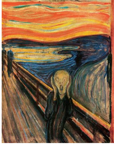
Şekil 7. Edward Munch, Çılgık, 1893, 91x73.5 cm, Tual Üzerine Pastel Boya, Munch Museum ve National Gallery, Oslo, Norveç.

Web7: https://thirdeyetravellers.com/edvard-munch-in-oslo-scream-painting-art/