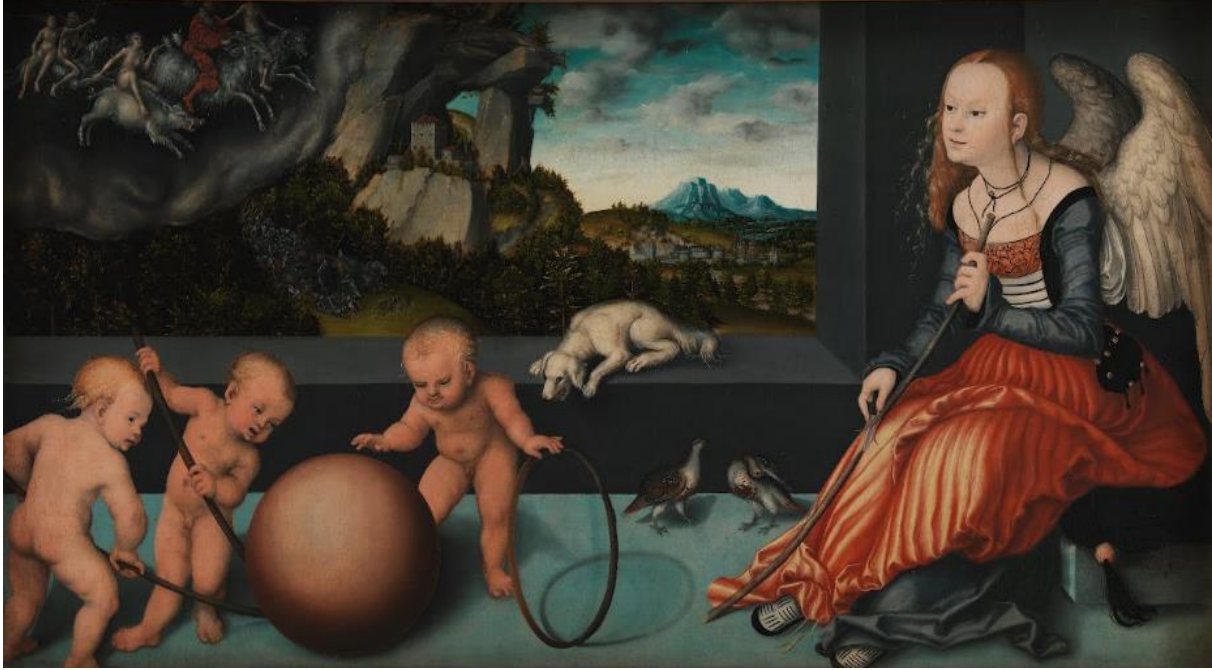
Şekil 5. Lucas Cranach, “Melankoli”, 1532, Tuval Üzerine Yağlı Boya, 51x97 cm. Statens Museum for Kunst Kopenhag – National Gallery of Denmark.

Web5: https://www.alamy.com/stock-photo/lucas-cranach-melancholy.html?sortBy=relevant