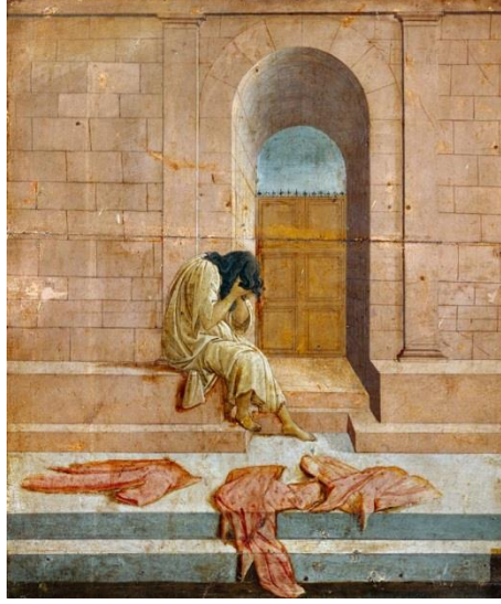
Şekil 2. Sandro Botticelli, “La Derelitta”, 1480, Temperli Kanvas Tual Üzerine Yağlı Boya, 47x43 cm. Palazzo Pallavicini-Rospigliosi, Roma, İtalya.

Web2: https://www.vulture.com/article/sandro-botticelli-la-derelitta.html