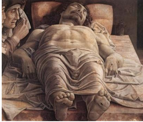
Şekil 3. Andrea Mantegna, "Ölü İsa", 1480-90, Tuval Üzerine Tempera, 68x81 cm. Pinacoteca di Brera, Milano, İtalya.