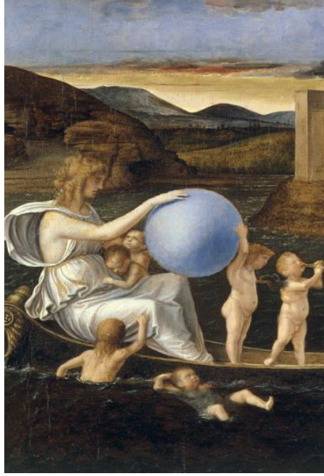
Şekil 1. Gentile Bellini, “Allegory” Fortuna-Melancholia, 1504-1505, Tual Üzerine Yağlı Boya, 34x22 cm. Venice, Galleria dell’Accademia, Venedik, İtalya.

Web1: https://www.wga.hu/html_m/b/bellini/giovanni/1490-99/137alle3.html