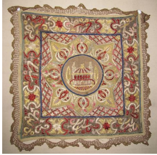
Görsel 7. Etnografya Müzesinde Bulunan Örtü Örneği.