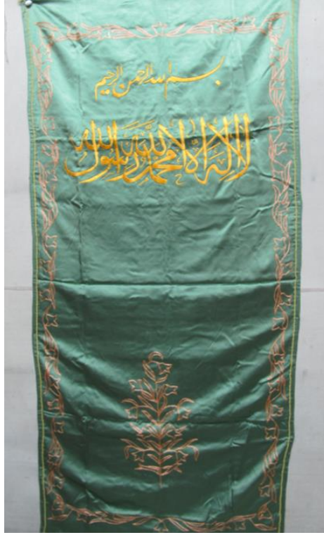
Görsel 6. Etnografya Müzesinde Bulunan Minber Perdesi Örneği.