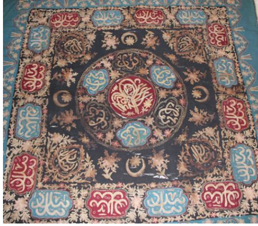
Görsel 9. Ahmet Rasih İzzet Koyunoğlu Müzesinde Bulunan Örtü Örneği.

Tanımlama: Kare biçimindeki, krem rengi keten kumaştan yapılan örtüde (Görsel 8), kırmızı, sarı, siyah, yeşil, pembe, mavi ve beyaz renkli makine ipliği kullanılarak, makine dikişi tekniği ile oluşturulmuş yazılı ve bitkisel bezemeler yer almaktadır. Örtünün merkezine dilimli bir form içerisine tuğra motifi, bu motifin dışına ise daire içerisine atlamalı sıralama ile oluşturulmuş çiçek, yaprak ve dal motiflerinden meydana gelen motif yerleştirilmiştir. Bu motifin köşelerine içleri Arap harfleri ile doldurulmuş ay yıldız motifleri, kenarlarına ise yaprak, penç ve damla motifleri oturtulmuştur. Bu motifleri Arap harflerinden oluşan bir bordür çevrelemektedir. Arap harfleri bir anlam içermeyip sadece süsleme amacıyla kullanılmıştır. Örtünün kenarları altın sarısı renginde hazır harç dikilerek süslenmiştir.