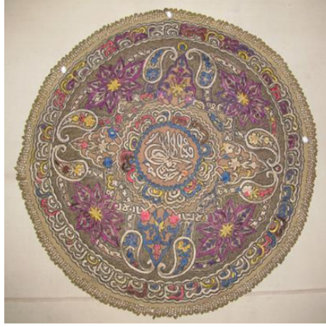
Görsel 10. Etnografya Müzesinde Bulunan Örtü Örneği.