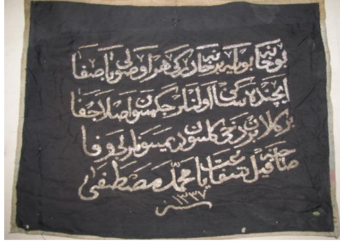
Görsel 5. Etnografya Müzesinde Bulunan Levha Örneği.

oluşturulmuş yazılı ve bitkisel bezemeler yer almaktadır. Levhanın merkezine yatay biçimde oturtulan yazıda “Ey Nübüvvet tahtının sultanı fahru’l - mürselin Şanına (senin şanına) varid (söylenmiş) Hudadan rahmeten lil - alemin” yazmaktadır. Bu yazıları mine çiçekleri, dal ve yapraklardan oluşan bir kenar süsü çevrelemektedir.