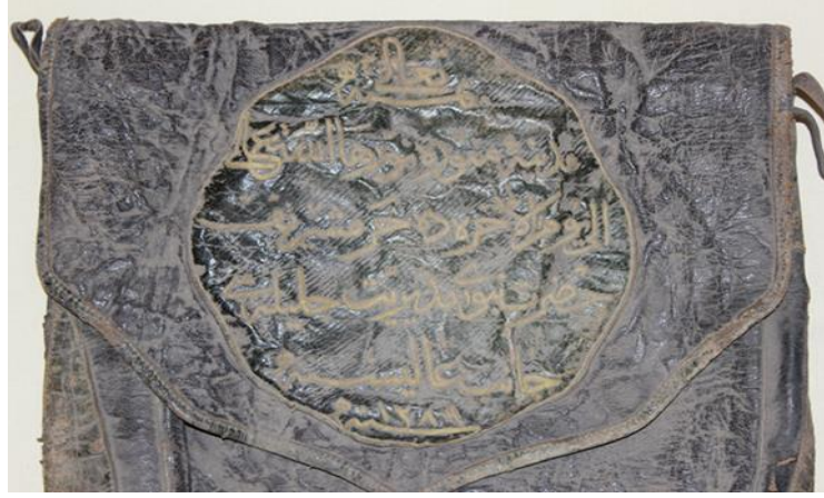
Görsel 1. Ahmet Rasih İzzet Koyunoğlu Müzesinde Bulunan Çanta Örneği.