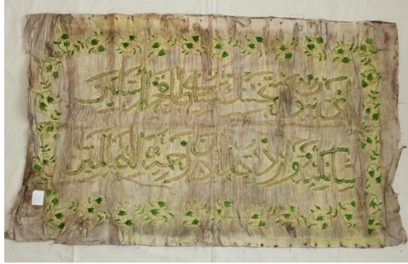
Görsel 4. Ahmet Rasih İzzet Koyunoğlu Müzesinde bulunan levha örneği.

Tanımlama: Dikdörtgen biçimindeki, kırmızı renk saten kumaştan yapılan levhada (Görsel 3), altın sarısı klaptan kullanılarak, zincir işi tekniği ile oluşturulmuş yazılı bezemeler yer almaktadır. Levhanın merkezine yatay biçimde oturtulan yazıda "Essalatü ves - selamü aleyke ya Rasülallah" (Salât ve selâm sen'in üzerine olsun, Ey Allah'ın Rasülü) yazmaktadır. Bu yazıları ince bir kenar suyu çevrelemektedir.