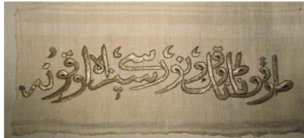
Görsel 11. Etnografya Müzesinde Bulunan Peşkir Örneği.