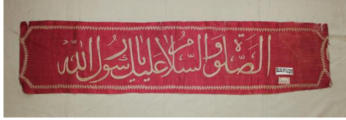
Görsel 3. Ahmet Rasih İzzet Koyunoğlu Müzesinde Bulunan Levha Örneği.

Tanımlama: Dikdörtgen biçimindeki, yeşil renk keten kumaştan yapılan levhada (Görsel 2), altın sarısı çamaşır ipeği kullanılarak, vevv sarma tekniği ile oluşturulmuş yazılı bezemeler yer almaktadır. Levhanın merkezine yatay biçimde oturtulan yazıda besmele-i şerif "Bismillâhirrahmânirrahîm" (Rahman ve Rahim olan Allah'ın adıyla) yazmaktadır. Levhanın kenarları kırmızı renkli kadife kumaş ile çevrelenmektedir.