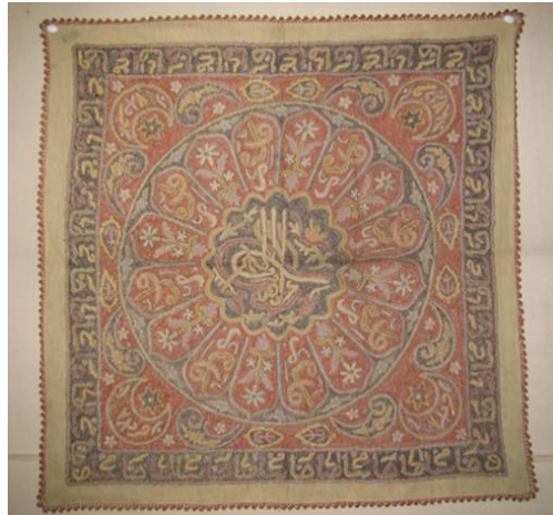
Görsel 8. Etnografya Müzesinde Bulunan Örtü Örneği.

Tanımlama: Kare biçimindeki, krem rengi keten kumaştan yapılan örtüde (Görsel 7), sarı, kırmızı, yeşil, mavi, bej ve pembe renkli çamaşır ipeği kullanılarak, düz sarma, verev sarma ve çin iğnesi teknikleri ile oluşturulmuş yazılı, bitkisel ve mimari bezemeler yer almaktadır. Örtünün merkezine daire içerisinde bir camii, bu motifin dışına ise içi bitkisel süslemelerle bezenmiş sekiz kollu yıldız motifi yerleştirilmiştir. Bu motifleri çiçek, yaprak ve Arap harflerinden oluşan bir bordür çevrelemektedir. Arap harfleri bir anlam içermeyip sadece süsleme amacıyla kullanılmıştır. Örtünün kenarları altın sarısı renginde hazır harç dikilerek süslenmiştir.