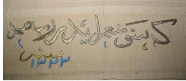
Görsel 12. Etnografya Müzesinde Bulunan Peşkir Örneği.