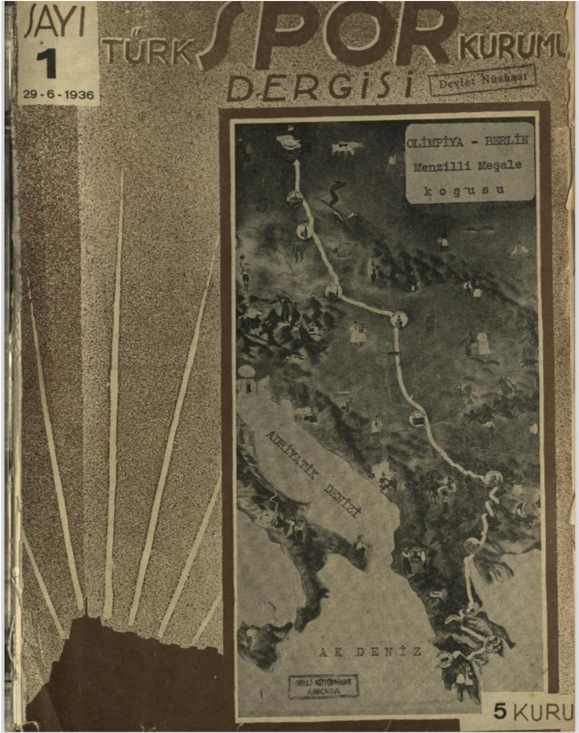
Ek. 2. Türk Spor Kurumu Dergisi, 29.06.1936, Sayı 1.