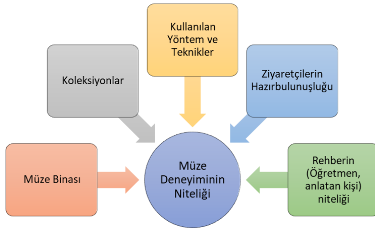
Şekil 2. Müze Deneyiminin Niteliğini Belirleyen Unsurlar

Katılımcı görüşlerinden yola çıkarak öğrencilerin müze ziyaretlerini etkileyen birtakım unsurların bulunduğu söylenebilir. Öğrencilerin müzeyle ve müzedeki eserlerle kurdukları bağlantılar ders konularını, kazanımları daha iyi öğrenmelerine katkı sağlamaktadır. Bu bağlantıları kurma sürecinde müze binasının biçimsel açıdan nasıl tasarlandığı, büyüklüğü, tarihi dokusu oldukça önemlidir. Akyol ve Köksal Akyol (2017), müze binalarının ve müzedeki nesnelerin öğrencileri için eğitimci görevi üstlendiklerini, kitaplardan okuyarak ya da öğrenmenin anlatımı yerine öğrencilerin mekanlardan ve nesnelere öğrendiklerini dile getirir. Diğer yandan müzede sergilenen koleksiyonlar ve eserler ile öğrenme kazanımları arasında kurulacak bağlantının da öğrencilerin hem hazır bulunuşluklarına uygun olması hem de ilgi çekici olup olması öğrenciler için önemlidir. Müze ziyaretini gerçekleştiren öğrencilerin deneyimlerinin niteliğini Şekil 2’de görmek mümkündür: