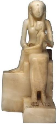
Resim 6: Kraliçe Anknes ve II. Pepi. MÖ 2200 26

benzer bir örneği de Brooklyn Müzesi'nde yer alan Mısır VI. Hanedanı'na tarihli bir buluntu grubunda görülmektedir (Resim 6). Bu örnekte altı yaş civarında 25 betimlenen II. Pepi, üzerine kraliyete özgü bir elbise (regalia) giymektedir. Hitit örneğinde herhangi bir fiziksel temas olmamasına rağmen Mısır örneğinde kadın figür çocuğu sırt ve bacak noktasında sadece eliyle desteklemektedir. Mısır tarihinde tahta geçiş gibi olağan bir anı yansıtan bu sahne Pepi'nin kral oluşunu yansıtır (Vorys Canby, 1986: 58).