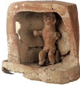
Resim 3: Erkek Heykelciği, Pişmiş Toprak (Bilgi, 2012: 393)

İnandık Höyüğü'nün 21 güneyindeki açmada yer alan bir yapının avlusundan gün yüzüne çıkarılan pişmiş toprak erkek heykelciği konumuz itibariyle önemlidir. Üç cephesi, zemin ve tavanı kapalı olan bir mekân içerisinde, kısa, arkalıksız bir kaide üzerinde oturur pozisyonda tasvir edilmiştir (Resim 3) 22 . Kollar orantısız, sol kol omuzdan kırık, sağ kol dirsekten bükük ve öne doğru uzanmaktadır. Yüz hatları belirgin, ifadesizdir. Göz ve kulaklar iri işlenmiştir (Kulaçoğlu, 1992: 199). Figürün, cinsel organı belirgin işlenmiştir. Figürün tahta oturan bir tanrı olduğu ve tapınağa sunulan bir adak heykelciği olduğu belirtilmiştir (Özgüç, 1988: 41; Bilgi, 2012: 392).