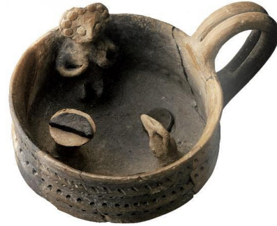
Resim 4: Göğüslerini Tutan Tanrıça, Pişmiş Toprak (Bilgi, 2012: 392).

Çıplak olarak tasvir edilmiş bir başka figür, Eskiyapar'dan, 23 içinde kutsal bir alanın betimlendiği tek kulplu pişmiş toprak kapıdır. (Resim 4) Kap, kült eşyalarının minyatürleriyle donatılmıştır. İç kenarına sırtını dayayarak oturan tanrıçanın başı kabın ağız kenarını aşmaktadır. Başında geniş kurs biçimli başlık yer alır. İki eliyle göğüslerini tutmaktadır. Bunun dışında figürde elbise benzeri bir unsurun herhangi bir detayı yoktur. 24 Her iki figürün de yaklaşık aynı zaman dilimlerinde benzer stilde yapılmış oldukları gözlemlenmektedir. Kutsallıkla ilişkilendirebileceğimiz bir ortamda tasvir edilmeleri diğer ortak özellikleridir.