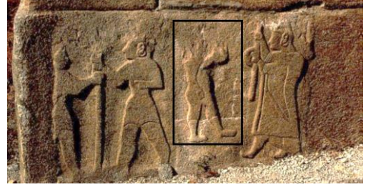
Resim 1: Çıplak Erkek Figürü-I. Alaca Höyük. Sfenksli Kapı batı kulesinin birinci sırası (Darga, 1992:137).

Höyük'teki 20 duvar kabartmalarında görülmektedir (Baltacıoğlu, 2006: 27; Çınaroğlu ve Çelik: 2013: 198). Alaca Höyük'te Sfenksli Kapı batı kulelerinin şehir dışına bakan tarafında yer alan ve taşıyıcı işlevi bulunan bloklara işlenmiş Orta Hitit Çağı'na ait (Schachner, 2012: 139) duvar kabartmalarından iki blok konumuz itibarıyla dikkat çekmektedir. Çıplak birer figür barındıran iki kabartma karşılıklı olarak yer almaktadır. Bunlardan ilkinde (Resim 1) figür sağa doğru yürür pozisyonda kolları dirsekten hafif bükük, sağ eli vücuda birleşik ve yumruk şeklinde, sol eli yumruk şeklinde ve çene hizasında, olasılıkla dua ederken betimlenmiştir. Bu sahnedeki figürler yan yana yer alan iki farklı sahne içerisinde betimlenmektedir. İki figürün de duruşu ve buldukları sahne içerisinde betimlenme özellikleri birbirinden farklıdır. İlk figür, sap delikli balta taşıyan figür ile karşılıklı durmakta ve sol eliyle cinsel organını örtmektedir.