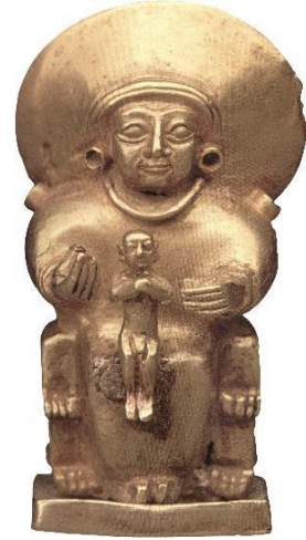
Resim 5: Çocukla Oturan Tanrıça (Bilgi, 2012: 423).

tarafından yetişkin jesti olarak yorumlanmıştır (Vorys Canby, 1986: 57). Hatta duruş özelliklerini ele alarak yaklaşık bir yaşında olabileceği belirtmiştir (Vorys Canby, 1986: 56). Muscarella (1974: 7), çocuğun kız olması durumunda Mezalla, erkek olması durumunda ise Hava Tanrısı olabileceğini belirtir. Darga (1992: 102), yetişkin kadının anne, kucağındaki figürün oğul olduğunu ileri sürmüştür. Ensert ise Arinna'nın Güneş Tanrıçası ve torunu Zintuhi olduğu yönünde görüş bildirmiştir (Ensert, 2017: 7).