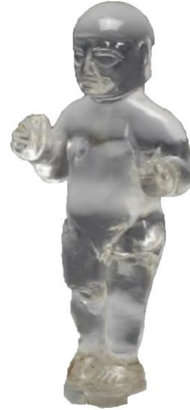
Resim 7: Çocuk Figürünü, Dağ kristali 27

Çıplak tasvir edilen figürlerin tanımlanmasında bir rol oynayabilecek bir diğer örnek 1935'te Tarsus'ta yapılan kazılardan ele geçen ve Walters Sanat Galerisi'nde bulunan dağ kristalinden yapılmış erkek figürüdür (Resim 7). Figür, erkek bebek olarak tanımlanmıştır. 7 cm boyutunda, neredeyse boyunsuz, iri bir başa sahiptir. Canby'e göre çıplak ve küçük boyutlu işlenen bu figür önemli bir kişiliği temsil etmektedir ve yetişkinlere özgü duruş bu figürde bulunmamaktadır (Vorys Canby, 1986: 55; 1989: 128).