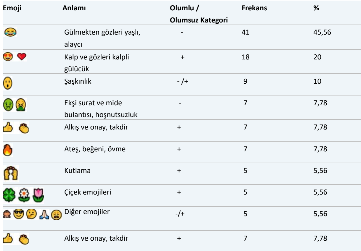
Tablo 6. Paylaşımlara eşlik eden duygu ikonları

Duygu ikonu yer alan 90 paylaşım bulunmaktadır ve her bir paylaşımında birden fazla ve birden farklı duygu ikonu kullanılabildiği bulgulanmıştır. Duygu ikonlu paylaşımlar arasında kullanılan emojilerin yoğunluğuna bakıldığında, 90 duygu ikonlu paylaşımın 41'inde %45,56 oranına karşılık gelecek biçimde gülmekten gözleri yaşlanan surat ifadesi kullanıldığı görülmüştür. Bu ifade biçimi çok gülünç durumlar için kullanılan bir anlamı ifade etse de ilgili paylaşımlarda daha çok estetik öncesi/sonrası değişim geçiren kimselere yönelik alaycı bir küçümsemeye de işaret edebilmektedir. Duygu ikonu, olumsuzluk ifade edecek biçimde alay ve küçümseme amaçlı kullanılmıştır. Fredrickson ve Roberts (1997, s. 177), kadınların gündelik yaşamda bedenleri üzerinden maruz kaldıkları nesneleştirme girişimlerine verdikleri tepkinin nesneleştirmenin içselleştirilmesi olduğunu ifade etmektedir. Büyük çoğunluğu kadınlar tarafından yapılan kullanıcı yorumlarında kullanılan duygu ikonlarındaki alaycı tavır, nesneleştirmenin içselleştirilmesidir. Bu bağlamda nesneleştirme, dijital uzamda hâkim bir form olan duygu ikonları üzerinden de desteklenmektedir. Kullanıcılar, Robins'in (2013, ss. 197-198), ifade biçimiyle gerçekliğin imgesiyle temas hâlinde olmakla birlikte gerçekliğin tehdit edici yanlarından sakınabilecek bir mesafededir ve bu imkân paylaşımların içeriğini biçimlendirmektedir.