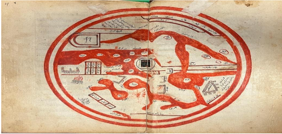
Harita 2. Tercüme-yi Haridatü'l-acayip'ten alınmış, alt ortasında Yecüc ve Mecüc Duvarı, İstanbul'un kuzeydoğusunda (müstahkem üçgenin içinde) yer alan bir dünya haritası. (Mahmud el-Hatip el-Rumi, Tercüme-yi Haridatu'l-acayip. 1047 H. [1637]. British Library

(Atlantik) suları altında kalan yerleri de anlatır. Güney tarafından denizin suları çekildiğini bu kısmın doğu tarafını Türk milletlerinden Kımazeklerin topraklarının teşkil ettiğini vurgular. Kımazek toprağının doğusunda ise Tast (Tavast) illerinin yer aldığını da sözlerine ekler (İbni Haldun, s. 192). Asur gölü civarını anlatırken, Türkmenlerin kavimlerinden Tatar (Betâriye) topraklarının burada olduğunu söyler. Kumanlar ili topraklarına bitişik olduğunu anlatır. Doğu tarafındaki dağlardan akan suların bu göle döküldüğünü, soğuk şiddetli olduğu için bu göl daima donmuş bir hâlde olduğunu, ancak yazları az bir zaman buzlarının eridiğini anlatarak yine coğrafyanın koşullarını da vurgular. Rus memleketinin Kuman topraklarının doğusunda olduğunu da belirtir.