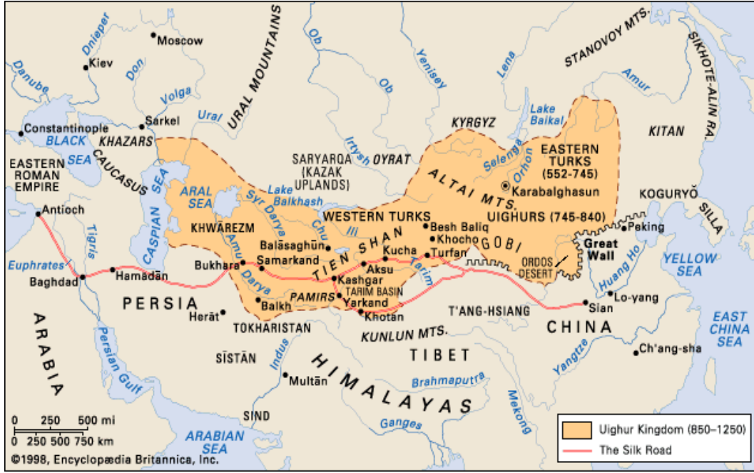
Harita 1. 850-1250 tarihleri arasında Orta Asya

yerler, Herat bölgesini teşkil eder. Herat, Horasan'ın ortasındadır. (İsferain), Kaşan, Buşenç, Merv-Rud, Talekan ve Cüzcan Horasan'a tâbi şehirlerdir ve Horasan burada Ceyhun'a (Amuderya'ya) ulaşır. Horasan şehirlerinden olan Belh, bu ırmağın batısında, Tirmiz, Ceyhun'un doğusundadır. Özellikle Belhin vaktiyle Türk devletinin merkezi olduğunu da sözlerine ekler (İbni Haldun, s. 163-164).