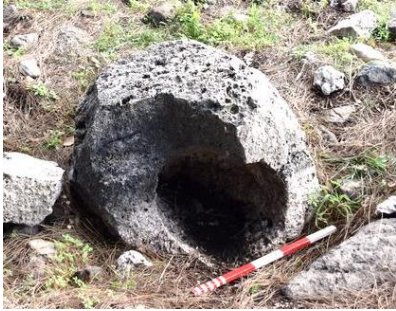
Fig. 8. 3KB.32 env. no'lu kare formlu ostothekek teknesi.

Kuzeybatı nekropolis 'te inhumasyonun yanı sıra kremasyon gömülerin de yapıldığını ortaya koyan kalıntılar tespit edilmiştir. Alan içerisinde dağınık halde bulunan ostothekekler; bağımsız olanlar ve kayaya oyulanlar şeklinde iki farklı formda bulunmaktadır. Bu gruba dahil olan 11 bağımsız tekne, 6 kapak ve 1 adet kayaya oyulmuş ostothekek mevcuttur. Bağımsız ostothekek teknelerinin 10'u kareye yakın formda, 1'i dikdörtgen ve kaya ostotheği ise yuvarlak formdadır (Fig. 8-9-10). Dikdörtgen formdaki ostothekek, RTI metodu (metot hakkında detaylı bilgi için bk. Akçay 2016, 1-17) ile görüntülenerek üzerinde kabartma olarak yer alan kapı örgesinin detaylı görünümü elde edilmiştir.