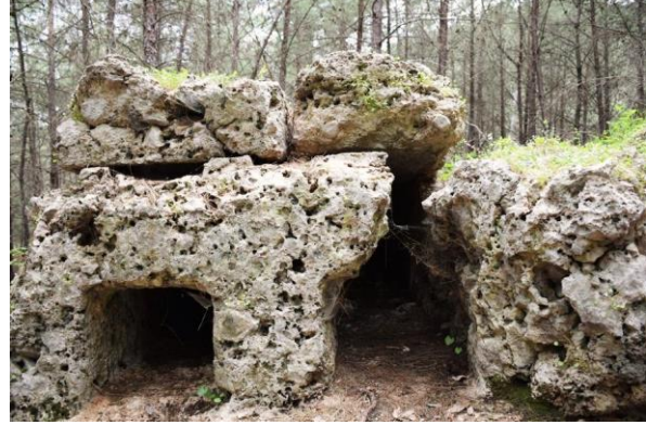
Fig. 12. 3KB.85 ve 3KB. 86 env. no'lu mezarlar

Phaselis kuzeybatı nekropolis 'inde toplam 7 adet kayanın içine oyularak oluşturulmuş khamasorion bulunmaktadır. Bu mezarlar; anakayadan kopmuş olan kayaçlar üzerine oyulanlar (Fig.12) anakaya üzerine oyulanlar (Fig.13) ve anakaya üzerinde olup bir arkalık bölümüne sahip olanlar (Fig.14) şeklinde çeşitlilik göstermektedir. Ölçülerde boy: 1.67 - 2.26 m, en: 0.44 - 0.51 arasında değişmektedir. Bu mezarların hepsi kente girişi sağlayan gişeden önce ve modern yolun doğusunda konumlandırılmıştır. Bu nedenle lagün ile bağlantısının bulunmadığı engebeli bir topografya üzerinde yayılım göstermektedirler. Khamasorion 'larda gömü teknesi tamamen kayanın içine oyulmuş yalnızca üst kısmı kapağın oturtulması için dört köşede devam eden çıkıntılarla kayadan yükseltilmiştir.