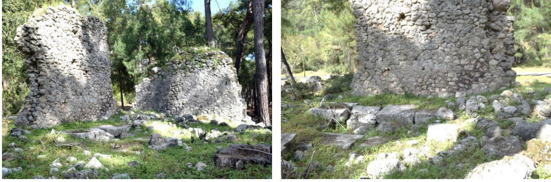
Fig. 16-17. 3KB.71 env. no'lu mezar yapısı

lıkları değişkenlik göstermektedir; güney duvar 0.92 m, doğu duvar 0.62 m'dir. Duvarlar arasındaki bu fark güney-kuzey duvarların tonoz taşıyıcı işlevi üstlendiğini göstermektedir. Bu veriyi destekler nitelikte, yapının doğu duvarında tonozla kapatmaya dair ipucu verebilecek içe eğimli bir örgü bulunmaktadır. Mezarın zeminindeki platform bloklarından itibaren doğu duvarın korunmuş yüksekliği 4.10 m, güney duvarın yüksekliği 3.10 m'dir. Duvarlar küçük moloz taşlardan bol harçlı bir örgüye sahiptir (Fig. 16-17).