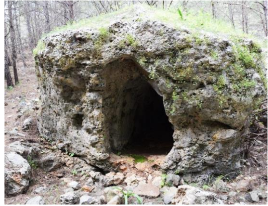
Fig. 15. 3KB.87 env. no'lu mezar

Kuzeybatı nekropolis 'te bir adet kaya mezarı bulunmaktadır. Mezar kente giriş girişinin 217 m kuzeybatısında ve modern yolun 50 m kuzeyinde yer almaktadır (Fig. 15). Anakayadan kopmuş, bağımsız halde duran 3,5 m x 4 m'lik bir kaya kütlelerinin güney cephesine oyulmuştur. Mezar odası 2.25 m x 0.96 m ve yüksekliği 1.20 metredir. Mezar hiçbir plastik örge içermeyen oldukça sade düzenlenmiş bir cephe mimarisine sahiptir. Oyulduğu kayacın dibinden yukarıya doğru çıkıkça genişleyen ve merkez noktaya ulaştıktan sonra yukarıya doğru daralarak devam eden formu ile semerdamlı mezarlara benzer bir görünümündedir. Kayacın üstü çatı formunu andıracak şekilde traşlanmıştır. Çok belirgin bir çatı formu vermeyen bu düzenleme mezar girişinin en tepe noktası ile kaya kütlelerinin üstündeki çatının doruk noktasını aynı hizaya getirmektedir. Mezar kapısı mevcut değildir ancak girişin iki yanında 0.30 m içerde 0.20 m genişliğinde yukarıya doğru devam eden hat kapının yerleştiği yuvalardır. Bu izler kapının düz bir levhadan ziyade sürgülü bir kapı ile kapatıldığını göstermektedir. Mezar, kayacın gözenekli yapısı nedeniyle özellikle dış yüzeyinde bünyesi delikli bozuk bir görünüm içindedir. İç ve dış duvarlarda sıva ya da boya izine rastlanmamıştır.