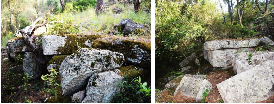
Fig. 2-3. Batı Nekropolis mezarlarının genel görünümü

arazide aşağıya yuvarlanmışır. Tamamen ya da kısmen korunmuş kapakların bazıları tekne üzerinde durmaktadır (Fig. 2-3).