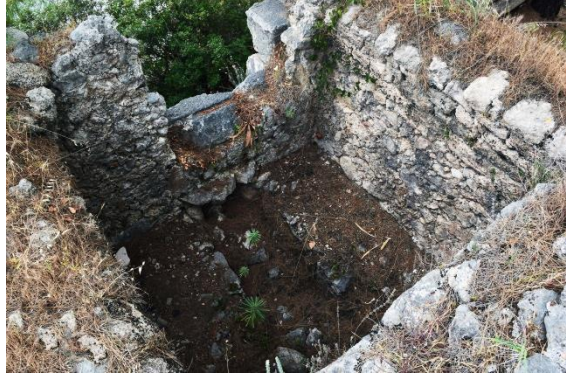
Fig. 18. Kuzeydoğu nekropolis tonozlu mezar yapısı

In situ korunan bloklara göre genişliği 0.60 m, uzunluğu ise moloz dolgudan dolayı görülememektedir. Yapının yoğun oranda tahrip olması ve içe dökülen dolgu nedeniyle düzenlemenin işlevinin tam olarak anlaşılması güçleşmektedir. Ancak; bir sandık mezara ait düzenleme olduğu, düzgün kesilmiş blokların oluşturduğu dikdörtgen alanın gömü çukuru olabileceği ya da lahdin yerleştirildiği platform ve derinleşen bölümün hyposorion alanı olduğu yönünde öneriler getirilebilir.