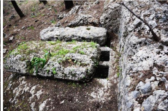
Fig.14.3KB.94, 3KB.95, 3KB.96 env. no'lu mezarlar

Kapak formuna bakıldığında bu gruba dahil mezarların tümünde düz damlı kapak kullanılmış olduğu; bazı kapakların aynı kaya üzerinde iki tekneyi örtecek şekilde masif dikdörtgen bloklar olarak şekillendirildiği görülmektedir (Fig. 14). Bu mezarlar iki adet ikili ve bir adet üçlü olmak üzere yan yana çoklu mezarlar olarak düzenlenmişlerdir. Bu durum, mezarların ana kayaya oyulması nedeniyle alanda bulunan kayaç yüzeyine bağımlı bir düzenleme şeklidir. Khamasorion 'ların bölge ayırt etmeksizin kayanın dikdörtgen formda oyulması ile oluşturulduğu görülmektedir. Kapak formlarına bakıldığında ise; Termessos'ta bu gruba giren mezarların kapaklarında çeşitli formlar görülmektedir. En çok karşılaşılan, iki kısa cephesinde üçgen alınlıklar meydana getiren, semerdam biçimindeki kapak tipidir ki, bunların da alınlık köşelerinde akroter bulunan veya akrotersiz olanlar mevcuttur (Çelgin 1990, 183). Lyrboton Kome'de teknesi tamamen kayanın içine oyularak ya da kayadan yükseltilerek oyulmuş khamasorion 'larda, kısa yüzleri üçgen alınlık