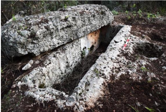
Fig. 13. 3KB.99, 3KB.100 env. no'lu mezarlar