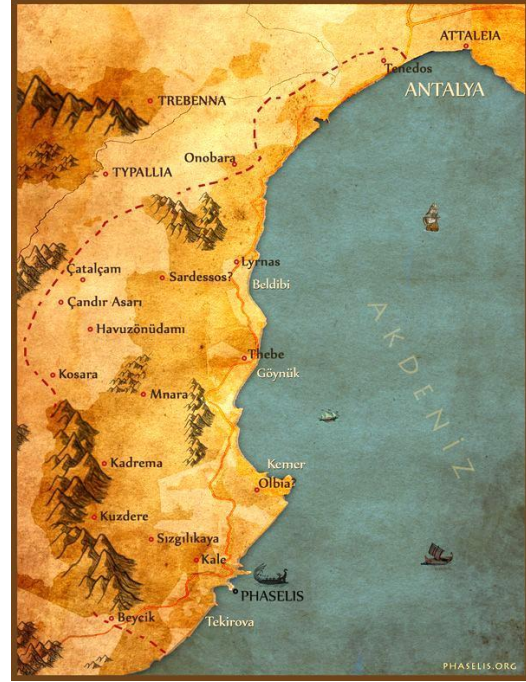
Fig. 1. Phaselis Kent Konumu ve Teritoryum Sınırları (Hrt. A. Akçay, Phaselis Araştırmaları)

Kentin araştırma tarihçesi Lykia Bölgesi'nin modern araştırmacılar tarafından farklı amaç