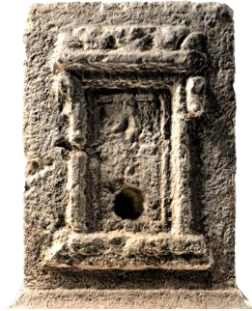
Fig.10. 3KB.82 dikdörtgen formlu ve kabartmalı ostothekek RTI görünümü.

Kuzeybatı nekropolis 'teki yoğun tahribat, tümü yerel kireçtaşıdan üretilen bu mezarlarda da görülmektedir. Kayaya oyulmuş ostothekek haricindekiler in situ konumlarında değildir, hiçbir ostothekek tekne kapak birlikteliği bulunmamaktadır ve kremasyon kapları mevcut değildir. Araştırma istasyonunun bahçesinde korunan, olasılıkla daha önce kentte yürütülen çalışmalar sırasında getirilmiş ve buluntu yerine dair kayıt bulunmayan ostothekek teknesi (3KB.82), dikdörtgen formu ve üzerinde kabartma taşımasıyla diğer ostothekeklerden ayrılmaktadır. Ana yoldan ayrılıp Phaselis'e dönen yolun sağında ve ilk mezar öbeğinde bulunan ostothekek (3KB.101) ise kayaya oyulmuş olmasıyla diğer bağımsız ostothekeklerden farklıdır. Kayaya oyulmuş ostothekek, ana yoldan Phaselis'e dönen modern yolun doğusunda yükselen tepelik üzerinde ve kuzeyinden geçen ana yola yaklaşık 70 m mesafededir. Anakayadan kopmuş bağımsız halde duran bir kaya kütesinin üzeri inhumasyon gömü için iki khamasorion ve kremasyon gömü için bir adet yuvarlak kaya ostotheği yerleştirilecek şekilde, yüksek olasılıkla aynı ailenin üyeleri için düzenlenmiştir (Fig. 11).