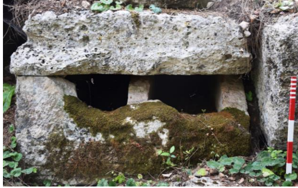
Fig. 4. 3B.15 env. no'lu mezarın görünümü.

Tekne gen. 1.30 m, yük. 0.68 m kapak gen. 1.30 m, yük. 0.30 m ölçüleriyle dışardan bakıldığında büyük bir lahit mezar olarak görülmektedir, ancak tekne içten bir duvar ile bölünmüş ve yan yana iki gömü alanı olarak düzenlenmiştir. Bu düzenle uyumlu olarak dışardan düz damlı forma sahip yekpare tek blok olarak görülen kapak da içten iki ayrı üçgen alınlık oluşturacak şekilde işlenmiştir. Tekne ve kapak iç yüzeyi oldukça iyi korunmuş durumda ve pürüzsüz denilebilecek şekilde sıvalıdır.