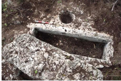
Fig. 9. 3KB.101 no'lu yuvarlak kaya ostotheği ve khamasorion'ların üstten görünümü.