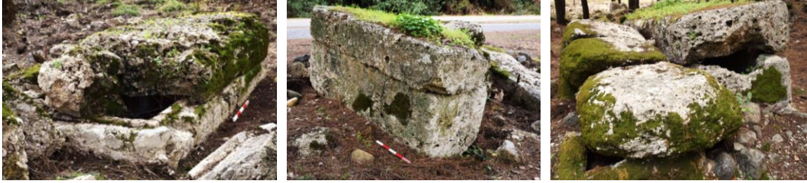
Fig. 5-6-7. Kuzeybatı Nekropolis alanını bölerek sahile uzanan modern yolun batısında bulunan 3KB.5, 3KB.56, 3KB.57 ve 3KB.58 env. no'lu lahit örnekleri.

Kuzeybatı ve Batı nekropolis 'leri geneline bakıldığında, lahitlerin tekneler açısından çeşitlilik arz etmeyen, kabartma, yazıt veya herhangi bir bezeme unsuru içermeyen, farklı boyutlarda kesilmiş dikdörtgen bloklar halinde tek tip olarak bulunduğu gözlemlenmektedir (Fig. 5-6-7).