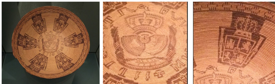
Görsel 9. İspanyol Madeni Para Tasarımlı Sepet Tepsisi (Eroğlu, 2015).

Amerika Yerlileri Ulusal Müzesi'nde (National Museum of the American Indian) sergilenen sepet örneklerinden biri; Kızılderili Yerli halkın Avrupalı Amerikalılar tarafından uğradıkları baskının sanata yansımalarına güzel bir örnektir. California, Monterey'deki İspanyol yöneticiler tarafından misafir bir ileri gelene hediye olarak yaptırılmıştır. Misyonerler İspanyol yetkililere sunum sepet hediye ederek Kızılderili kabilelerini "Hıristiyanlaştırmak" ve "uygarlaştırmak" konusundaki başarılarını göstermek istemişlerdir. Sepetin üzerinde yer alan desen İspanyol madeni parası (Görsel 9) üzerinde yer alan İspanyol armasıdır. Arma altı kez tekrarlanarak, sepetin tasarımına hareketlilik hissi vermiştir. Sanatçı, sepette kendisine