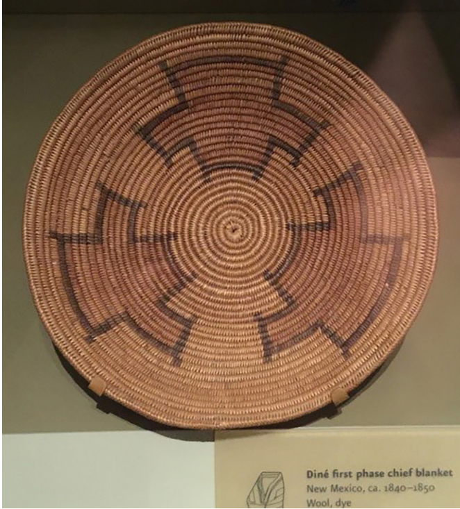
Görsel 8. Örümcek Kadın Haç Tasarımlı Navajo Ulus Tören Sepeti (Eroğlu, 2015).

de sanatsal bağlamda birlikte çalışmışlardır. Ursuline rahibeleri, Yerlilere Fransız nakış tekniklerini Yerli malzemelerle (geyik kılı ve huş ağacı kabuğu) birleştirerek turizm amacıyla satılabilecekleri yeni sepet formları yapmayı öğretmişlerdir (Williams, 2003).