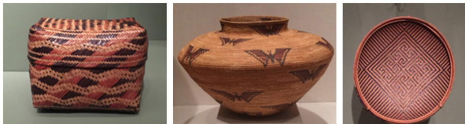
Soyut Motifler (Motif Adı: Solucan İzi)