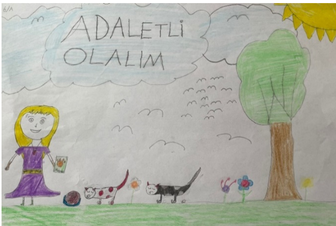
Resim 4. Şeyda'nın Resmi.