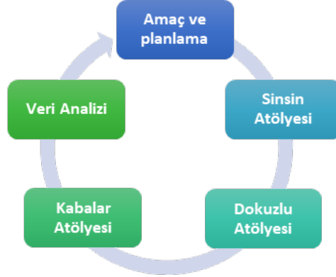
Şekil 3. Yaratıcı Drama ve Dans Atölyeleri Döngüsü

Çalışmanın bu bölümünde yaratıcı drama etkinlikleri kullanılarak halk danslarının öğretilmesi amaçlanmaktadır. Toplamda 3 atölyenin yer aldığı bu bölümde “sinsin, dokuzlu ve kabalar” danslarının öğretilmesi amaçlanmaktadır. Yaratıcı drama ve dans atölyelerinin döngüsü şekil 3’de yer almaktadır.