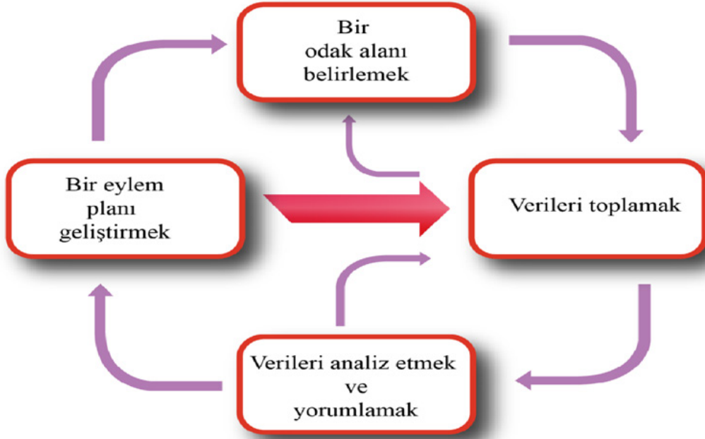
Şekil 1. Eylem Araştırmalarının Diyalektik Döngüsü (Mills 2003, s.19)

etkinlikleri betimlemiş, karşılaşılan problemleri saptamış ve çözümlenmeye çalışmıştır. Gürgür (2018), eylem araştırmasını değişim ve gelişimi sağlama odaklı, bireylerin kendi uygulamalarını içeren, sistematik bir biçimde verilerin toplandığı ve yansıtılmalı sorgulamaların yapıldığı, bunlara dayalı yeni eylem planlarının hazırlanıp uygulandığı, döngüsel veya sarmal adımlarla gerçekleştirilen bir bilimsel araştırma süreci olarak betimlemektedir. Bu sarmal veya döngüsel süreç bazı aşamaları içermektedir. Mills (2003) döngüsel süreci odak alanı belirleme, verileri toplama, verileri analiz etme ve yorumlama ve eylem planı geliştirme biçiminde sıralamaktadır.