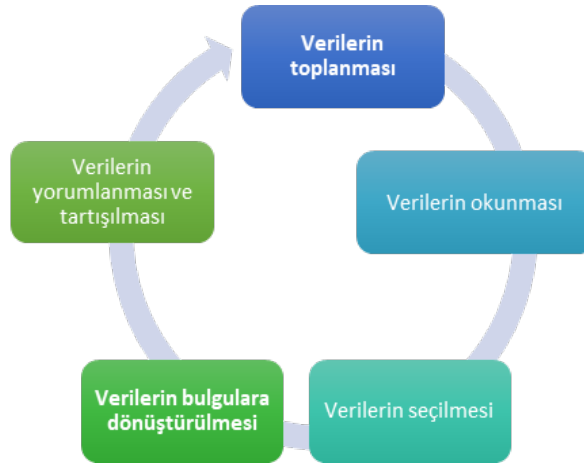
Şekil 2. Sistematik Analitik Analiz Süreci (Miles & Huberman, 1994, s.12)

Eylem araştırması döngüsünün bu aşamasında elde edilen veriler yorumlanmaktadır. Mertler (2006), eylem araştırmalarında verilerin analiz edilmesi ve yorumlanmasının nicel araştırmalara göre farklılık gösterdiğini belirterek, eylem araştırmalarında hem süreçte hem sürecin bitiminde verilerin analiz edilerek yorumlandığını ifade etmektedir. Verilerin süreçte analiz edilmesi, uygulanan eylem planlarının sorunu çözüp çözmediğini değerlendirmekte, araştırmacıyı yönlendirerek sonraki aşamada hangi verileri elde etmesi gerektiği konusunda fikir vermektedir (Johnson, 2002; Gürgür, 2017). Böylece, analiz yorumları, eylem araştırması döngüsünün bir sonraki aşaması olan eylem planı geliştirme sürecine ışık tutmaktadır. Eylem araştırması döngüsünde sürekli bir değişim olmasıyla gerçekleşecek adımlara karar vermek ve ileride gerçekleştirilecek eylemleri planlamak söz konusu olduğu için sistematik analitik analiz yaklaşımı ile analizi mümkün kılmaktadır (Altrichter, Posch and Somekh, 2005).