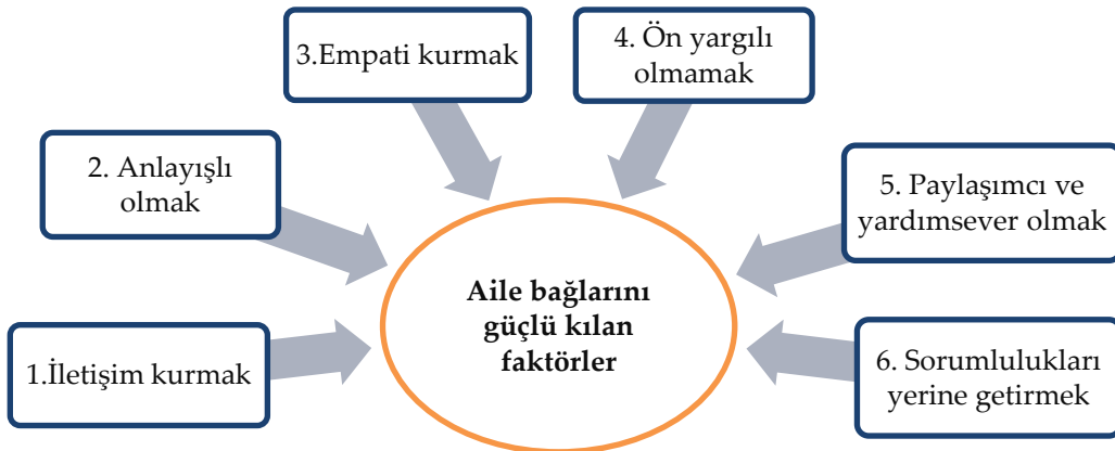
Şekil 1. Aile bağlarını güçlü kılan bazı faktörler (MEB, 2023), Sosyal bilgiler dersi öğretim programından yazar tarafından uyarlanmıştır.

Sağlıklı aile bağları, bireyler arasında açık iletişimi, anlayışı, empatiyi ve birbirlerine karşı sorumluluk duygusunu içermektedir. Ancak dönemin toplumsal, siyasi, ekonomik, eğitim ve teknolojik gelişmeleri aile bağlarını zamanla değiştirebilir ve çeşitli faktörlere bağlı olarak güçlenebilir veya zayıflayabilir. Dolayısıyla aile içindeki olumlu bağlar, bireylerin duygusal refahlarını artırabilirken, olumsuz bağlar ise stres ve sorunlara neden olabilir. Bu yüzden şunu açık bir şekilde ifade etmek gerekiyor ki aile bağları, aile üyelerinin birbirlerine olan bağlılıkları ve ilişkileri üzerinde etkili olduğu görülmektedir (Tüysüz, 2020; Ayantaş, 2023). Bu betimleyici açıklamalar doğrultusunda aile bağlarını güçlü kılan beş önemli faktör olduğu görülmektedir. Bunlar Şekil 1’de açıklandığı gibidir.