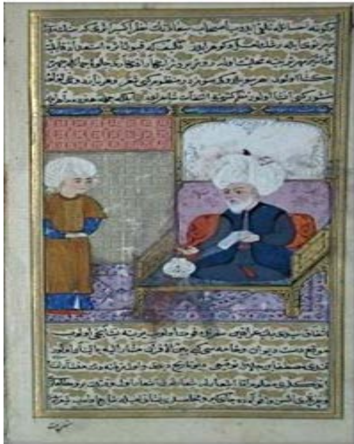
Fig. 2. Celâlzâde Mustafa Çelebi; extract from Meşâiru'ş-Şu'ârâ. Ali Emiri, TR 772, 365, Yılmaz, 2006, 251.