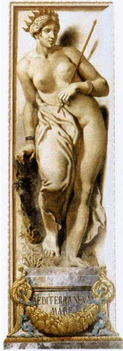
Fig. 7. Eugène Delacroix, Akdeniz , 1837, siva üzerine yağlıboya ve balmumu, 122 x 300 cm. Salon du Roi, Palais Bourbon, Paris.

Romantizm döneminin değerli ismi Eugène Delacroix (1798-1863), Akdeniz'i alegorik bir anlatımla sunmuştur. 1837 yılı süresince, Paris'teki Palais Bourbon'daki (Bourbon Sarayı) Salon du Roi'nın (Kral Salonu) tavan süslemeleri üzerinde çalışan sanatçının, klasik giysiler