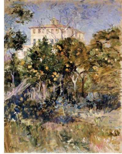
Fig. 10. Berthe Morisot, Nice'de Portakal Ağaçlı Villa , 1882, tuval üzerine yağlıboya, Özel Koleksiyon.

İzlenimci kadın ressam Berthe Morisot (1841-1895), 1882 tarihli Nice'de Portakal Ağaçlı Villa adlı resminde (Fig. 10), güneşin aydınlattığı mavi bir gökyüzünün altında, güzel bir villa betimlemiştir. Villanın önünde uzanan bahçede serpilmiş portakal ağaçları resmin ön planında yer almakta, sanki izleyiciyi aralarında dolaşmaya davet etmektedir. Nice, Morisot’nun sevdiği bir beldedir. Çeşitli seferler geldiği Nice’in plajlarını da tuvallerine aktaran Morisot, 1888 yılının Kasım ayında, eşi ve kızı ile birlikte, kentin yakınında yer alan ve sanatçının “kusursuz sayfiye” diye tanımladığı Cimiez’de, büyük bir bahçesi olan Villa Ratti’ye yerleşmiştir. Morisot’nun eşi Eugene Manet’nin, Lewis Brown adlı arkadaşına yazdığı 21 Kasım tarihli bir mektubunda şu sözler dikkat çekmektedir: “Eşim çalışıyor. Işığı göz alıcı bir şekilde yansıtan portakal ve zeytin ağaçlarına âşık oldu”. Karı koca en yakın arkadaşlarını evlerine davet etmişler, turuncuğilleri ve kurutulmuş yaprakları kuzeye hediye olarak göndermişlerdir. Ailece tepeleri gezmişler, Morisot dışarıda hem piknik hem de resim yapmanın tadına varmıştır. Morisot, arkadaşı Emma’ya hitap ettiği mektubunda şöyle yazmıştır: “Portakalları sert değil de, Floransa’da gördüğüm