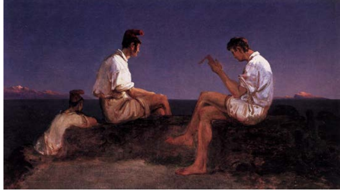
Fig. 9. Karl Blechen, Napoli Körfezi'nde Balıkçılar , 1830, tuval üzerine yağlıboya, 20 x 34 cm, Nationalgalerie, Berlin.

19. yüzyıl ressamlarından Karl Blechen (1797-1840), Almanya’daki doğalcı manzaraanlayışının kurucuları arasında sayılmaktadır. Eserlerindeki duyarlı ifade onu Caspar David Friedrich (1774-1840) gibi Romantik resim geleneğinin ustalarına, parlak ve özgür renk kullanımına ise Adolph von Menzel (1815-1905) gibi İzlenimcilik akımının gelişiminde rol alan sanatçılara yakınlaştırmaktadır. Berlin Akademisi’nde çalışmaya başlamadan önce, 1828-29 yıllarını İtalya’da geçiren Blechen,