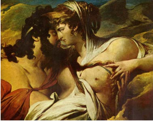
Fig. 6. James Barry, Jüpitер ve Juno İda Dağı'nda , 1790-99, tuval üzerine yağlıboya, 130,2 cm x 155,4 cm, Sheffield City Museum, Sheffield.

Hellen ve Roma mitolojilerinde, Akdeniz dünyasına ait pek çok deniz, ırmak, ada, yarımada, dağ, kent ve limanın adı geçmektedir. Tanrı, tanrıça ve kahramanların yaşam öykülerinde, coğrafi detaylar da dikkat çekmektedir. Tanrıların babası sayılan Zeus'un çocukluğu, Girit Adası'ndaki İda Dağı'nda geçmiştir. Sanata ilham veren Musa'lar, Helikon Dağı'nda otururlardı. Musa'lara emanet edilen uçan kanatlı at Pegasos'un attığı bir çiftleyle, bu dağda Hippokrene adlı bir pınar meydana gelmiştir (Necatigil, 1969, 58-60). İrlandalı Yeni Klasikçi ressam James Barry (1741-1806), Jüpitер ve Juno İda Dağı'nda (1790-1799) adlı resminde (Fig. 6), tanrıların lideri Jüpitер ve eşi evlilik tanrıçası Juno'yu,