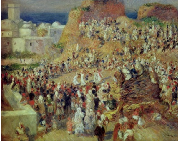
Fig. 13. Pierre Auguste Renoir, Arap Festivali , 1881, tuval üzerine yağlıboya, 73,5 x 92 cm, Musée D'Orsay, Paris.

Arap Festivali (1881) (Fig. 13), Renoir'ın 1881 ve 1882 bahar aylarında Cezayir'e yaptığı yolculuklardan gelen bir düzine resim içinde en önemlisi olarak değerlendirilir. Renoir'ın betimlediği kutlama tam olarak saptanamamıştır. Bu bir dinsel kutlama olabilir ya da daha büyük bir olasılıkla, Kuzey Afrikalı gezgin müzisyenlerin gösterileri olarak düşünülebilir. Resmin merkezinde, büyük bir kalabalığın ortasında, tef ve flüt çalan beş müzisyen halka oluşturmuşlardır.