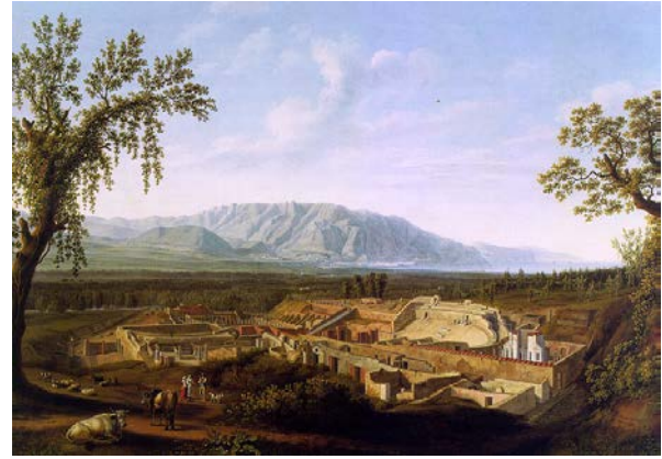
Fig. 5. Jacob Philipp Hackert, Pompeii Kazıları , 1799, tuval üzerine yağlıboya, Attingham Park, Shropshire.

Jacob Philipp Hackert (1737-1807), 18. yüzyılı etkileyen arkeoloji heyecanını tuvallerine taşıyan diğer bir ressam olarak dikkat çekmektedir. Sanatçı, 1799 tarihli Pompeii Kazıları adlı eserinde (Fig. 5), geniş bir Napoli Körfezi manzarası içine, Pompeii kentinin kalıntılarını yerleştirmiştir. Hackert, 1792 ve 1794 yılları arasında, Pompeii kazılarını birkaç kez betimlemiştir. Amfi tiyatrosu, evleri ve sokakları ile detaylı bir şekilde gösterilen Pompeii kentinin yakınındaki tepede birkaç kişi ve hayvan, sakin havanın tadını çıkarmaktadır. Kırsal yaşamın bu huzurlu üyeleri, antik Pompeii zamanından bu yana bazı şeylerin değişmediğini hatırlatmak ister gibidir (Tarabra, 78). Tischbein gibi, Goethe ile yakın arkadaş olan Hackert, 1790 tarihli Goethe Colosseum'u Hayranlıkla İzlerken adlı resminde, hem Goethe ile kurduğu dostluğu hem de onunla paylaştığı antik Roma uygarlığı ve Colosseum hayranlığını ölümsüzleştirmiştir.