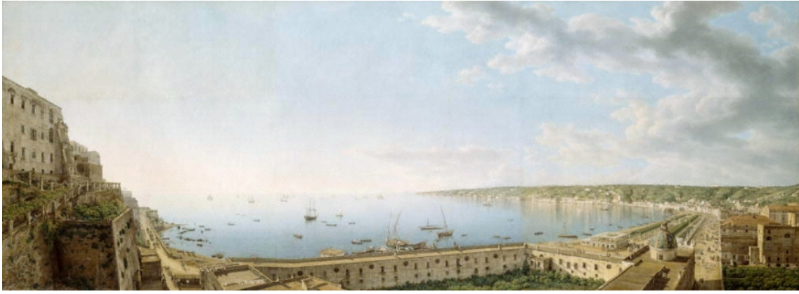
Fig. 3. Giovanni Battista Lusieri, Napoli Körfezi Manzarası: Pizzofalcone'den Capo di Posilippo'ya Güneybatı Bakışı , 1791, altı tane kâğıt üzerine suluboya, guaş ve mürekkep, J. Paul Getty Museum, Los Angeles.

655). Vernet, kırmızı, turuncu ve sarı renklerin yumuşak tonlarını yansıtan 1770 tarihli Bir Akdeniz Limanında Sükûnet adlı eserinde (Fig. 2), sakin geçen bir günden sonra gelen günbatımı sahnesini betimlemiştir. Balıkçılar, kayıklarını temizleyip, ağlarını toplamaktadırlar. Limandaki insanlar sohbet etmekte; oryantal giysili bir grup, limana yanaşmış olan bir gemi hakkında konuşmaktadırlar. Sol tarafta bir deniz feneri, daha uzakta ise adını bilmediğimiz bir kentin silüeti dikkat çekmektedir. Deniz sakinken, kent ve insanlarına tatlı bir huzur duygusunun hâkim olduğu görülmektedir. Vernet, bu resimden üç sene önce tamamladığı Bir Akdeniz Limanı'nda Fırtına (1767) adlı eserinde ise, denizin bambaşka bir halini canlandırmış, kızgın dalgaların üzerinde uzanan karanlık bulutlar yansıtmıştır. Vernet, her iki tuvalinde de, insanların deniz ile kurduğu ilişkiyi yansıtmaktadır. Akdeniz, kimi zaman yardımseverliği, kimi zaman ise öfkesi ile kıyılarında yaşayan insanların yaşamlarına dokunmaktadır.