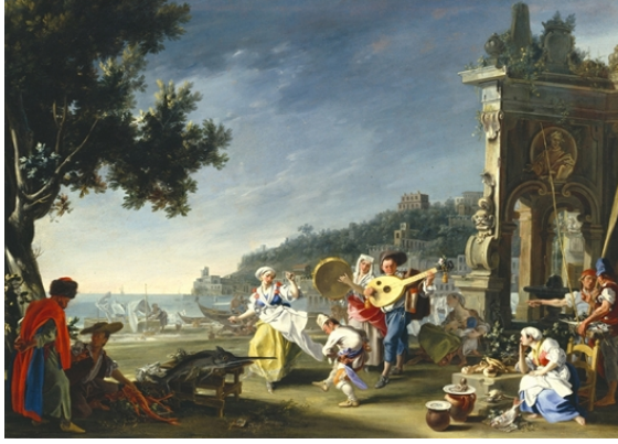
Fig. 1. Filippo Falciatore, Mergellina'da Tarantella , yak. 1750, tuval üzerine yağlıboya, 76,2 x 102, cm, Detroit Institute of Arts, Michigan.

Avrupa resim sanatında, Akdeniz'in, Akdeniz'de yaşayan insanların ve bu denizi paylaşan farklı kültürlerin izleri arandığında, renkli bir dünya ile karşılaşılır. Üç kıtanın, Avrupa, Asya ve Afrika'nın yerel özellikleri, bir denizin çevresinde, etkileşim içinde var olmaktadır. Akdeniz kadınlarının güzelliği, tuvalerde yeniden hayat bulur. Bir resim İtalyanların dansını yansıtırken, diğeri Cezayir'deki festivali canlandırır. Bereketli Akdeniz toprağı, zengin ürünleriyle betimlenir.