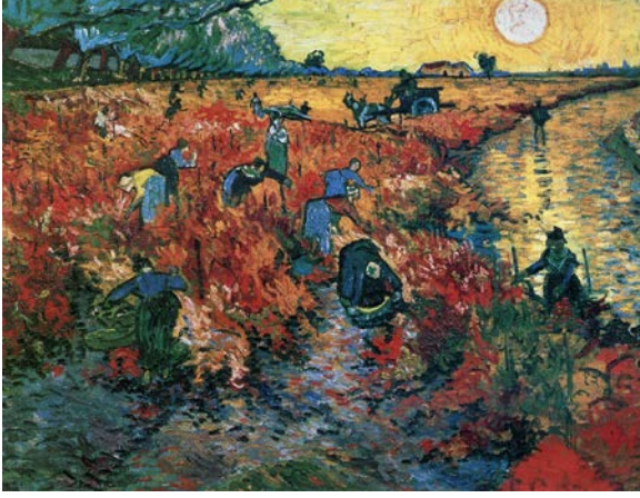
Fig. 11. Vincent van Gogh, Arles' te Kırmızı Bağ , 1888, tuval üzerine yağlıboya, 75 x 93 cm, Pushkin Museum, Moskova.

Botticelli resmindeki gibi betimlemeye çalışıyorum. Bu gerçekleşmeyecek bir rüya... Buranın tüm genç manzara ressamı için neden büyük bir atölye gibi algılanmadığını anlayamıyorum. Güzelliğinin yanı sıra, sakin iklimi sayesinde de en ince araştırmalara olanak sağlıyor” (Higonnet, 1995, 199).