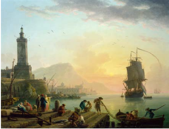
Fig. 2. Claude-Joseph Vernet, Bir Akdeniz Limanı'nda Sükûnet , 1770, tuval üzerine yağlıboya, J. Paul Getty Museum, Los Angeles.

Rokoko döneminin İtalyan ressamlarından Filippo Falciatore (1728-1768), Mergellina'da Tarantella (yak. 1750) adlı resminde (Fig. 1) açık havada yapılan bir dansı betimlemiştir. Mergellina, Napoli'ye yakın bir kenttir. Resmin arka planındaki tepe üzerinde yer alan birkaç yapının, bu İtalyan kentine ait olduğu düşünülebilir. İki tane müzisyene eşlik eden coşkulu