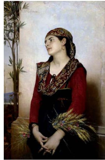
Fig. 8. Jules Joseph Lefebvre, Akdeniz Güzeli , pano üzerine yağlıboya, 34 x 51,5 cm. Özel Koleksiyon.

Akdenizli kadın imgesini değerlendiren sanatçılar arasında, Fransız akademik resim anlayışında eser veren Jules Joseph Lefebvre'nin (1836-1911) adı anılabilir. 1861 yılında, Prix de Rome'u (Roma Ödülü) kazanan sanatçı, bir süre Roma'da bulunmuştur (Norman, 1977, 130). Lefebvre, Akdeniz Güzeli adlı resminde (Fig. 8), elinde başak taneleri tutan, kırmızı siyah giysili bir köylü kadını betimlemiştir. Düşüncelere dalmış ve gözlerini uzakta bir yere çevirmiş olan kadının saçlarını, desenli eşarbi örtmektedir. Akdeniz güzelinin beyaz ten rengi, üzerindeki koyu giysiyle tezat yaratmaktadır. Resmin sol tarafında, kadının köyüne uzak bir noktada, Akdeniz olduğunu düşünebileceğimiz bir mavilik uzanmaktadır. Hem Fransız hem de İtalyan kültürlerini yakından tanıyan Lefebvre'nin, bu güzel kadını yaratırken, her ikisinden de ilham aldığı düşünülebilir.