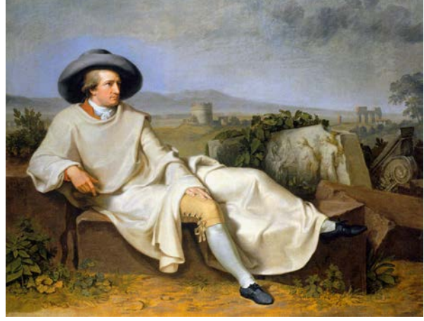
Fig. 4. Johann Heinrich Wilhelm Tischbein, Goethe Roma'nın Kırlarında , 1787, Städelsches Kunstinstitut, Frankfurt.