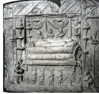
Fig. 5: Lectus funebris 59

Eller cinsiyetine göre şekillendirilip beden kefenlendikten sonra prothesis 60 töreni için naaş açık bir tabuta yerleştirilirdi. Kiliseye taşınması yürüyüş alayı eşliğinde gerçekleştirilmekteydi (Fig. 6). Bu yürüyüş alayı seremonisi Paganlardaki cenaze törenlerinde de var olan bir ritüeldir (Fig. 7) 61 .