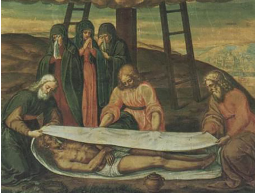
Fig. 2: Ölü bedeninin kefenlenmesi 46

ne, ait olduğu cinsiyete göre pozisyon verilmesi 3. yüzyılda başlamış olup devam eden süreçte Orta Çağ içlerine değin sürdürülmüş bir uygulamadır 45 .