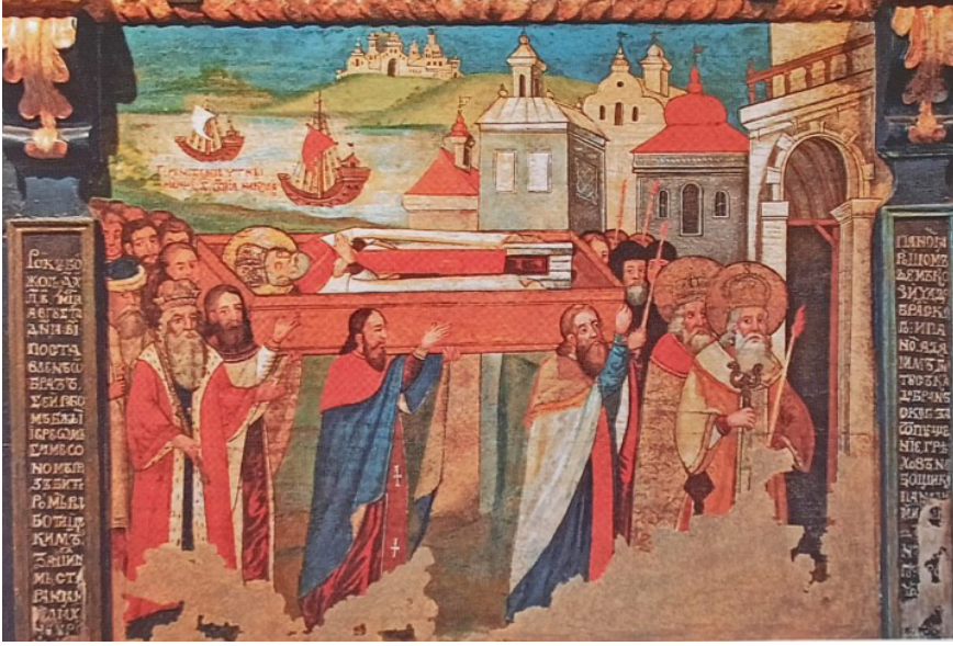
Fig. 10: Defin hazırlığı 80

Entepihos adı verilen, ölünün mezara yerleşmesi işleminde ölü bedeninin başı her daim Hz. İsa'nın doğduğu ve öldüğü yer olan Kudüs'e, yani doğuya bakacak şekilde konumlandırılır; bir lahitse lahitin içine konur, basit toprak gömü olarak planlanmışsa toprağa yatırılarak gömülürdü 81 . Akabinde mezar başında bir yakını konuşma ( epitaphios logos ) yapardı. Ölünün ardından yas tutma süresi yasalarla dokuz gün olarak belirlenmiştir. Ölümün ardından üçüncü, dokuzuncu ve kırkıncı günlerde 82 anma ( panikhid ) merasimleri yapılırdı. Ruhun bedenden ayrılışını aşamalandıran bu Pagan kökenli anma törenleri, Hristiyanlar tarafından da benimsenmiş hatta günümüzdeki İslam inancında da sürdürülmektedir.