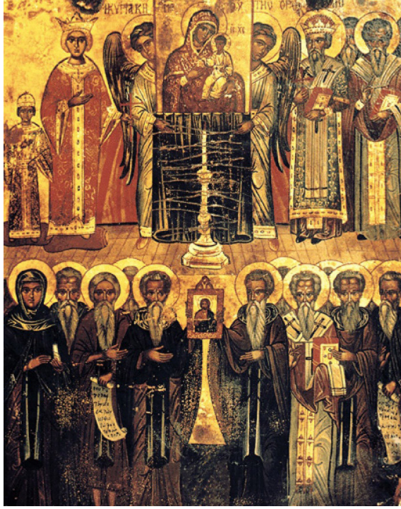
Fig. 8: Hristiyan cenaze alayında taşınan Meryem ikonası 64

Her ne kadar Hristiyanlık teolojisinde ölüm kurtuluş olarak görülse de tüm bu hazırlıklar esnasında ölen kişinin yakınları tarafından tıpkı Paganlar da olduğu gibi ölen kişiye övgülerle ağıtlar yakma alışkanlığı devam ettirilmiştir.