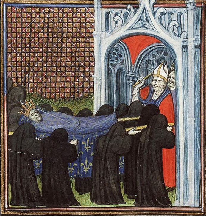
Fig. 9: Kilisede düzenlenecek cenaze törenine hazırlık 68

Bu törenlerde eğer ölen kişi erkek ise cenazesi, apsinin soluna, kadın ise cenazesi apsinin sağına yerleştirilirdi. Yüksek mertebeli bir din adamı olması durumunda ise göğsüne konulan kutsal kitapla birlikte cenaze, sunak masasının önünde, tabutun dört bir tarafı haç oluşturulacak bir şekilde, diriliş ve gelecekteki sonsuz yaşamı temsil eden mumlarla çevrelenirdi 69 . Açıkta bulunan başın alın kısmına üzerinde deesis (yakarış betimi) betimi bulunan bir bez şerit yerleştirilirdi. Deesis sahnesi Meryem ananın ve vaftizci Yahya'nın tüm insanların affi için yakarışlarını tasvir eden bir betim olduğu için ölüm kültürüyle alakalı olarak çok kullanılmış bir temadır 70 . Tabut, yüzü Hz. İsa'nın tüm ölüleri diriltmek için geleceği yön olan doğuya bakacak şekilde yüksek bir kaide üzerine yerleştirilirdi. Khrysostomos'un " Tabutu doğuya bakacak şekilde yerleştirdik, böylece gelecek olan dirilişi işaret etsin " 71 sözlerinden de anlaşılacağı gibi bu durumun gelecekteki diriliş beklentisi için olması muhtemeldir. İlahi yazarı Aziz Ioannes'in de dile getirdiği " Gelin kardeş-