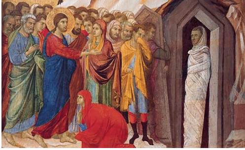
Fig. 4: Lazarus'un kefenle sarılı betimi 58

Cansız bedenın yıkanıp yağlanmasıdan sonra bezlerle sarılması, bedenın sıkıca, dimdik durabilmesi ve bozulmaması için alınan bir tedbirdir. Homeros'ta ölünün çıplak olarak gömülmesi ölüye karşı yapılan bir saygısızlık olarak geçmektedir 53 . Pagan Roma İmparatorluğu'nda ise özellikle varlıklı ailelerin zenginlik gösterisine dönüşmüştür. Hristiyan Roma İmparatorluğunda ise bu uygulama başlangıçta kilisenin çok eleştirdiği bir durumken sonraları Hristiyanlaşarak, kilise litürjisine eklenmiştir 54 . Örneğin Ioannes Khrysostomos, ölülerin değerli kıyafetler giymemesini, gidecekleri yerde onlara ihtiyaçları olmadığını savunmuştur 55 . Ölü bedene en uygun, en güzel giysileri giydirerek prothesis töreninde sergilemek ve daha sonra bu giysilerle gömmek Hristiyanlıkta bir gelenek halini almıştır 56 . Bu durumu Nyssalı Gregorios ve Selanikli Aziz Symeon anlatmaktadır 57 .