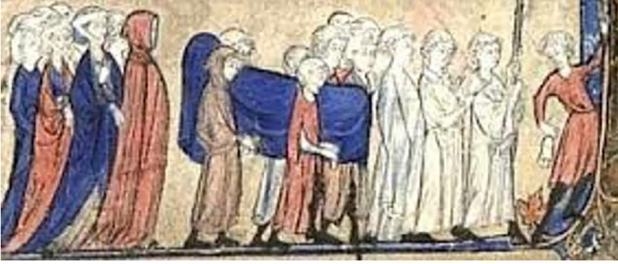
Fig. 6: Hıristiyanlık cenaze yürüyüş alayı 62