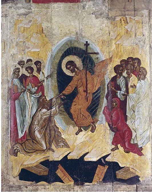
Fig. 1: İsa peygamber ölüler dünyasında 23

geçici olarak kısmi cennet veya kısmi cehennemde tutulduğuna inanılırdı. Beden ise mahşer günü geldiğinde ruhuyla tekrar birleşip dirileceği zamanı beklerken “uyku” sürecindedir. Geç Antik Çağ'da imparatorluğun doğusunda yaşayan halk için ölüm, uyku sürecidir. Özellikle kutsal kişilerden bahsederken ölüm kelimesinin tam karşılığı olan “ tanados ” yerine uyku anlamına gelen “ koimesis ” kelimesi kullanılmıştır 19 . Paul Fedwick'in de dediği gibi “Mezar ruhsuz bedenlerin dirilmek beklentisi içinde dinlendikleri bir uyku odası, geçici bir bekleme yeridir” 20 . Ölüm hakkında bu düşüncenin hâkim olduğu bu tek tanrılı dinde, mahşer gününde dirilerek İbrahim peygamberin kucağında bekleyen ruh ile birleşme, tanrı katına çıkıp tanrıyla bütünleşme ve böylece tanrısallaşma söz konusudur 21 . Bunun içindir ki Hristiyanlık ikonografisinde “ölüm” değil “ölümsüzlük” ana tema olmuştur 22 .