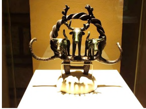
Şekil 7: Alacahöyük Hitit Güneş Kursu (Kaynak: Atay, 2020)

Anadolu medeniyetlerinden kuşkusuz en önemlilerinden biri olan Hititlerin de kültüründe geyik ayrı bir yere ve öneme sahiptir (Sir Gavaz, 2016, .79-91). Atatürk'ün emri ile Alacahöyük'ten çıkarılan Hitit Güneşi kursunun içinde odak noktası merkezdeki büyük figür olan geyiktir (Şekil 7).