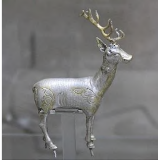
Şekil 4: Bilge Kağan'ın Mezarından Çıkarılan Gümüş Geyik

Yine Göktürk Kağanı Bilge Kağan'a ait mezardan 2001 yılında ki arkeolojik kazılarla ortaya çıkarılan eşyalar arasında gümüş malzemeden yapılmış bir geyik bulunmuştur(Şekil 4).