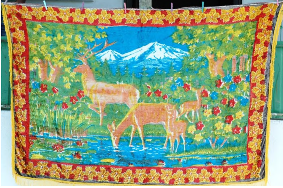
Şekil 20: 7 Numaralı Duvar Halısı