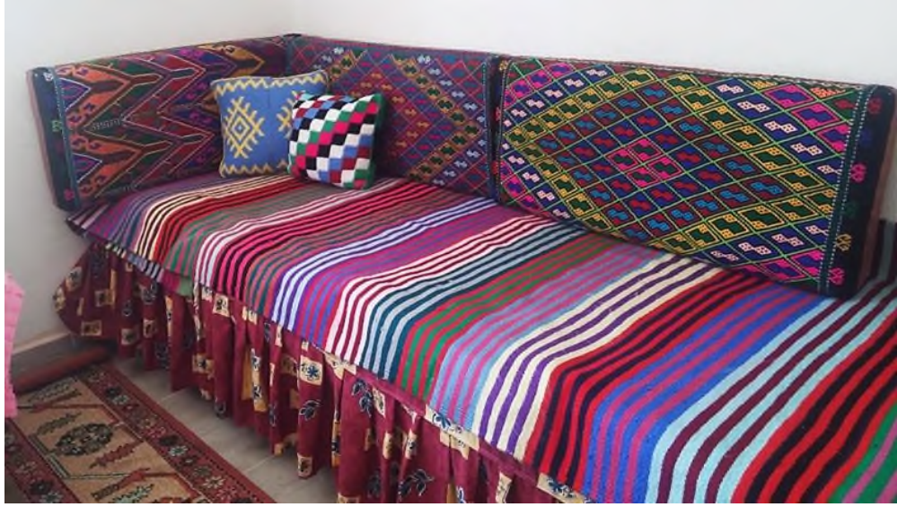
Şekil 13: Evciler Köyü'nden Dokunan kilim ve Berdi Yastık

Evciler, Yozgat'ın 13 ilçesinden biri olan Çayıralan'a bağlı bir köydür. Evciler Köyü ormanlık bir alana sahiptir. Bu nedenle köyde hayvancılık ve ağaç işçiliği gelişmiştir. Ağaçtan kilim dokuma tezgâhu, oklava, evrağaç (Sac üzerinde yapılan yufka ekmekleri çevirmede kullanılan alet) gibi eşyalar yapmışlardır. Köyün genel geçim kaynağının hayvancılık olması sebebi ile dokumacılık da gelişmiştir. Dokumacılık alanında özellikle düz dokuma ürünleri: kilim, heybe, çanta, berdi yastık, çul gibi dokumalar daha sıklıkla yapıldığı görülmektedir (Şekil 13).