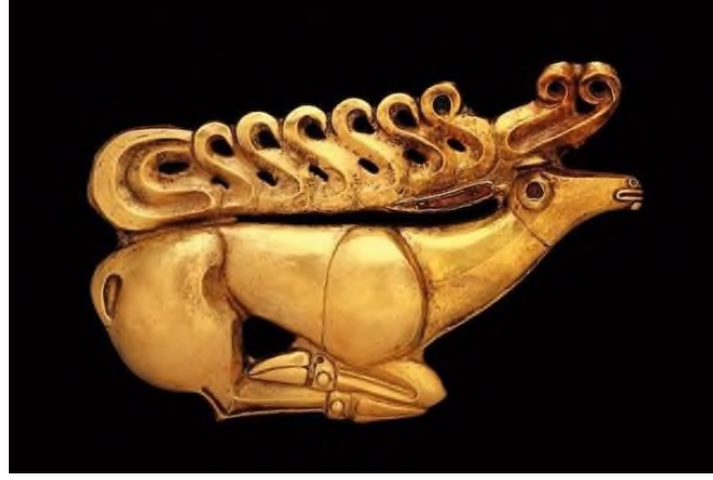
Şekil 3: Hermitage Müzesi'nde Sergilenen İskit İşi Geyikli Plaka

Yine Göktürk Kağanı Bilge Kağan'a ait mezardan 2001 yılında ki arkeolojik kazılarla ortaya çıkarılan eşyalar arasında gümüş malzemeden yapılmış bir geyik bulunmuştur(Şekil 4).