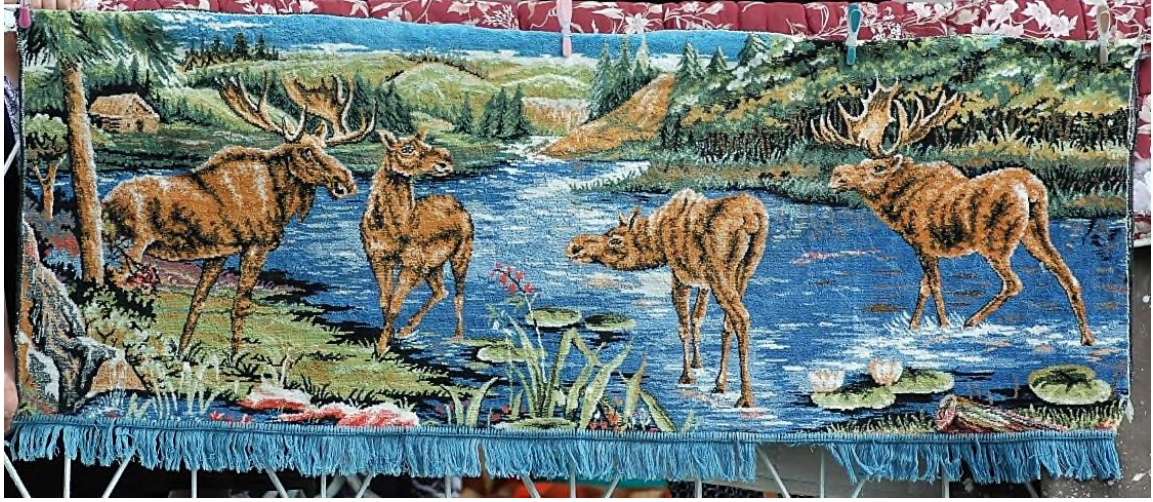
Şekil 19: 6 Numaralı Duvar Halısı

diğeri de sudakileri izlerken karada işlenmiştir. Boynuzları ve vücutları daha kaslı ve büyük çizilen erkek geyiklerin yüz ifadeleri de dişi geyiklere göre daha sert ve ciddi tasvir edilmiştir. Su üstünde yüzen nilüfer (lotus) çiçekleridir. Nilüfer çiçeği bereket, saf, temizlik ve yeniden doğuş simgesidir (Üçer; Üçer, 2018). Halının altında uzunlamasına doğru bebek mavisi renginde bir püskülü bulunmaktadır. Halının renklerinde ya da kumaşında hiçbir deformasyon olmadan günümüze ulaşabilmiştir (Şekil 19).