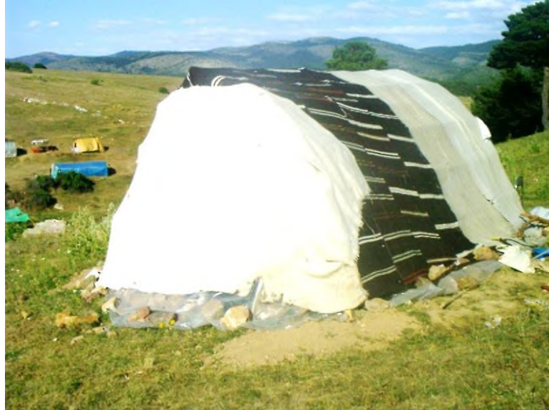
Şekil 12: Evciler Köyü'nden Alaçık Kilimi

Türk halı sanatında önemli bir diğer halı grubu ise Selçuklu (Konya Halıları, Uşak halıları) ve Osmanlı (saray halıları, Uşak halıları) halılarıdır. Hayvan figürü, 14. yüzyıl itibari ile Anadolu halılarına işlenmeye başlamıştır. Bu yüzyılın başında daha sade ve stilize hayvan motifleri kullanılırken, 14. yüzyıl sonlarına doğru hayvan mücadele sahnelerine yer verilmiştir (Aslanapa, 1987, s.99-109). Makineleşmenin gelişmesi ile el dokuması azalsa da günümüzde halen el dokuma halısı yapan iller (Kars, Kayseri, Afyon, Isparta, Uşak) mevcuttur. İlmek ilmek “dokudukları motiflere farklı farklı isimler vermişlerdir. Motiflerin isimlerinin birkaçı şöyledir: Göz, kuş, eli böğründe (belinde), koçboynuzu, hayat ağacı, su yolu, bıtırak, çavuş nişanı, kirmen, sultan küpesi, yıldız gibi motiflerdir. Halılarda Türk düğümü olarak bilinen Gördes düğümü kullanılmıştır. Türkler göçebe bir topluluk olduklarından dolayı halı boyutları çok büyük yapılmamıştır. Yazın yaylaya çıktıkları için çadırların üzerini kapatabilecekleri boyutlarda halılar, kilimler ve kıl çullar dokumuşlardır (Şekil 12).