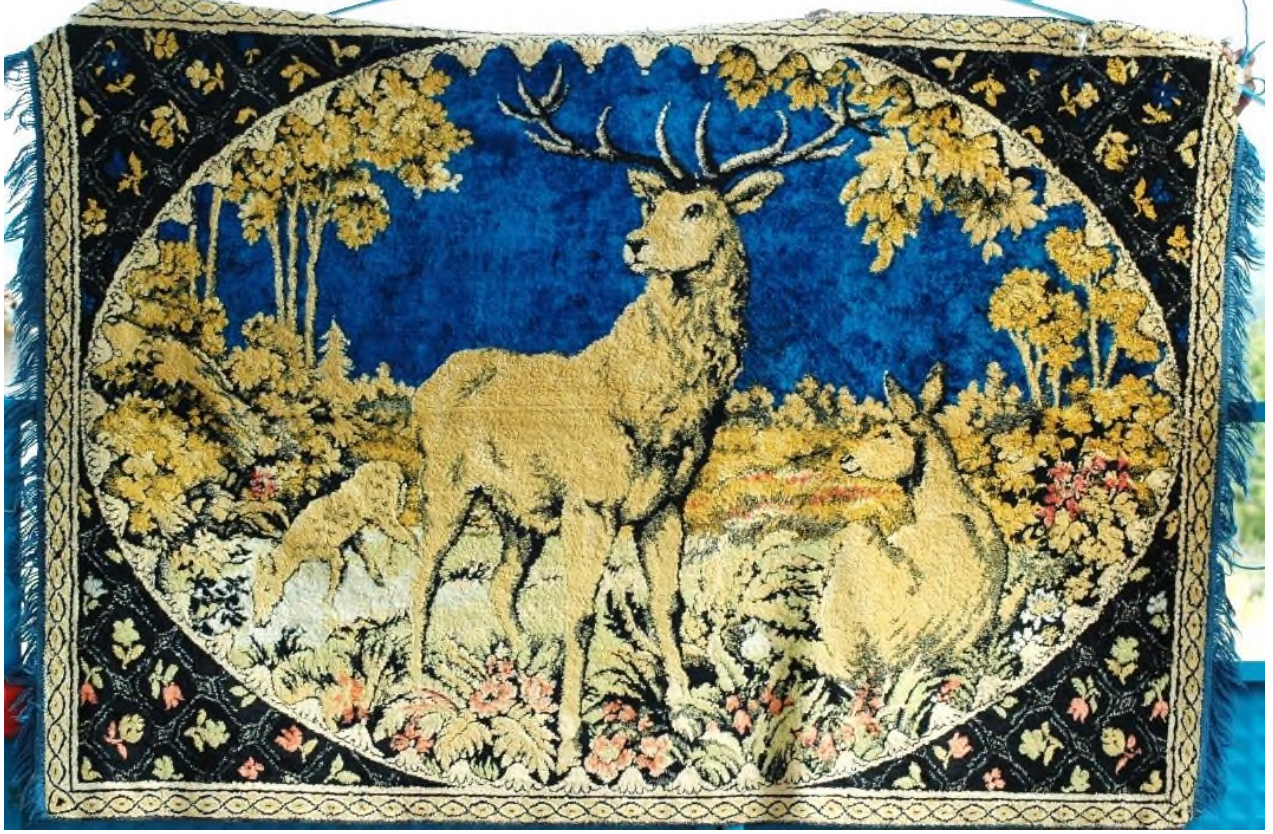
Şekil 18: 5 Numaralı Duvar Halısı

Halıyı bir bordür çevrelemektedir ve içinde diğer iki halıda (3 ve 4 Numaralı) olduğu gibi bordür içinde suyolu motifi yer almaktadır. Halının iki kenarında mavi renkli püskülleri mevcuttur. Duvar halısında hiçbir deformasyon olmadan günümüze gelmiştir (Şekil 18).