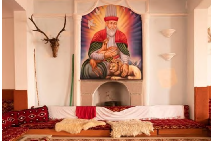
Şekil 8: Hacı Bektaş-ı Veli Tablosu

bu tasvirlerde daha üstte resmedilerek aslandan daha kutsal ve ilahi bir kimlik kazanmıştır şeklinde yorumlanabilir. Bugün Ankara Mamak Hüseyin Gazi Cemevi duvarındaki tasvirde Hacı Bektaş-ı Veli kucağında bir geyik ve arkasında kutsal bir ışıkla verilmiş olması şahsiyetin kutsallaştırılmasının imgeleştirilmesi olarak görülmektedir. Ayrıca bu tasvirin yer aldığı aynı duvarda, boynuzları ile dikkat çeken büyük bir geyik başı yer almaktadır. (Şekil 8).