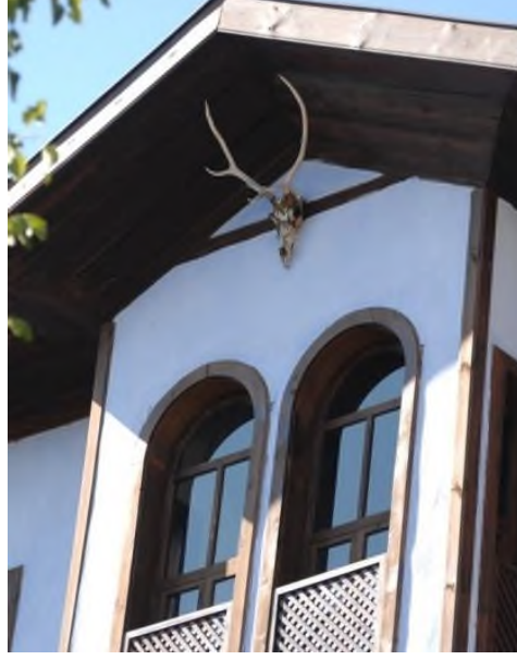
Şekil 6: Safranbolu Evlerinde ki Geyikler

Anadolu medeniyetlerinden kuşkusuz en önemlilerinden biri olan Hititlerin de kültüründe geyik ayrı bir yere ve öneme sahiptir (Sir Gavaz, 2016, .79-91). Atatürk'ün emri ile Alacahöyük'ten çıkarılan Hitit Güneşi kursunun içinde odak noktası merkezdeki büyük figür olan geyiktir (Şekil 7).