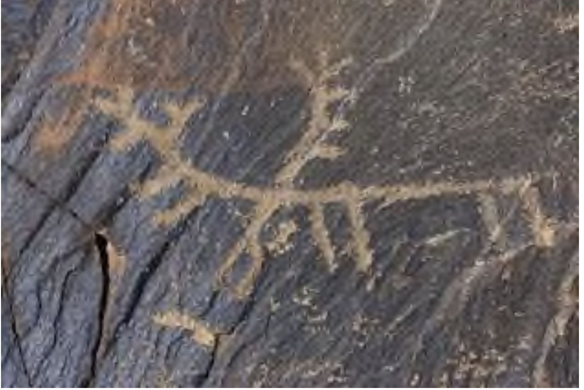
Şekil 5: Hakkâri Tirişin Yaylası Petroglifi (Kaynak: Bayraktar, 2019)

Bugün Geç Osmanlı dönemine ait Safranbolu evlerinde kötü gözlerden koruduğu ve uğur getirdiği inancı ile evlerin çatılarına geyik kafası ve boynuzu asma geleneğinin devam etmiş olması da dikkat çekicidir. (Şekil 5,6). Bu geleneğin Anadolu’nun bazı köylerinde sürdürüldüğü de bilinmektedir.