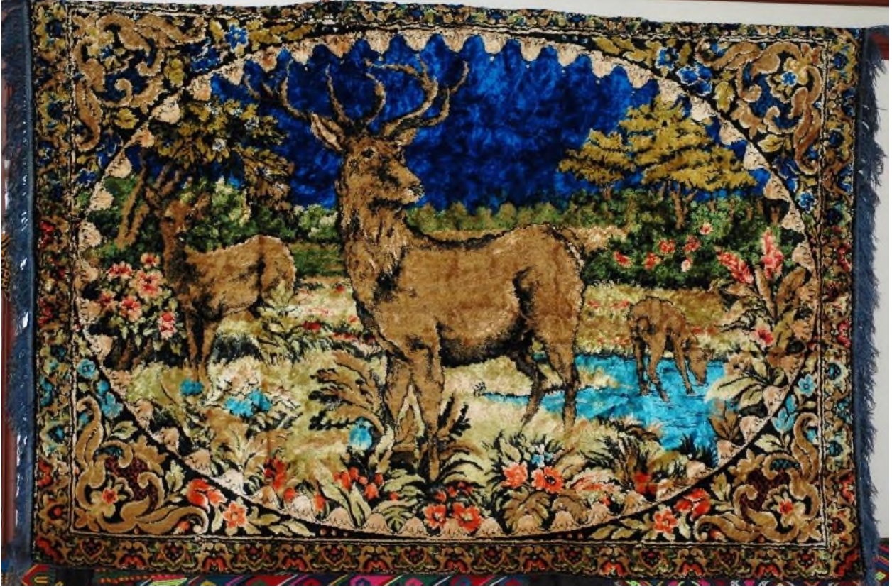
Şekil 16: 3 Numaralı Duvar Halısı

ise natüralist çiçeklerle ve kıvrık dallarla dolgunlaştırılmıştır. Ana kompozisyonda ormanlık alanda iki geyik yavrusu ve bir büyük erkek geyik motifi doğal ortamlarında betimlenmiştir. Yavrulardan biri gölde su içer şekilde, diğeri ise sol köşede karşıya doğru bakıyor vaziyette, ana figür erkek geyik ise halının tam ortasında kafası sağa dönük şekilde betimlenmiştir. Ortadaki ana geyiğin başı 3/2 profilden verilmiş olup; boynuzları bütün ihtişamı ile işlenmiştir. Geyiğin yüz ifadesinde bir sakinlik ve hüzün hâkimdir. Halının kısa kenarlarında mavi püskülleri bulunmaktadır. Duvar halısı günümüze sağlam ulaşmıştır (Şekil 16).