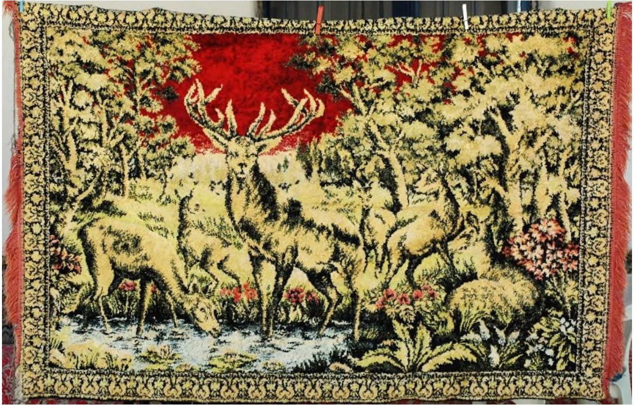
Şekil 15: 2 Numaralı Duvar Halısı

ve kompozisyonda tasarlanmış, sadece fon bu halıda mavi değil kırmızı renklidir. Halının çözgüsü pamuklu beyaz ipten, atkısı ise ipek ipten kırmızı, açık mavi, siyah, hardal sarısı renkler kullanılmıştır. Kalabalık bir kompozisyona sahiptir. Duvar halısı, boşluk bırakılmaksızın halının bütün yüzeyi işlenmiş ve çift bordürle çevrelenmektedir. Kırmızı ana taban üzerinde beş geyik yavrusu ile bu yavruların tam ortasında bir büyük erkek geyik motifi işlenmiştir. Bu halıda da 1 Numaralı halıda olduğu gibi; yine merkezdeki ana geyik odak noktaya, yani izleyiciye bakmaktadır. Ana geyik motifinin plastik ifadesi dingin ve kendinden emindir. Halının kompozisyonu ormanlık alanda geçmektedir. Halının kısa kenarlarında narçiçeği renginde püskülü bulunmaktadır. Duvar halısının bazı renkleri solması dışında sağlam muhafaza edilmektedir (Şekil 15).