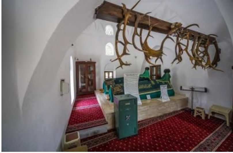
Şekil 10: Geyikli Baba Türbesi

Osmanlı Dönemi'nde önemli âlimlerden biri olan Geyikli Baba İran'da doğup, Bursa'da yaşamına devam etmiştir. Gerçek adı Hasan'dır (Bakırcıoğlu, 2003). Bursa'nın fethine geyik üzerinde katılmıştır. Bunu duyan Orhan Gazi, Geyikli Babayı davet ettirmiştir (Öztürk, 2013). Geyikli Baba rivayete göre Abdal Musa'ya geyik sütü içirerek onu geyikler ile akraba yapmıştır (Ayan, 2016 s.295-323). Orhan Gazi, Geyikli Baba'ya bir arsa tahsis ederek Geyikli Baba Külliyesi'nin kurulmasını sağlamıştır (Taş, 2020). Günümüzde önemli bir kült ve ziyaret yeri olan Geyikli Babanın Türbesi, Bursa'da bulunmaktadır (Şekil 10).