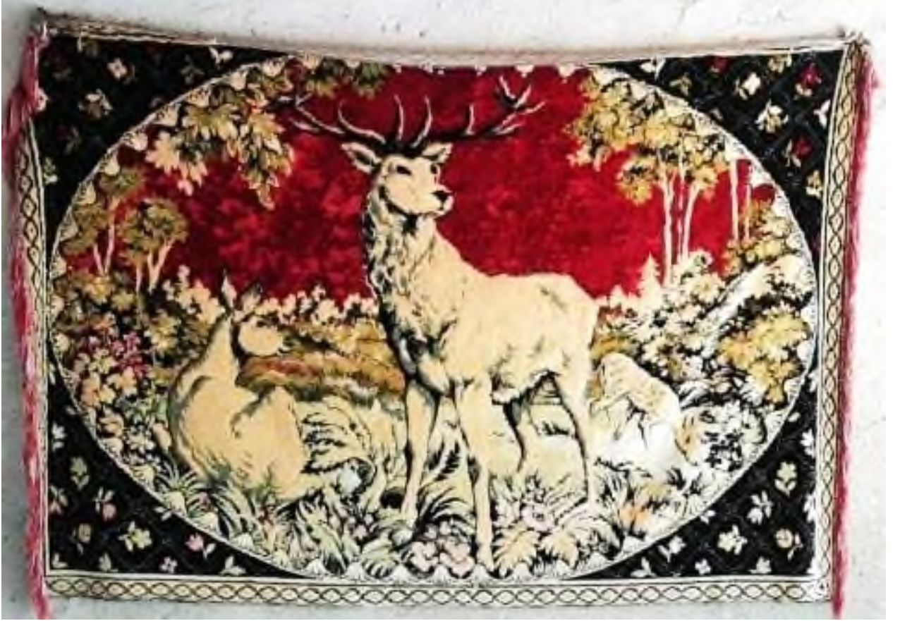
Şekil 17: 4 Numaralı Duvar Halısı

sakin bir yüz ifadesi bulunmaktadır. Boynuzları iki yana ayrılarak abartılı bir biçimde tasvir edilmiştir. Elips içinde ana kompozisyon bulunurken; elipsin dışında kalan her köşede bulunan alanlar içine küçük kareler olacak şekilde papatya ve lale gibi natüralist üslupta çiçek motifleri işlenmiştir. Halıyı çevreleyen bir su yolu motifli bordür mevcuttur. Duvar halısının iki yanında gülkurusu rengi püskülleri bulunmakta ve halı günümüze sağlam ulaşmıştır (Şekil 17).