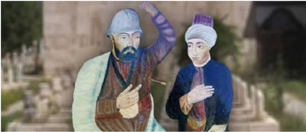
Şekil 9: Abdal Musa ve Kaygusuz Abdal’ın Efsanesinin Görseli

Türk kültür ve edebiyatındaki bir rivayet ise geyik figürüdür. Bu figür: “Alaiye Sancak Bey’inin oğlu Gaybi Bey bir gün ava gider. Avda bir geyik önüne çıkar ve geyiğe bir ok atarak koltuğunun altından yaralar. Yaralanan geyik koşarak oradan uzaklaşır. Kaçtığını gören Gaybi Bey arkasından giderek takip eder ve geyiğin bir tekkeye girdiğini görür. Koşarak oda tekkeye girerek, geyik nerede diye sorar. Dervişlerin hiç biri geyiği görmediklerini söylerler. Olayı Abdal Musa’ya anlatırlar. Kendini tanıyıp tanımadığını soran Abdal Musa, kolunu kaldırıncaya Gaybi Bey orada şaşırır kalır. Geyik donuna girmiş Abdal Musa olduğunu anlar ve artık oda bu tekkeye katılır” (Ayan, 2021, s.295-323) şeklinde görülmektedir. Efsanede geçen Gaybi Bey bugün kendi adı ile değil, Kaygusuz Abdal ismi ile tanınmaktadır. (Şekil 9).