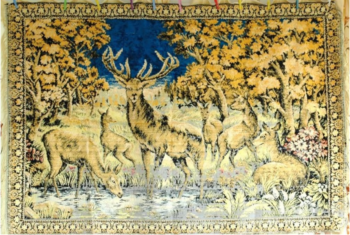
Şekil 14: 1 Numaralı Duvar Halısı

Kalabalık bir kompozisyona sahip duvar halısı: iki bordür ile çevrenmekte ve orta panoda ise beşi yavru olmak üzere altı geyik motifinden kompozisyon oluşmaktadır. Duvar halısının bütün yüzeyi boşluk bırakılmaksızın işlenmiştir. Kenar bordürlerde stilize çiçekler görülmektedir. Farklı hareketlerde ve boyutlarda betimlenen geyik yavruları çevreyi gözetlerken verilmişken, halının tam merkezinde ki büyük erkek geyik halıya bakan kişiye odaklanmış, şekilde tasvir edilmiştir. Tam cepheden boynuzları iki yana doğru açılarak betimlenen geyiğin yüz ifadesinde bir sakinlik bulunmaktadır. Halının kompozisyonu ormanlık alanda bir su kenarında geçtiği için genel olarak bitki ve hayvanlardan oluşmaktadır. Duvar halısının iki kısa kenarında krem renkli püskülleri mevcuttur. Duvar halısının bazı renkleri solması dışında sağlam olarak günümüze ulaşmıştır (Şekil 14).