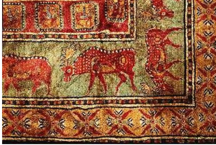
Şekil 11: Pazırık Halısı Üzerinde Bulunan Geyik Motifleri

Türk halı sanatında önemli bir diğer halı grubu ise Selçuklu (Konya Halıları, Uşak halıları) ve Osmanlı (saray halıları, Uşak halıları) halılarıdır. Hayvan figürü, 14. yüzyıl itibari ile Anadolu halılarına işlenmeye başlamıştır. Bu yüzyılın başında daha sade ve stilize hayvan motifleri kullanılırken, 14. yüzyıl sonlarına doğru hayvan mücadele sahnelerine yer verilmiştir (Aslanapa, 1987, s.99-109). Makineleşmenin gelişmesi ile el dokuması azalsa da günümüzde halen el dokuma halısı yapan iller (Kars, Kayseri, Afyon, Isparta, Uşak) mevcuttur. İlmek ilmek “dokudukları motiflere farklı farklı isimler vermişlerdir. Motiflerin isimlerinin birkaçı şöyledir: Göz, kuş, eli böğründe (belinde), koçboynuzu, hayat ağacı, su yolu, bıtırak, çavuş nişanı, kirmen, sultan küpesi, yıldız gibi motiflerdir. Halılarda Türk düğümü olarak bilinen Gördes düğümü kullanılmıştır. Türkler göçebe bir topluluk olduklarından dolayı halı boyutları çok büyük yapılmamıştır. Yazın yaylaya çıktıkları için çadırların üzerini kapatabilecekleri boyutlarda halılar, kilimler ve kıl çullar dokumuşlardır (Şekil 12).