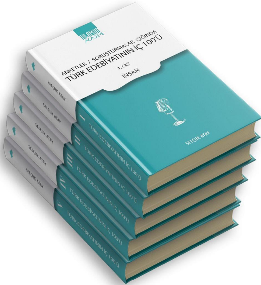
Fotoğraf 1: Anketler/Soruşturmalar Işığında Türk Edebiyatının İç 100'ü.

bilinemeyeceği düşünülen kısımlara eklemiştir. İkinci olarak bazı anketlere, anketlerin yapıldığı dönemde fikri sorulmayan sanatkarlar da kendi gazete köşelerinden cevap vermişlerdir. Arşiv taraması yaparken yalnız anketlere odaklanmayıp çapraz bir okuma yapan Atay bu anket dışındaki cevapları da dipnotlara eklemeye gereği duymuştur. Üçüncü olarak anketlerde bahsi geçen sanatkarların anketlere cevap verirken geleceğe yönelik bahsettikleri eserlerin akıbeti hakkında da dipnot düşülmüş, bu şekilde araştırmacılara büyük kolaylık sağlayacak bir yapı kurgulanmıştır. Son olarak anketlerde üzerinde durulan konuyla ilgili herhangi bir çalışma varsa bununla ilgili de kaynakçalar dipnot şeklinde gösterilmiştir.