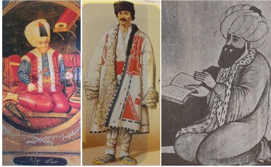
Resim 1: Osmanlı'da Kullanılan Kürk Modelleri 131

Biniş kürkün (ortadaki resim), kol boyu elleri kapatacak kadar uzun ve yan yırtmaç detayından yukarı katlanmışdır. Yakası mintan yakası şeklinde iki parmak uzunluğunda, boyu tam boy uzunluğuna yakındır. Buradaki biniş kürk kakum kürke benzemektedir. Dış kaplamasında ise beyaz, kırmızı, mavi ve siyah renkli derilerle süslenmiş bir ferde kullanılmıştır. Cübbe kürk (sağdaki resim) ise Ünver'in Fransızca basılmış Türk Kostümleri ile ilgili albümden edindiği minyatürler içerisinde yer alan şeyhülislam kıyafetinde görülmektedir. Orijinali renkli olup siyah beyaz baskı ile basılmıştır. Giysi, kol yenleri geniş ve tam boy uzun, içi yine kakum kürk, açık düz renkli bir kumaşla kaplanmış, yakası iki parmak uzunluğunda olan bir cübbedir. Tokat miras kayıtlarında mevcut olan kürklerin İstanbul'da yapılmış olan çağdaş eserlerde görülmüş olması oldukça önemlidir.