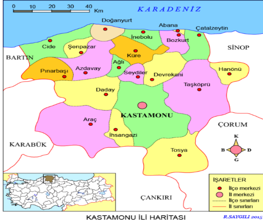
Şekil 1: Kastamonu İli Haritası

Kastamonu ili, Batı Karadeniz’de bulunmaktadır ve hem deniz hem de ormanlık alanlarıyla coğrafi açıdan önemli kaynaklara sahiptir. 19 ilçeye sahip olan Kastamonu’nun altı ilçesinin Karadeniz’e kıyısı bulunmaktadır. Doğuda Sinop, batıda ise özellikle yerli turist alan Bartın ve Karabük ile sınır komşusudur. Bu durum söz konusu ilin bilinmesi ve tanınması açısından önem taşımaktadır. Aşağıda Kastamonu il haritası verilmektedir.