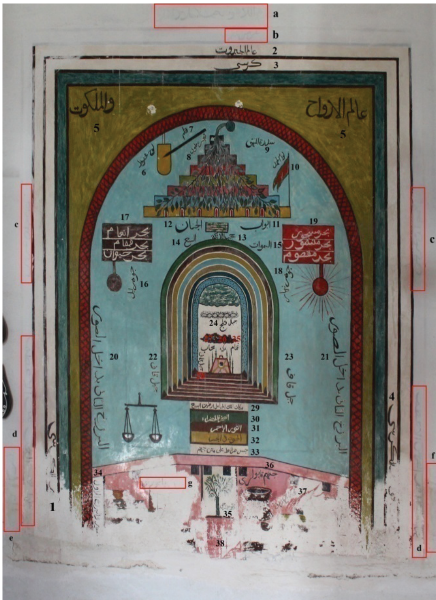
G. 6: Âlem-i lâhût tasviri (Buğdaycı, 2019)