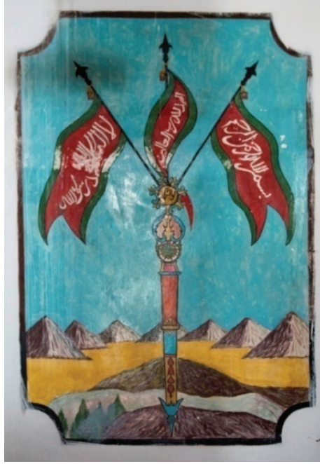
G. 10: Livâü'l-Hamd tasviri (Buğdaycı, 2019)