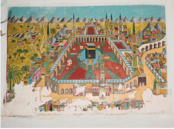
G. 13: Mekke tasviri. Tokmak Hasan Paşa Camii (Buğdaycı, 2019)

Yapının batı duvarına resmedilen enine dikdörtgen formdaki panonun ebatları 131x191 cm'dir. Mekke'de yer alan "Mescid-i Haram", pano içerisinde etrafındaki yerleşim alanı ve doğası ile birlikte verilmiştir. Tasvir irili ufaklı dağ sıraları ile sonlanmaktadır. Kompozisyon genelinde perspektif kuralları dönemine göre ustalıkla uygulanmıştır. Kalem işi tasvirin alt kısmında yer yer sıva müdahaleleri tespit edilmiştir. Bu sebeple kompozisyonun bazı kısımları günümüze gelememiştir. Ancak tasvirin geneli iyi durumdadır (G. 13).