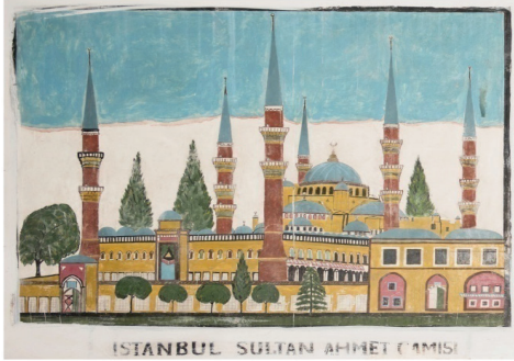
G. 11: Sultan Ahmet Camii tasviri. Tokmak Hasan Paşa Camii. (Buğdaycı, 2019)