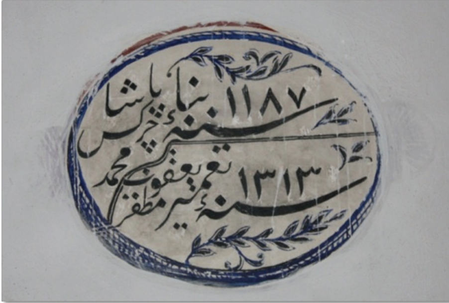
G. 1: Yapının kalem işi kitabesi (Buğdaycı, 2019)

Caminin banisi Çerkes Mehmed Paşa iken yapı Tokmak Hasan Paşa ismiyle anılmaktadır. Bazı araştırmacılara göre bu durumun sebebi, kardeş oldukları bilinen Çerkes Mehmed Paşa ile Tokmak Hasan Paşa'nın camiye birlikte yaptıkları ihtimalidir. 7 Caminin haziresinde yer alan ve yalnızca Tokmak Hasan Paşa'ya ait olan mezar taşı (M 1788 tarihli) okunabilir vaziyettedir. 8