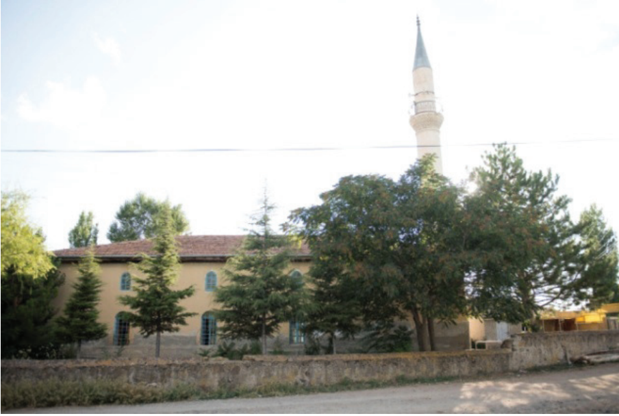
G. 2: Tokmak Hasan Paşa Camii'den genel görünüm (doğu cephe) (Buğdaycı, 2019)

göstermişler 10 ve taşradaki duvar resimli yapıların hızla yayılmasına etki etmişlerdir. Yozgat'ta Çapanoğulları'nın Başçavuşoğlu Camii, Çapanoğlu Camii ve Cevahir Ali Efendi Camii 11 gibi yapıları inşa ettirmeleri bölgedeki duvar resmi geleneğini başlatan etkenler arasındadır. Ayrıca, Çapanoğulları ailesinden Ahmed Ağa'nın Yozgat'ta bir medrese ve Saray Köyü'nde bir cami yaptırması da kentin gelişmesinde Çapanoğulları'nın inşa ettirdiği diğer yapılar ve vakıflarla birlikte önemli bir adım olmuştur. 12 Bunun yanı sıra mutasarrıf ve bölgenin ileri gelenleri tarafından yaptırılan köy camileri de yoğunluktadır. Tokmak Hasan Paşa Camii de yapı içerisindeki yoğun süslemeleriyle ön plana çıkan köy camilerinden biridir. (G. 2, G. 3)