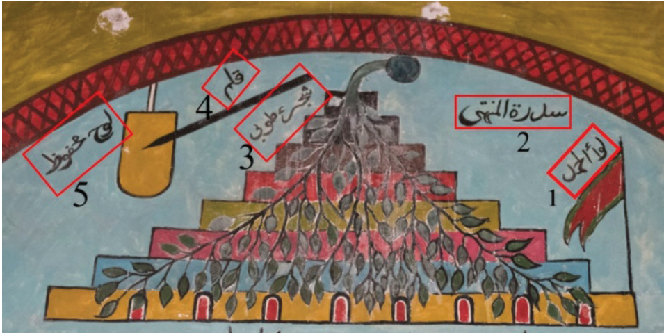
G. 7: Cennet tasvirinden detay (Buğdaycı, 2019)

rın da her biri cennet renklerinden kırmızı, mavi, sarı ve yeşil ile boyanmıştır (G. 7). Mârifetnâme , Mızraklı İlmihal ve Muhammediye yazmalarında sekiz cennetin, yakut, inci, altın ve mercan gibi değerli taşlardan meydana geldiği aktarılmaktadır. Bahsi geçen değerli taşların renkleri aynı zamanda cennetin de renkleridir. 20 “Âlem-i lâhût”taki cennet imgesinin yazma eserlerde kullanılan benzer sembol ve renklerle ifade edilmesi bu bağlamda anlam kazanmaktadır. Yazma eserlerin cennet imgesine yer yer “Livâü'l-Hamd”, “Levh-i maḥfûz”, “Sidretü'l-müntehâ”, “Hamd Dağı” ve kalem gibi unsurlar eşlik etmektedir. 21 Buradaki cennet tasvirinde de “Livâü'l-Hamd” (G. 7/1), “Sidretü'l-müntehâ” (G. 7/2), “Şecere-i tûbâ” (G. 7/3), “Kalem” (G. 7/4) ve “Levh-i maḥfûz” (G. 7/5) gibi el yazmalarında karşımıza çıkan semboller kompozisyona eklenmiştir. Cennet tasvirinin hemen alt hizasında sağ ve sol köşelerde üç satırlı birer dikkörtgen yazı panosuna yer verilmiştir. Siyah renk boyamalı yazı sütunu geceyi, kırmızı renkteki yazı sütunu ise alt köşesindeki güneş motifi ile gündüzi simgelemektedir. (Tablo 1 – G. 6/17 ve 19)