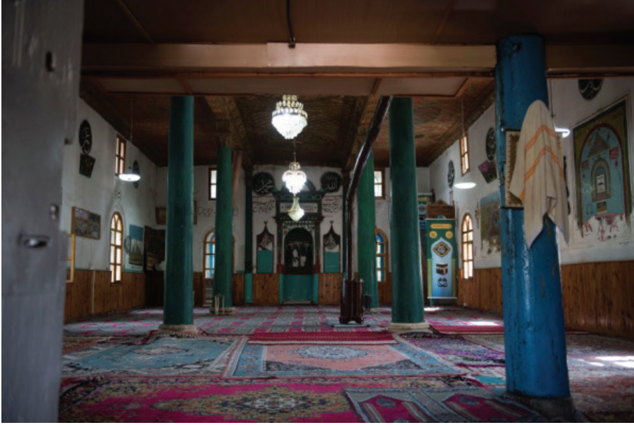
G. 3: Tokmak Hasan Paşa Camii harimden genel görünüm (Buğdaycı, 2019)