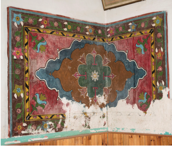
G. 15: Halı tasviri (Buğdaycı, 2019)

Sultan Ahmet Camii tasviri ile yan yana resmedilen halı desenli panonun bir bölümü caminin doğu duvarı bitimine, diğer bölümü de güney duvarının bir kısmını kaplayan yüzeye işlenmiştir. Doğu ve güney duvarına işlenen pano iki ayrı duvarda yer almasına rağmen kesintisiz devam etmektedir. Dikdörtgen panonun doğu duvarındaki ebatları 122x139 cm, güney duvarındaki ebatları ise 85x116 cm'dir. Her iki panonun da alt kısımlarında ve kenarlarında sıva müdahaleleri tespit edilmiştir. Ancak tasvirin geneli iyi durumdadır (G. 15).