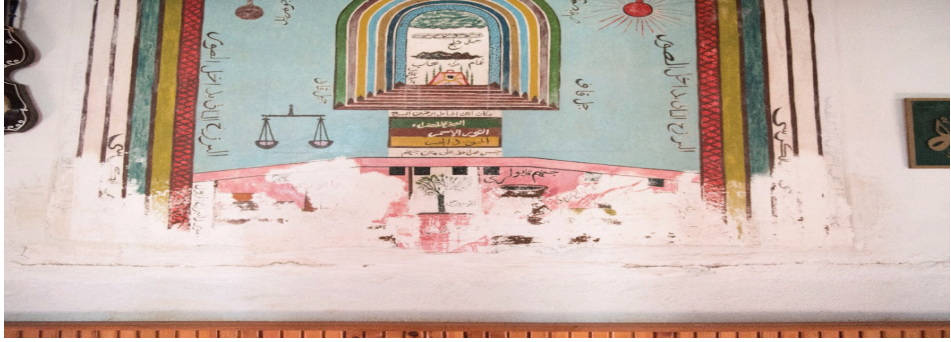
G. 9: Cehennem tasvirinden detay (Buğdaycı, 2019)