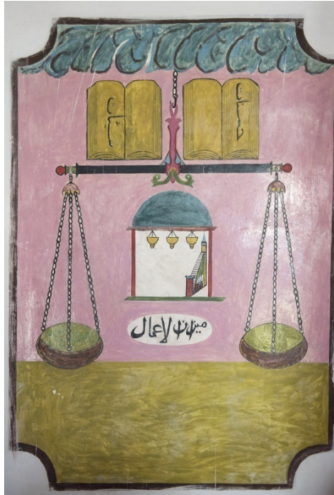
G. 5: Mizan tasviri (Buğdaycı, 2019)

Mizan tasviri, caminin doğu yönü duvarına ve “Livâü'l-Hamd” tasviri ile yan yana resmedilmiştir. 131x90 cm ebatlarındaki dikdörtgen panonun köşeleri iç bükey kıvrımlarla hareketlendirilmiştir. Konu itibarıyla kompozisyonu meydana getiren ana öğe terazidir. Burada terazi gökyüzüne bir zincirle asılıdır. İki kefeli terazinin üst kısmına ise iki adet defter yerleştirilmiştir. Bunlar sevap ve günahların yazıldığı defterlerdir. Sağdaki defter üzerinde “hasenât” (sevaplar, güzel işler), soldaki defterin üzerinde ise “seyyi’ât” (günahlar, kötü işler) yazmaktadır. Tüm bu alegorik tasvirler mizan tanımlamalarını desteklemektedir. Terazi kollarının arasına ise tek kubbeli bir cami içerisinde minber ile üç adet askılı cami kandili resmedilmiştir. Ahiret ve kıyamet gününü hatırlatan resimde terazinin alt boşluğuna elips şeklinde bir madalyon yerleştirilmiştir. Madalyonun içerisinde Arap harfleri ile “mizan’el a’mâl” (amel terazisi) yazılıdır (G. 5).