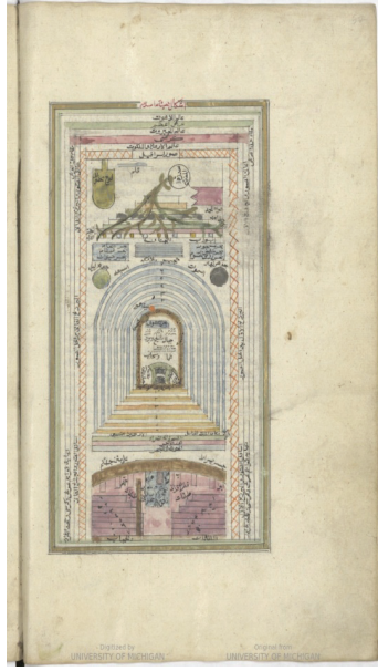
G. 16: Âlem-i Lâhût tasviri, Mârifetnâme.

( https://babel.hathitrust.org/cgi/pt?id=mdp.39015079129824;view=1up;seq=1 )