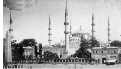
G. 12: Sultan Ahmet Camii ve Külliyesi. (www.degisti.com), erişim 2 Nisan 2019