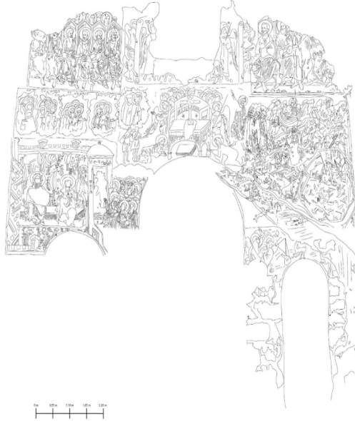
G. 4: Kaymaklı Manastırı, Son Mahkeme Sahnesi (Çizen: Gümüş, 2022)