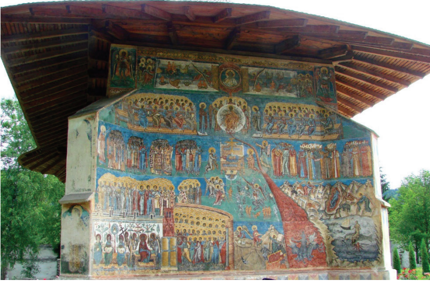
G. 8: Suceava, Voronet Manastırı, Son Mahkeme Sahnesi ( https://www.hartaturistului.com/bucovina/suceava/manastirea-voronet-judetul-suceava )

19. yüzyıla tarihlenen Vazelon Manastırı kathedronundaki “Son Mahkeme” kompozisyonunda figürlerin ten renkleri koyu tonlarda, parmakları ise uzun, ince tasvir edilmiş, kıyafetlerinde ise pastel tonlar tercih edilmiştir. İdealize edilmiş ve gösterişli tasvirler yerine gerçekçi bir üslupla doğallığın ön plana çıkması sağlanmıştır. Özellikle meleklerde ve bazı figürlerde vücut hatları belli olmaktadır. Günümüze gelebilen figürlerin mimik ve jestlerindeki hissiyat seyirciye yansımaktadır. Kaymaklı Manastırı kathedronundaki 1622 tarihli “Son Mahkeme” kompozisyonunda kırmızı, kahverengi, sarı, mavi ve özellikle pembe kullanımı öne çıkmaktadır. Figürler idealize edilmeden gerçekçi bir üslupta tasvir edilmiştir. Figürlerin vücut hatları belirgindir. Sümela Manastırı’nda 18. yüzyıla tarihlendirilen “Son Mahkeme” sahnesindeki figürlerde gerçekçi bir üslup idealize edilmeden tasvir edilmiştir. Ten renkleri koyu tonlarda ve ince/uzun tasvir edilen figürlerde kahverengi ve kahverenginin tonları tercih edilmiştir.