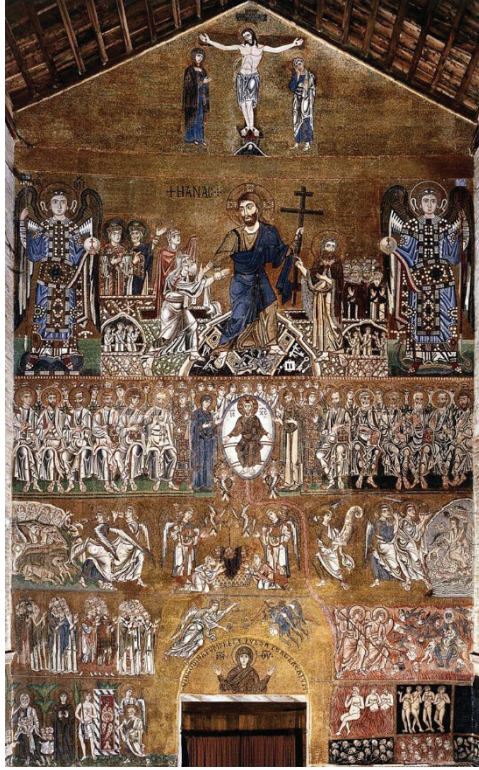
G. 7: Venedik, Santa Maria Assunta Kilisesi, Son Mahkeme Sahnesi

( https://educated-traveller.com/2016/11/02/venice-the-lagoon-of-venice-italy/torcello-last-judgment/ )