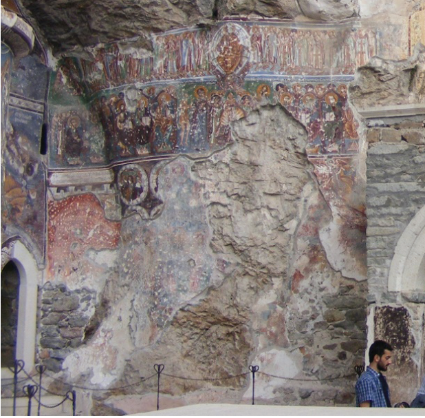
G. 5: Sümela Manastırı, Son Mahkeme Sahnesi (Soykan, 2021)

yazıt olduđu anlaşılabilmiştir. Cennet'in solunda rahipler ve martirler bulunmaktadır. Cehennem sahnesinde boru üfleyen melek, Musa (?) ve ateş nehrindeki figürler günümüze gelebilmiştir.