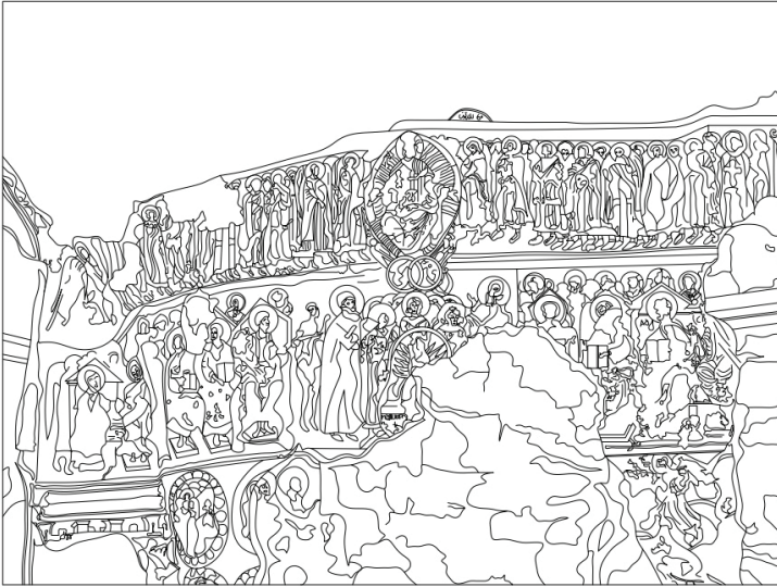
G. 6: Sümela Manastırı, Son Mahkeme Sahnesi (Çizen: Çavuşođlu, 2023)