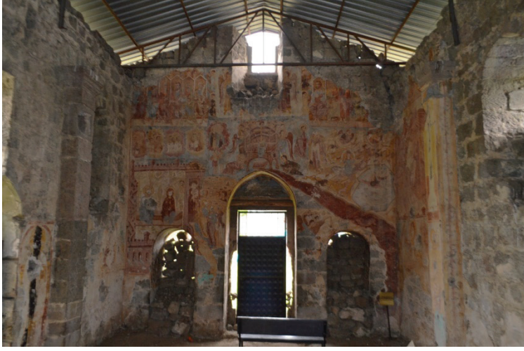
G. 3: Kaymaklı Manastırı, Son Mahkeme Sahnesi (Soykan, 2022)