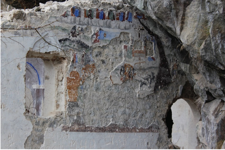
G. 1: Vazelon Manastırı Katholikonu, Son Mahkeme Sahnesi (Soykan, 2021)

“Son Mahkeme” sahnesinin en sağında iki topluluk yer almaktadır. Üzerindeki yazıtta “ Ο χορός Τών αγίων- O chorós Tón agíon ” (azizler korusu) yazıtının okunduğu üstteki topluluk tahrip olsa da, “ Ο χορός Τών προφητών- O chorós Tón pro fi ton ” (Peygamberler korusu) yazıtının okunduğu alttaki topluluk görece daha iyi durumdadır.