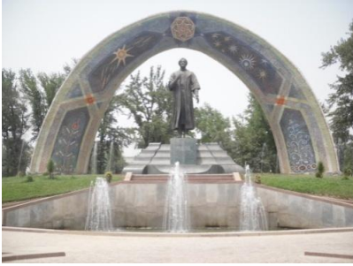
Rudeki Parkı ve Heykeli, Duşanbe Haziran/Temmuz 2011

Tacikistan'daki Rus nüfusun en yoğun olduğu, Sovyet döneminin Stalinobod 'u bugünün Duşanbesi, Rus Sovyet mimarisinin simgesi olan geniş ve ferah bulvarları, az katlı binaları ve nispeten yeşil dokusuyla gelişmiş bir ülke görünümü arz ediyor. Ancak ilk plandaki bu nispeten etkileyici görünümün arka planında yoksulluğun izleri de kendisini gösteriyor.