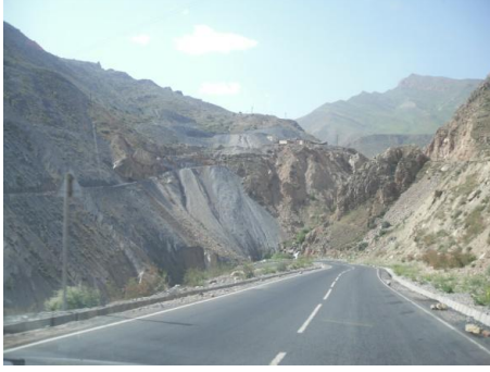
Haziran/Temmuz 2011, Tacikistan, Sugd Yolu

bir parçası olan Fann dağlarına değin uzanır. Doğu ve kuzeydoğudaki dağlar, kuzeybatıda ve kısmen güneybatıda, yerlerini Hisor , Vahş vd. düzlüklere bırakır.