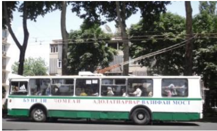
Slogan ve Trolleybüs, Duşanbe Haziran/Temmuz 2011

Rudeki'nin adının şehrin en büyük bulvarlarından birine de verildiği görülüyor. Somoni heykeli ve Rudeki Parkı, Duşanbe'nin yerli yabancı resmî ve gayiresmî ziyaretçilerinin ziyaretgâhları hâline gelmiştir. Şehrin semtleri de adını, İran-İslam (Tacik-İslam) bilim ve edebiyat tarihinin önemli simalarından Ebu Ali İbni Sino , İsmaili Somoni , Firdevsi , Şohmansur 'dan alıyor.