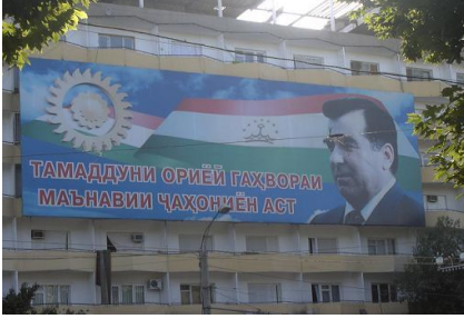
Haziran/ Temmuz 2011 Tacikistan, Duşanbe

alanında Zerdüş İnan'a atfı yapan, bir noktada İslami dönemi nötrale eden ulus inşası projesine benzer biçimde, bağımsız Tacik ulusunun ve devletin