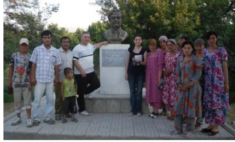
Haziran/Temmuz 2011, Tacikistan, Sarazm

Özbekler: Tacikistan'da sayısı ve oranı kesin olarak bilinmemekle birlikte, genel nüfusun en az % 15'ini Özbeklerin teşkil ettiği tahmin edilmektedir. Resmî kaynaklardaki rakamlar % 15'lerden % 25'lere kadar değişmektedir. Yerli Özbek çevrelere göre, bu oran % 20'nin üzerindedir.