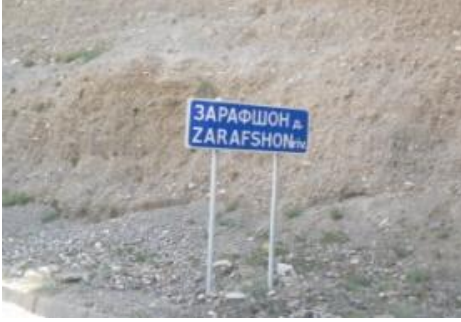
Haziran/Temmuz 2011, Tacikistan Zarafşon Vadisi Levhası

Adını aynı adlı nehirден alan, uygarlıklara beşiklik eden, Kırgızistan ve Tacikistan'ın Sugd bölgesinden Özbekistan'a doğru uzanan yaklaşık on milyon nüfuslu tarıma elverişli Zarafşon Vadisi , nüfus bakımından Orta Asya'nın en yoğun coğrafyalarından biridir. 12