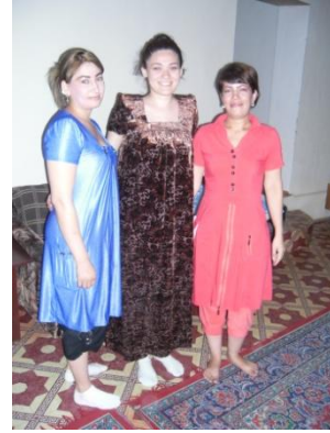
Tacik Konukseverliği Pancakent Haziran/Temmuz 2011

Soğdlardan Taciklere: Bugünkü Özbekistan'ın doğusuyla Tacikistan toprakları Doğu Türkistan'ın batısı, Antik Soğd (İng. Sogdiana) halkının ve mirasçılarının en az iki bin yıldır ana yurdudur, yani Tacik ana yurdu Pamir Dağları'ndan Amu Derya'ya değin uzanan geniş bir alandır. Türk tarihinde Soğd , Soğdak olarak tanınan coğrafya ve bu coğrafyanın tüccar ve diplomat sakinleri Soğdlar, doğudan batıya, batıdan doğuya din, ticaret ve diplomasi aracılığıyla yüzyıllar boyunca çok farklı kültürleri harmanlamışlardı. Pers İmparatorluğu ile Birinci Türk Kağanlığı'nın, MS 565'te Heftalit İmparatorluğu'nu müşterek bir operasyonla ortadan kaldırmalarının ardından yapılan paylaşımında Soğd, Türk tarafının savaş ganimetiydi. Literatürde Türk-İran ortak kültürel yaşamı olarak bilinen sürecin başlangıcı, bu paylaşımdır. Batıya süren göç dalgalarının en önemlilerinden biri,