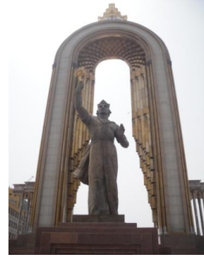
Somoni Heykeli, Duşanbe Haziran/Temmuz 2011

Adını, bir zamanlar salı günleri (Türkçe söyleyişle Düşenbe dü 'iki' + şenbe 'gün') kurulan pazardan alan Duşanbe, Hisor Vadisi'ne konuşlu, Varzob ve Kofarnigon nehirlerinin kıyısında denizden yüksekliği 850 m, dağlarla çevrili yaklaşık bir milyon nüfuslu bir kenttir.