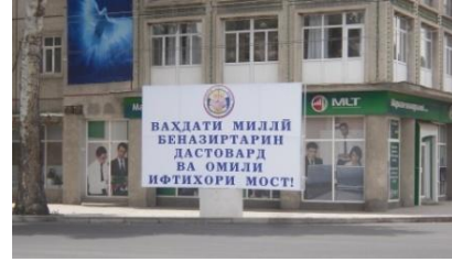
Haziran/ Temmuz 2011, Tacikistan Ulusal Birlik Temalı Yazı Tahtaları

Yaklaşık on iki yüzyıl süren dinî ve hanedan temelli yönetimlerin ardından büyük bir devrimle kurulan SSCB, üç çeyrek yüzyıl yaşayamadı. SSCB, yerini millî devletlere bırakarak tarih sahnesinden çekilirken Asya'nın Fars dilli bu halkı tarih sahnesine bağımsız bir siyasi güç olarak çıktı.