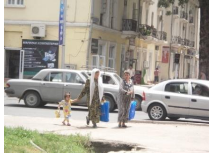
Haziran/ Temmuz 2011, Tacikistan, Duşanbe

1979 Sovyet sayım sonuçlarına göre 3,801,357 nüfusu bulunan Tacikistan’da Taciklerin toplam nüfusu 2,237,048 idi. Taciklerin % 22,8’i Tacikistan dışında