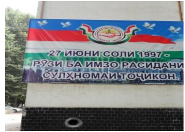
Haziran/ Temmuz 2011, Tacikistan 27 Haziran 1997, İç Savaşın Bitiş Günü

Ulusal bir devlet yaratma sürecini başlatan Devlet Başkanı Emomali Rahmon yaklaşık bin yıl sonra gelen bağımsızlığı 'en kutsal ve en değerli armağan, özgür bir devletin temel niteliği, onurun simgesi, yurtseverlik, müreffeh bir yaşamın garantörü, gurur ve günlük yaşamlarımızın sonsuz enerjisi' sözleriyle nitelemektedir.