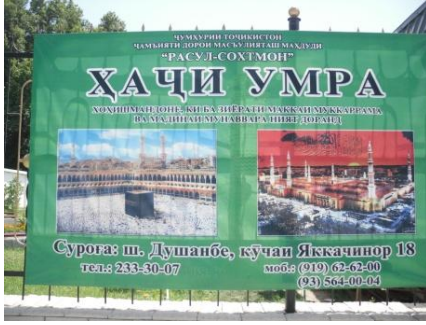
Umre Hacці İlanı: Haziran/ Temmuz 2011, Duşanbe

Zaman zaman dünya basın yayın organlarında ülkede dindarlara karşı yoğun bir baskı olduğu hatta sakallıların yabancı bile olsa sokaklarda polis tarafından alındığı haberlerine, ibadet yerlerinde dahi 4-5 kişinin yan yana gelmesinin tehlikeli olabileceğine ilişkin söylemlere karşı, durumun ülke dışından yüzeysel biçimde görüldüğü, gazetelerde yazıldığı ölçüde vahim olmadığı ifade