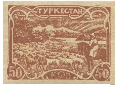
Rus/Sovyet Pulu: Turkestan 50 kop

Hanlıklardan Sovyetlere: On dokuzuncu yüzyılın ikinci yarısında Türkistan'ın, Çarlık Rusyası tarafından ele geçirilmesinden sonra, Batıda yükselen ulusçuluk dalgası Rusya Türklerini de etkilemiş, Türkçülük, Türkistanlı aydınların gündemine girmiştir. İran ve Rusya arasında kalan ve baskın etnik vurgusu bulunmayan Buhara Emirliği, Hive ve Hokand hanlıkları 1917 Ekim Devrimi'yle Sovyetleştirilmiş, özellikle Stalin döneminde etnik potansiyellerin etnik bilinç, etnik sınırların siyasal sınırlar hâline getirildiği 'divide et impera' ilkesi hayata geçirilmiştir. Yüzyıllardır İslam çatısı altında geleneksel biçimde yaşamlarını sürdüren halklar etnik kimlikleri ön plana çıkarılmak veya yeni etnik kimlikler