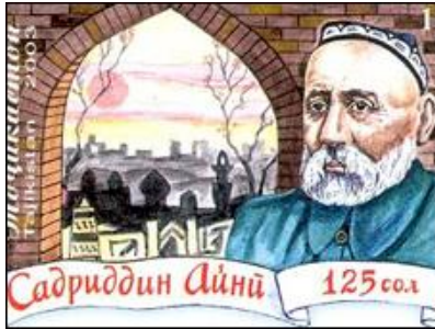
Sadriiddin Ayni: Modern Tacik edebiyatının kurucularından

Samanileri Yıkan Karahanlıların Yarattığı Travma: Türk tarihinde Karahanlılarla kıyaslanabilecek, Arap olmayan ilk büyük Müslüman devlet, klasik Fars dili ve edebiyatının ‘ikliminde neşet ettiği’ Samani Devleti’ne (Tac. Davlati Somoniyon ) özel bir önem verildiği, bu devletin ve Tacik tarihinin altın döneminin maddi ve manevi mirasının modern Tacik ulusçuluğunu besleyen ana unsurlardan biri olarak kullanıldığı dikkati çekiyor. Perslerin veya Türklerin vesayetindeki tarihî Soğd krallıklarının yerine Samanilerin idolleştirilmesinin daha pragmatik olduğu yukarıda belirtilmişti.