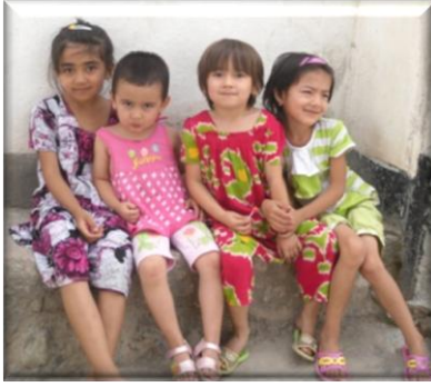
Haziran/Temmuz 2011, Tacikistan Duşanbe

Bu tabloya göre, Tacik nüfusu 1959-1989 arasında % 301,7 artmış, yine aynı dönemde SSCB genelindeki nüfus oranı da iki kattan fazla artarak % 0,7'den % 1,5'e yükselmiştir. 1979-1989 arasında SSCB'deki nüfus artış oranları Ruslarda % 5,6; Ukraynalılarda % 4,2 ile tek rakamlarda gerçekleşirken, Müslüman cumhuriyetler içinde on yıllık toplam nüfus artışı, Tacikistan'da % 45 ile zirveye çıkmıştır.