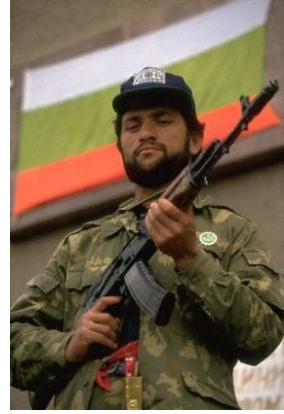
İç Savaş: 1992-1997

Siyasal ve ideolojik rekabete karşın, esas olarak doğu destekli kuzey-güney çatışması şeklinde ortaya çıkan iç savaşta, Pirus Zaferi'ni Kulob merkezli güneyin kazandığı ve bugün yönetimin büyük ölçüde güneylilerin elinde olduğu, Hucand merkezli kuzey, yani Sugd 40 egemenliğinin iç savaşın ardından sona erdiği ifade edilmektedir. İç savaşın sona ermesinin, bölgeciliğin ortadan kalkmasını sağladığını söylemek zor görünüyor. Aksine, iktidar değişikliği beraberinde kaynakların kullanımında da el değişikliğini gündeme getirmiştir. Bir zamanların siyasal ve toplumsal merkezi Hucand 'ın sakinleri önceki dönemlere oranla yoksullaşmıştır. İç savaşın yarattığı yıkım ve tahribatın bu denli büyük olmasında, kişisel ihtilafların ve aşiret çatışmalarının da bu ortamdan yararlanılarak hâlledilmeye çalışmasının da rolü olmuştur.