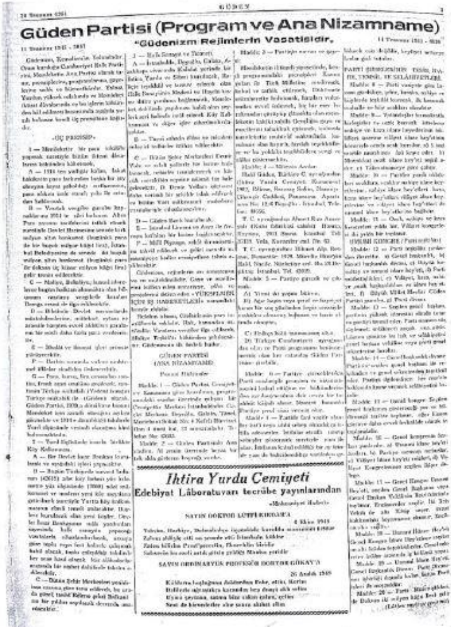
EK-1: Güden Partisi Program ve Ana Nizamnamesi (Güden gazetesi)