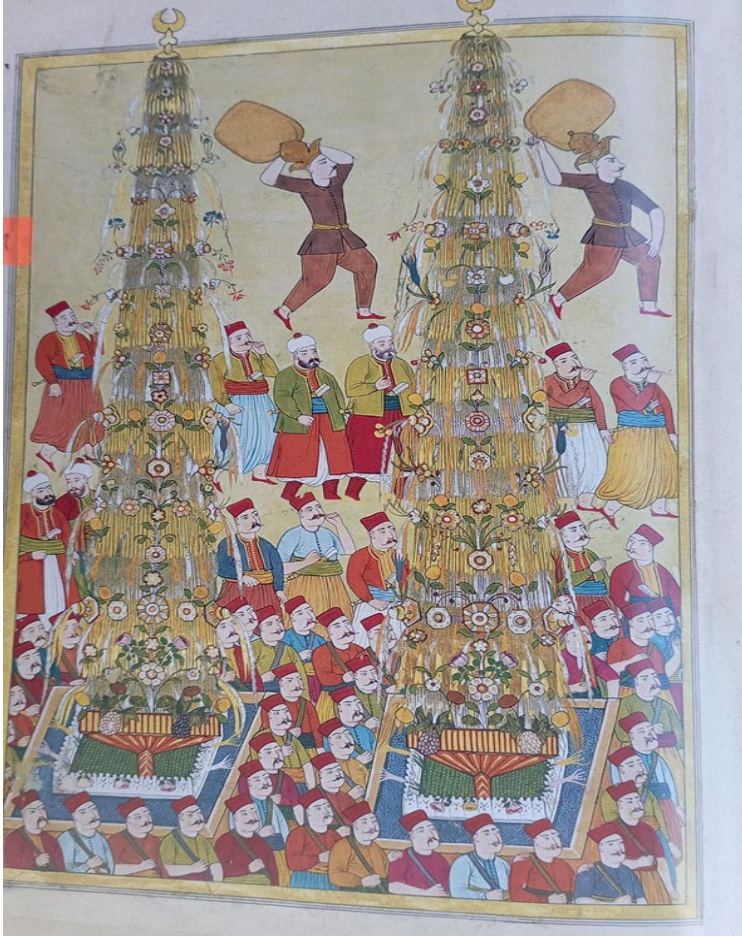
Minyatür 5 (Vehbî, 2008, s. 422)

yanında Anadolu'nun çeşitli yerlerinde de nahıl düğün ve sünnetlerde kullanılmaktadır. Nevşehir ve Ürgüp yöresinde düğünlerde nahıl, Edirne ve Kırklareli'de ahret çiçeği, Kars-Ardahan yöresinde şah bezeme veya şah kaldırma yapıldığı görülmektedir (Üçer, 2019, s. 88-94).