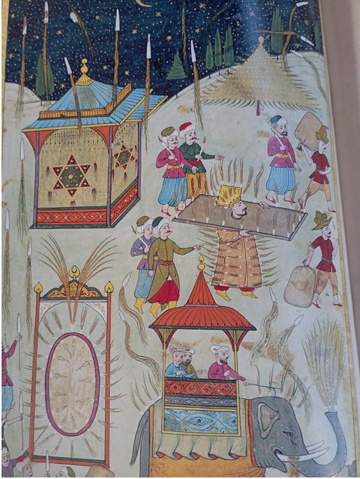
Minyatür 7 (Vehbî, 2008, s. 270)

Türklerin inancına göre, altı kollu yıldız motifindeki alt ve üstte olan üçgenin göğü ve yeri, iyiyi ve kötüyü, kadını ve erkeği, ateşi ve suyu temsil ettiğine inanılmaktadır. Türk kültür ve sanatında altı kollu yıldızın İslamiyet öncesi dönemde de kullanıldığı görülmektedir. İslamiyet'in kabulü sonrasında Türkler, altı kollu yıldızda farklı anlamlar da yüklemişlerdir. İslamiyet'in kabulünden sonra altı kollu yıldızda, Mühr-i ya da Mühr-ü Süleyman adıyla yani Hz. Süleyman'ın mührü adı verilmektedir. Altı kollu yıldız, kuvvet ve kudret simgesi olarak kaftan, sancak ve bayrakta, muska, nazarlık ve tılsımlı gömlelerde kullanılmaktadır. Düşman kuvvetlerinden korunmak için askerî objelerde, bolluk ve bereket için tespihlerde, şifa taşlarında, ölümlerin kabir azabından korunmaları