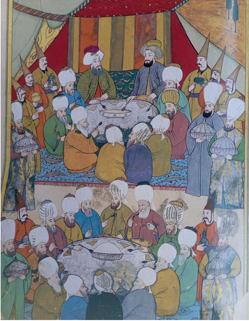
Minyatür 1 (Vehbî, 2008, s. 133)

Sünnet düğünlerinde sünnet olan çocukların aileleri genellikle gelen misafirlere yemek ikram etmektedir. Sünnet esnasında ve sonrasında lokum, şeker, helva vb. acılarını daha aza indirecek tatlı yiyecekleri yedikleri metinde şöyle aktarılmaktadır: