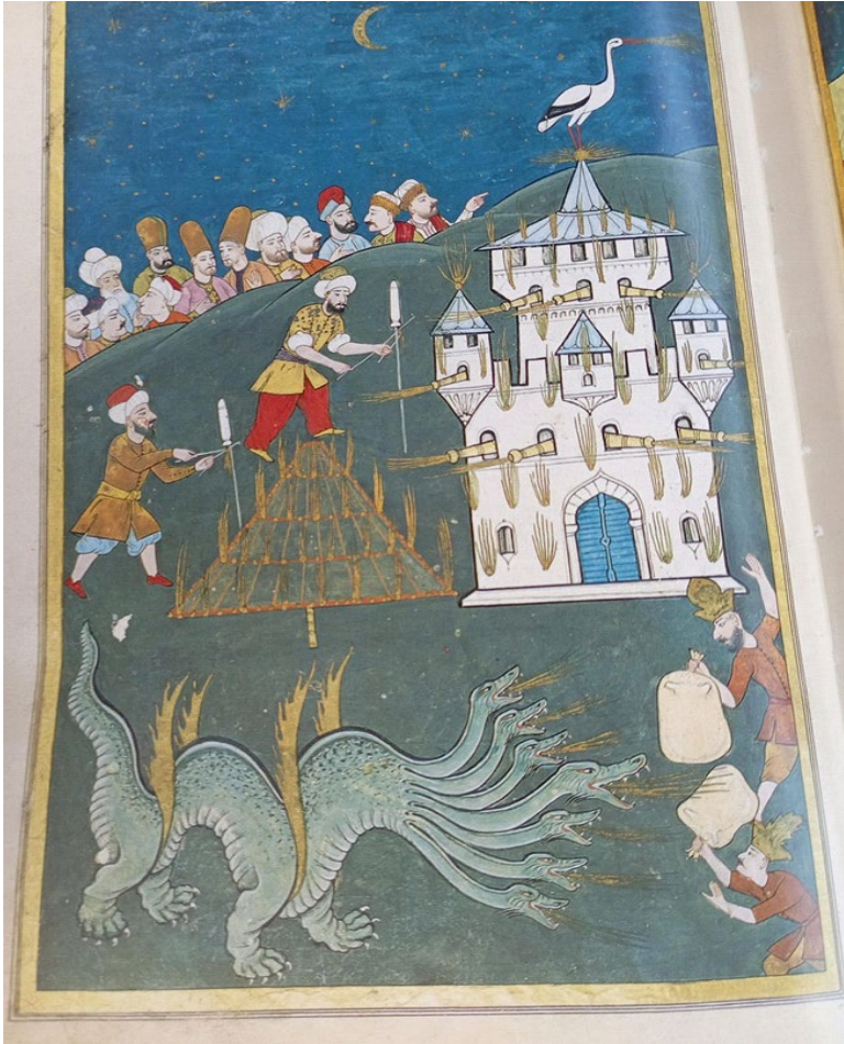
Minyatür 6 (Vehbî, 2008, s. 136)