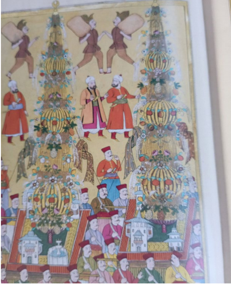
Minyatür 4 (Vehbî, 2008, s. 420)

İtırı sürdürdü ki bir gül dalına baksa, bir de bu pürüzsüz fidanı seyretse; gülün her yaprağı bahçıvanın gözüne batan bir diken olur diye mırıldanarak, söz söyleme bülbüllerini çın çın öttürdüler. Gelin süsleyici kadınların ve Mâni'nin yaptıklarına benzer süsleme ve nakışlar yapan nakkaşların, gelin sandalyesinde oturan düğün nahılları gelinine verdikleri süs şehzadelerin ince ve ölçülü bakışlarına hoş göründüğünden iki kez yaya olarak gelip gittiler.” (Vehbî, 2008, s. 34).