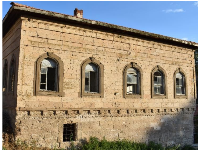
Görsel 6. Başköy İbtidai Mektebi Kuzey Cephe

Kuzey cephe, cephe ortasında yer alan bordürlerle iki bölüme ayrılmıştır. Cephenin alt bölümü genel olarak sade tasarlanmıştır da bu bölümün doğusunda dikdörtgen formlu bir pencere bulunmaktadır. Dikdörtgen formlu pencere dıştan kaval silme ile çerçevenmiştir. Çerçeve üstte yarım daire şeklinde olup ortasında gülbezek motifi vardır. Cephe ortasındaki bordürler yukarıda oluk ve kaval silmeler, aşağıda iki sıra düz bir sıra ters yarım dairelerin oluşturduğu geometrik kompozisyonlu bordür yer almaktadır. Ortadaki bordür ise yan yana sıralanmış yirmi bir konsol ile bu konsolların aralarına yerleştirilmiş yirmi rozetten oluşmaktadır (Görsel 6). Yivlerle hareketlendirilen konsolların alt kısmında kabartma gülbezeler mevcuttur.