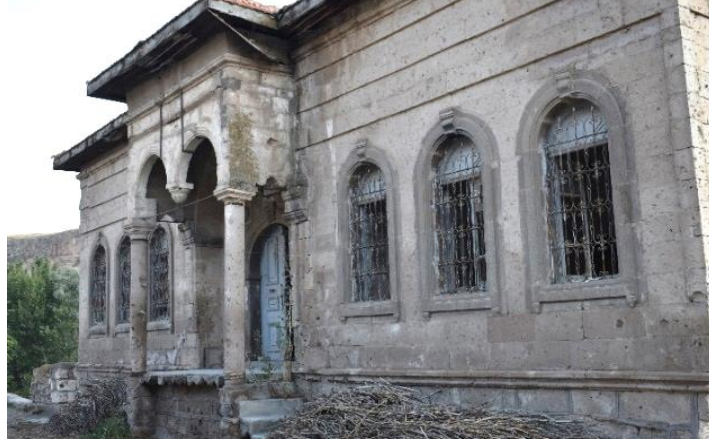
Görsel 2. Başköy İbtidai Mektebi Doğu Cephe

yanındaki beş basamaklı merdiven ile ulaşılmaktadır. İkiz kemerli revakın kemerleri doğuda iki sütuna batıda konsollara oturtulmuştur. İkiz kemerlerin yüzeyi oluk ve kaval silmelerle hareketlendirilerek ortalarına ise sarkıt yerleştirilmiştir. Kemerler ve çatı arasında oluk ve kaval silmelerden oluşan bordür mevcuttur. Kemerin oturduğu sütun başlıkları ve konsolların yüzeyi silmelerle bezelidir. Konsol ve sütun başlıklarının arasında kemer yerine "s" kıvrımlı düzenlemeler bulunmaktadır. Revak zeminin doğu tarafı saçak gibi düzenlenerek uç kısmı "s" kıvrımlarla hareketlendirilmiştir (Görsel 3).