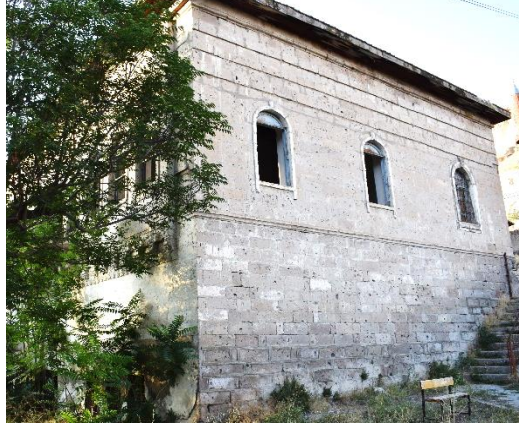
Görsel 12. Başköy İbtidai Mektebi Güney Cephe

Tüm cephe yüzeylerinde saçak seviyesinde kaval silme yer almaktadır. Kiremitlerle kaplı kırma çatının kuzeyinde ve güneyinde tuğla malzemeli birer baca bulunmaktadır. Günümüzde bacaların bir bölümü yıkık durumdadır.