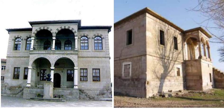
Görsel 16-17. Ağırnas İttihat ve Terakki Mektebi, Kamber İlkokulu, Genel Görünümleri (Özbek & Arslan, 2008, s. 372, 1234).

Yapının cephelerinin kat silmeleri ile ayrılması, pencerelerin dışa taşkın ve farklı malzemeli oluşu ile Kayseri'de aynı dönemde inşa edilen Kamber İlkokulu (1903), Ağırnas İttihat ve Terakki Mektebi (1909-1911) ve Germir İbtidai Mektebi (1911) ile benzerlik taşımaktadır (Görsel 16-17). Cephelerdeki pencere kilit taşlarının dışa doğru taşırılması 20. yüzyılda Kayseri ve Anadolu'nun farklı şehirlerinde inşa edilen kamu yapıları ile sivil mimaride sık karşılaşılan bir uygulamadır.