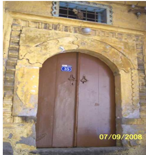
Görsel 15. Germir İlçesi, Ev Giriş Kapısı (Tali, Ş. 2010, s. 182)

Başköy İbtidai Mektebi’nde bölgede sivil ve kamu yapılarında yaygın olarak tercih edilen düzgün kesme taş malzeme kullanılmıştır. Mektebin taş süslemeleri genel olarak neo-klasik dönem yapılarına uygun cephelerde yoğunlaşmaktadır. 18. yüzyıl sonlarından itibaren Osmanlı mimarisinde etkilerinin görüldüğü neo-klasik üslup, özellikle büyük ve küçük resmi devlet yapılarında tercih edilmiştir. Başkent İstanbul başta olmak üzere Anadolu’nun farklı kentlerinde neo-klasik üslupta yapılmış mütevazı okul ve kamu yapılarına rastlanılmaktadır (Eyice, 1981, s. 175). Bu bağlamda mektep inşa edildiği dönemin (20. yüzyıl) üslubunu yansıtmaktadır.