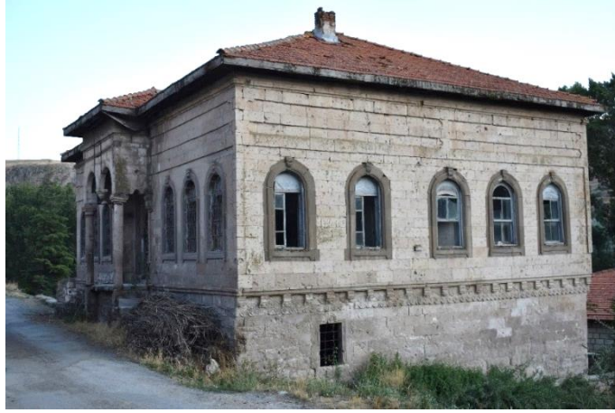
Görsel 1. Başköy İbtidai Mektebi Genel Görünümü

Kuzey-güney doğrultusunda kareye yakın dikdörtgen alana sahip mektep iki katlıdır (Görsel 1). Yapının zemin katına batı cephesinde yer alan kapı ile giriş sağlanmaktadır. Kapıdan doğu-batı doğrultusunda dikdörtgen planlı koridora geçilmektedir. Koridorun kuzeyinde, güneyinde ve kuzeydoğusunda dikdörtgen planlı beşik tonoz örtülü mekânlar vardır. Kuzey ve güneydeki mekânların batı duvarlarında üç pencere doğu duvarlarında ise dikdörtgen formlu ikişer niş bulunmaktadır. Kuzeydoğudaki mekânın kuzey duvarı üzerinde üç, güney duvarı yüzeyinde ise bir niş vardır. Mektebin birinci katına doğu cephedeki yuvarlak kemerli kapıdan girilmektedir. Kapının önünde tek gözlü revak yer almaktadır (Plan 1).