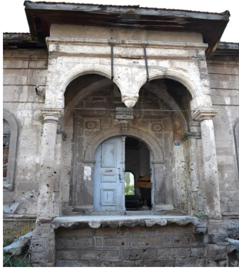
Görsel 3. Başköy İbtidai Mektebi Revak

Revakın gerisindeki giriş kapısı taçkapı şeklinde tasarlanmıştır. Eyvan şeklinde sivri bir kemer içerisine yerleştirilen yuvarlak kemerli kapı üç yönden bordürler ile çerçevesiyle çevrilmiştir (Görsel 4). Bu çerçeve dıştan içe doğru tekli yaprak motiflerinin dizilmesiyle oluşturulan bitkisel kompozisyonlu bordür, oluk ve kaval silme ile dandan şeklinde tasarlanan geometrik bordürden oluşmaktadır. Konsollara oturan kapı kemerinin yüzeyi dıştan içe doğru oluk silme, dört kollu yıldızların yan yana dizilmesiyle oluşturulan geometrik kompozisyonlu bordür, kaval ve oluk silmelerle bezelenmiştir (Görsel 5). Kemerin kilit taşı üzerinde konsol yer almaktadır. Konsolun yüzeyi yivlendirilmiştir. Kemer köşeliklerinde kabartma tekniğiyle yapılmış birer adet gülbezek motifi vardır. Kemerin üzerinde kare formlu kitabelik bulunmaktadır. Bu bölüme Milli Eğitim Bakanlığı tarafından mermer malzemeli bir kitabe eklenmiştir. Kapının üzerinde yuvarlak formlu bir pencere bulunmaktadır.