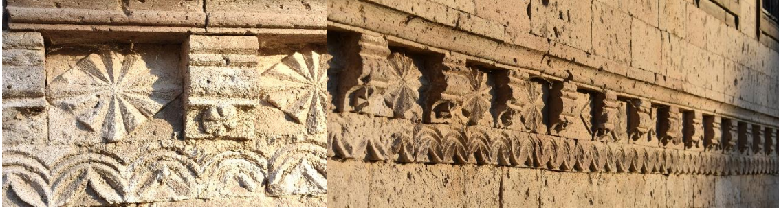
Görsel 7-8. Kuzey Cephe Bordür Süsleme Detayları

Konsolların arasındaki bezemeler doğudan batıya doğru şu şekildedir; ilk üçü eşkenar dörtgen şeklinde tasarlanan ışın motifi, dört ve beşinci dört yapraklı bitkisel motif, altı, yedi ve sekizinci eşkenar dörtgen formlu ışın motifi, dokuzuncu yuvarlak formlu ışın motifi, onuncu stilize kelebek motifi, on birinci çarkıfelek, on ikinci çiçek, on üçüncü dairesel formlu ışın motifi, on dördüncü dört kollu çarkıfelek, on beşinci beş kollu yıldız, on altıncı gülbezek, on yedinci dört kollu çarkıfelek, on sekizinci dairesel formlu ışın motifi, on dokuzuncu stilize kelebek, yirincisi ise gülbezek motifidir (Görsel 7-8). Cephenin üst kısmında yuvarlak kemerli beş adet pencere vardır. Yuvarlak kemerli pencerelerin kilit taşlarında konsol bulunmaktadır. Pencerelerin üzerinde ise doğu cephede olduğu gibi üç sıra taş dışa taşkın vaziyettedir. Taşların arası bordür şeklinde köşelerden "c" kıvrımları ile kapatılmıştır.