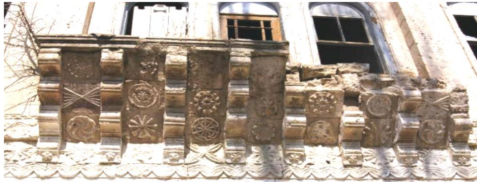
Görsel 11. Başköy İbtidai Mektebi Balkon Süslemeleri (Özbek, Y. 2008, 1315)

Balkon konsolların arası cephe yüzeyinde olduğu gibi kabartma rozetlerle bezelidir. Her konsol arasında yukarıdan aşağıya doğru sıralanmış üçer adet rozet bulunmaktadır. Balkonun ortasındaki konsol aralarının yüzeyinin tahrip olması ve güney konsolların üst bölümünün yıkıldığı için günümüzde bu bölümlerde ikişer rozet vardır (Görsel 11). Güneyden kuzeye doğru ilk konsolun arasında stilize kelebek motifli çarkifelek, ikinci arada gülbezek ile dairesel formlu ışın motifli yer almaktadır. Üçüncü konsol arasında gülbezek ile on kollu yıldız motifli, dördüncüsünde iki adet gülbezek motifli, beşincisinde gülbezek ve on kollu yıldız, altıncı konsol arasında iki daire ile çerçevelenmiş gülbezek ile ışın motifli yedincisinde ise daire içerisine alınmış yıldız, stilize kelebek ve çarkifelek motifli bulunmaktadır.