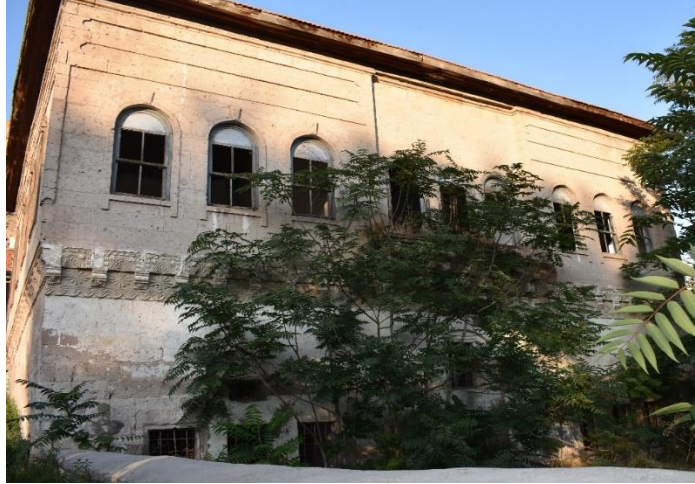
Görsel 9. Başköy İbtidai Mektebi Batı Cephe

Kuzey cephe ile benzer özellikler taşıyan batı cephe, cephe ortasındaki süsleme düzenlemeleri ile ikiye ayrılmış ortasında balkon vardır (Görsel 9). Ancak günümüzde cephenin büyük bir bölümünü ağaçlar kapattığı için balkon net olarak görülememektedir. Cephenin alt bölümünün ortasında giriş kapısı ile bir pencere bulunmaktadır. Kapı ve pencere dıştan yuvarlak bir kemer ile çerçevelenmiştir. Kapının kuzeyinde ve güneyinde üçer adet dikdörtgen formlu pencere vardır. Kuzey pencerelerin üzerinde küçük kare pencere yer almaktadır.