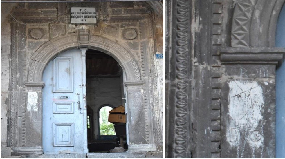
Görsel 4-5. Giriş Kapısı ve Kapı Bordür Detayı

Giriş revakının kuzey ve güneyinde cephe revak zemin seviyesinde kaval ve oluk silmeler ile ikiye ayrılmıştır. Cephenin alt bölümü sade bırakılırken üst bölümde kuzeyde ve güneyde üçer adet olmak üzere altı pencere vardır. Yuvarlak kemerli pencereler silmelerle çerçevenmiştir. Kilit taşları üzerine konsollar yerleştirilmiştir. Ayrıca pencerelerde bazalt taş kullanılması kalker taş malzemeli cephede pencereleri ön plana çıkarmıştır. Pencerelerin üzerinde üç sıra taş dizisi dışa taşınarak hareketlilik sağlanmıştır. Cephenin kuzeyinde dışa taşınan taşların arası köşede "c" kıvrımları ile birleştirilmiştir. Saçağın altında kaval silme yer almaktadır.