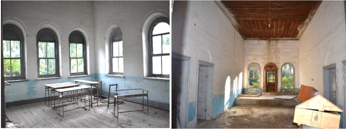
Görsel 13-14. Başköy İbtidai Mektebi İç Mekân Görünümleri

Mektebin iç mekânı cephelere göre oldukça sadedir. Duvar yüzeyleri zeminden bir metre kadar yükseklikte maviye boyanmıştır. Koridorun batısında yarım metre yükseklikte sahne yer almaktadır. Koridordan sınıflara açılan kapıların üzerinde yuvarlak kemerler bulunmaktadır. Tek kanatlı ahşap kapı kanatları üç panoya ayrılmıştır. Bezemesiz olan panolardan ortadakiler kare, alt ve üsttekiler ise dikdörtgen formudur. Sınıfları aydınlatan yuvarlak kemerli pencerelerin üzerine yine yuvarlak kemerler mevcuttur. Girinti şeklinde yüzeye açılan bu kemerlerin ortasına cephelerdeki pencere kilit taşlarına benzer düzenlemeler vardır (Görsel 13-14). Pencerelerin ahşap çerçeveleri silmelerle hareketlendirilmiştir. Sınıfların tavanında ve zemininde, koridorun ise sadece tavanında ahşap kullanılmıştır. Ahşap zemin ve tavanlarda yer yer çökmeler oluşmuştur.