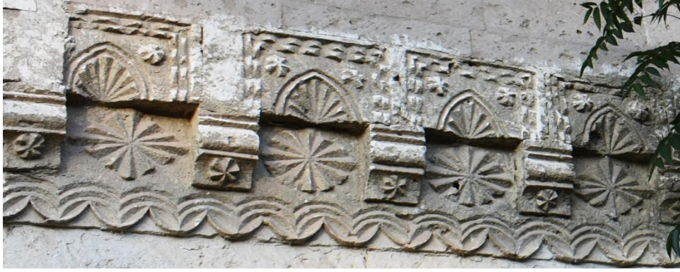
Görsel 10. Başköy İbtidai Mektebi Batı Cephe Süsleme Detayı

bulunmaktadır (Görsel 10). İlk bordürün ortasında sekiz konsola oturan balkon yer almaktadır. Balkonun güneye doğru bir bölümü tahrip olmuştur.