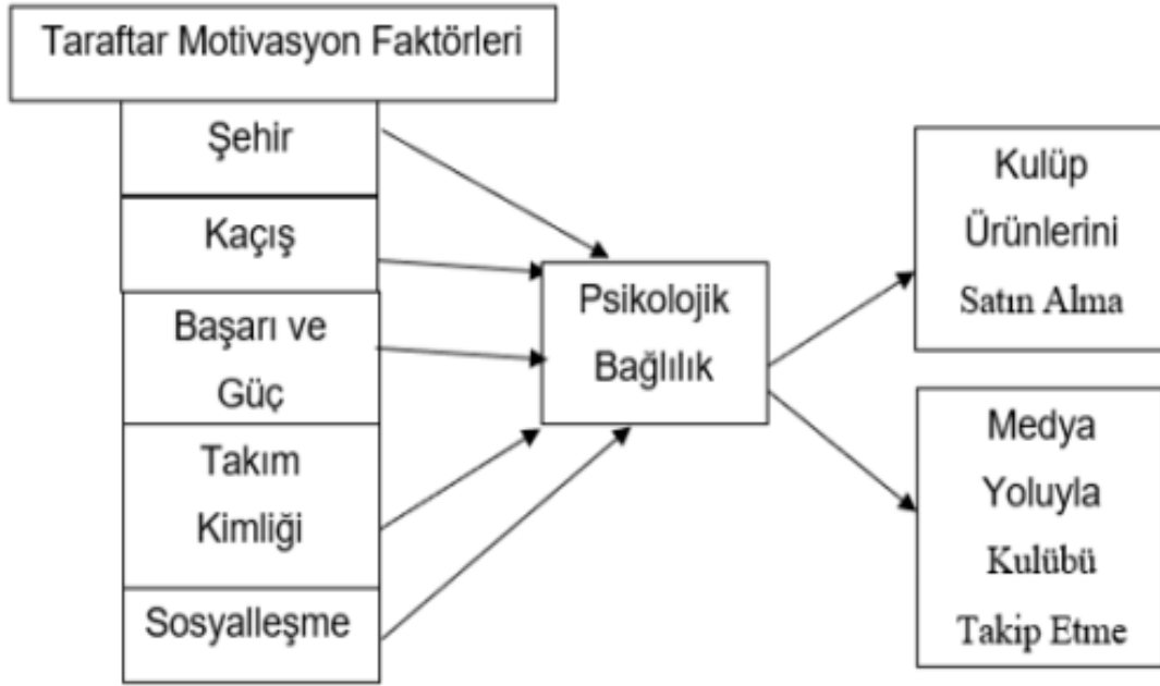
Şekil 1. Taraftarların deneyimlerinde etkili motivasyon faktörleri