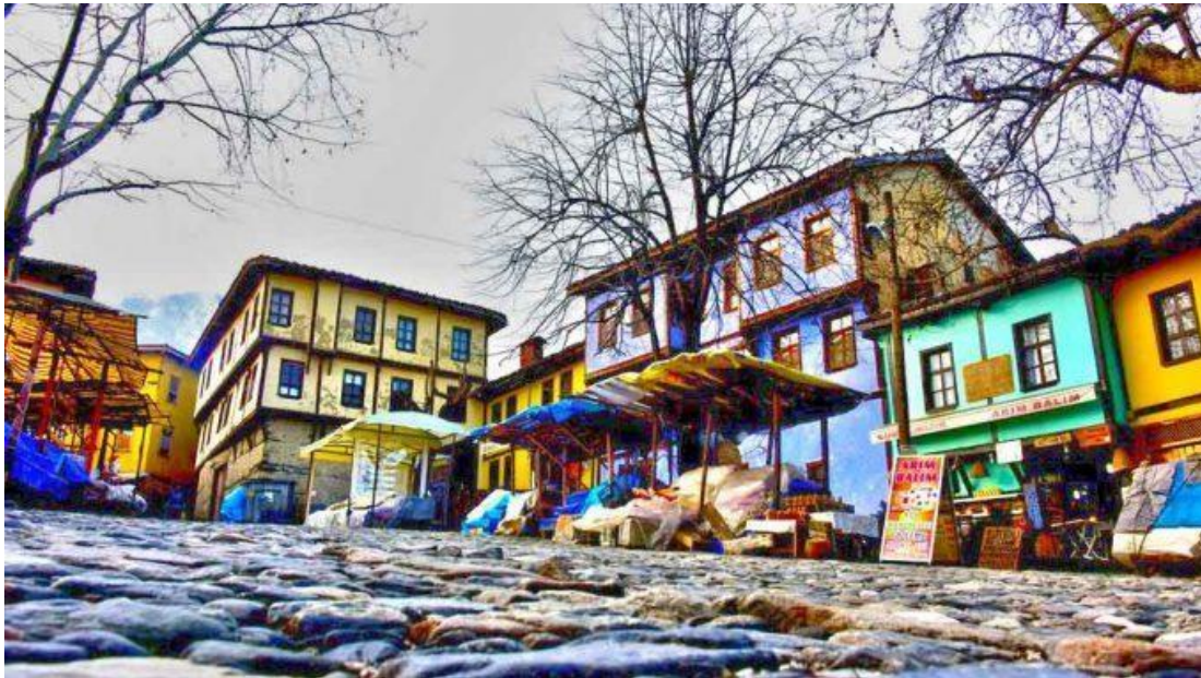
Şekil 2. Bursa, Cumalıkızık. http://www.yildirim.bel.tr , Erişim Tarihi: 2017

Bursa ve Cumalıkızık-Osmanlı İmparatorluğu'nun Doğu yönetim planının hedeflerinde tarihi çevreyi bütüncül olarak sürdürülebilir bir yaklaşımla korumak ve yaşatmak yaklaşımı vardır. Bu hedefe ulaşmak için belirlenen eylemler , alanlarla ilgili Koruma Amaçlı İmar Planlarının, Yönetim Planı kararları ile uyumunun sağlanması için revize edilmesi, Tarihi çevrenin kentsel peyzajının yeni yapılaşmalar ile tahrip edilmemesi için kent içi maksimum yapı yüksekliği analizinin yapılmasının sağlanması,, özellikle külliye yeşil alanları başta olmak üzere tüm miras alanlarının halk tarafından daha çok kullanılabilmesi için çevre düzenleme projeleri geliştirilmesi, Yönetim Alanında yıkılmış tescilli bina parsellerinde koruma amaçlı projeler üretilmesi, ilgili kurum ve kuruluşların eşgüdümü ile katılımlı ve sürdürülebilir bir finans modelini oluşturulması, Koruma Kurulu arşivinin dijitalleştirilmesi ve tescil fişlerinin güncellenmesidir (Bursa ve Cumalıkızık-Osmanlı İmparatorluğu'nun Doğu Yönetim Planı).