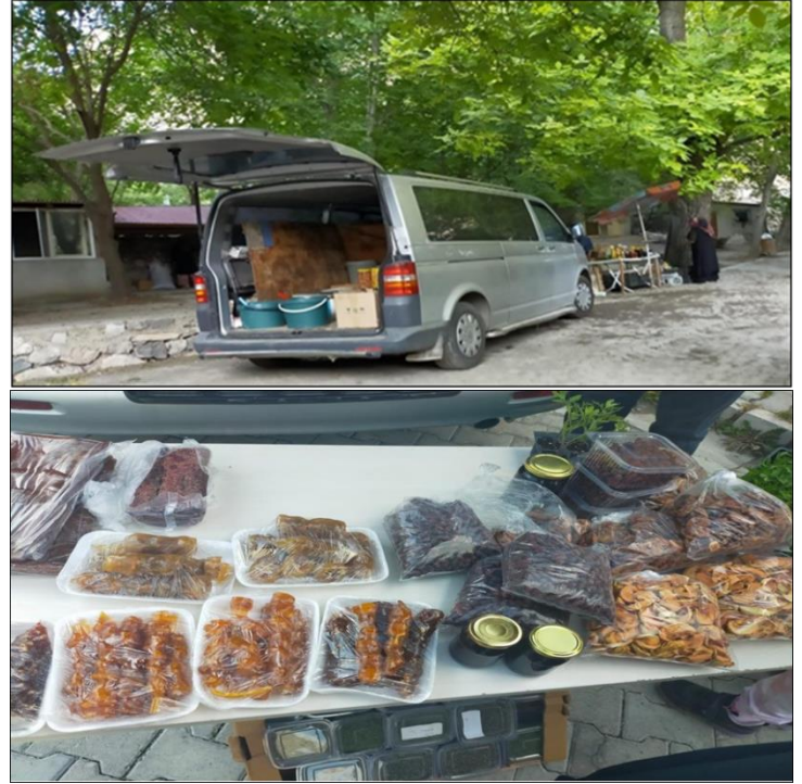
Fotoğraf 1. Kendi Yaptıkları Ürünleri Satışa Çıkaran Yerel Halk Tezgâhlarından Bir Görünüm

Ülkemiz konumu gereği elverişli iklim şartları ve verimli tarım topraklarına sahiptir. Bu elverişli imkânlarla bağlı olarak çeşitli meyve ve sebze türleri üretilebilmektedir (Koday & Şanlı, 2023, s. 373). Tortum ve Uzundere ilçesinde aynı zamanda bu ilçelere giden yollarda yerel halk yetiştirdikleri ürünleri yol boyu tezgâhlar kurarak satmaktadırlar. Özellikle turistlerinde yoğun olarak ziyaret ettikleri Tortum Gölü çevresinde halkın büyük bölümü bahçelerinden topladıkları meyve ve sebzeleri, yaptıkları pekmez, pestil, tereyağı gibi ürünleri satışa sunmaktadırlar. Tarımla uğraşan aileler topladıkları ürünleri anayol kenarlarına tezgâhlar açarak satmaktadır. Bu işlek yollardan geçen vatandaşların ilgisini çekerek alışveriş yapmaktadırlar. Direkt dalından topladıkları ürünleri yol kenarlarında satan aileler hem kazanç elde etmekte hem de agroturizmin gelişmesine katkıda bulunmaktadır (Fotoğraf 1). Yol kenarlarında sadece tarımsal ürünler satmak yerine yöreye özgü örgü işleri, el sanatları, hamur işleri ve yemekler satarak hem yörenin tanınmasına katkıda bulunmakta hem de ekonomik kazanç sağlamaktadırlar. Ayrıca yerel halkın hem ürünleri hem de yaşadıkları yer hakkında bilgiler paylaştıkları gözlemlenmiştir. Halkla yaptığımız mülakatlar sonucunda birçok kişinin köylerinde evleri bulunduğu ve yazın köyelerine gelip bahçe işleriyle uğraştıkları kışın ise Erzurum şehrinde yaşadıklarını belirtmektedirler.