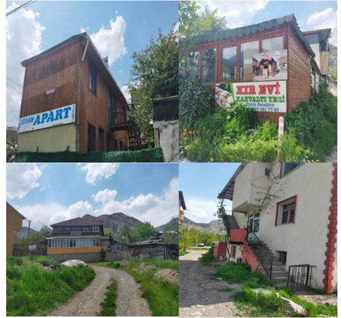
Fotoğraf 4. Uzundere İlçe Merkezinde Kurulan Turan Pansiyondan Görünümler

tesisi vardır. İşletmenin merkezi durumunda olan tesiste vişne, üzüm, kiraz ve dut ağaçları bulunmaktadır. Aynı zamanda 6 odalı bir tesistir. İkinci ise ilkinden yaklaşık 200 m uzaklıkta 6 odalı, iki katlı aparttır. İki ayrı tesiste yaklaşık 50 yataklı konaklama hizmeti verilmektedir. Çiftlikte çok az miktarda biber, patlıcan, salatalık ve soğan yetiştirilmektedir. Ziyaretçilere pazarlanmak üzere pestil, köme, pekmez, reçel ve marmelat gibi ürünler yapılmaktadır. Yurtdışından genellikle belirli organizasyonlar dâhilinde gelen gruplar kalmaktadır. Yurt içinden ise çok sayıda ilden ziyaretçiler gelmektedir (Kaymaz & Birinci, 2018, s. 121; Fotoğraf 4).