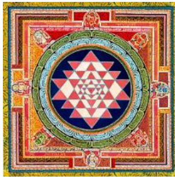
G.7: Tantra Yantra, (t.y.) Rudra Centre, Hindistan

Zen Daireleri, basitçe oluşturulmuş ve herkesin kolaylıkla yapabileceği bir formmuş bir gibi görünseler de felsefeleri oldukça derindir. Tek seferde ve nefeste çizilen bu daireler, insan hayatı, evren ve varoluşla bağlantılıdır. Sadece bir daire olmayan bu minimalist form; yaşamın dairesel döngüsü, her şeyin başlangıcı ve sonu, ruhun farkındalığı, beden ve ruhun bütünlüğü gibi ard anlamlarla bağlantılıdır. Derin anlamlar yüklü olan bu daire formunu; Hint felsefesi, Yunan mitolojisi, Budist inaniş, Rönesans tondo'ları ve Zen ensöları gibi pek çok inanç ve felsefede görmek mümkündür.