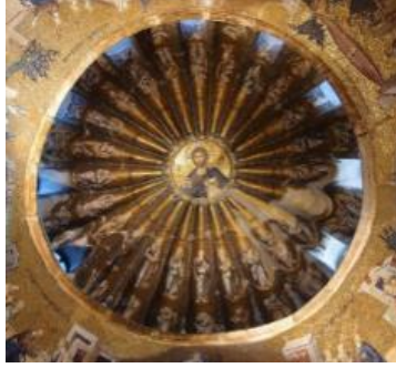
G.2: "Kubbede İsa", (Mozaik detayı) (1321), İstanbul, Türkiye

Hıristiyan resim sanatında, aziz sayılan kişilerin başları çevresine çizilen ve kutsallığı ifade eden ışıklı halka şeklinde olan haleler; o kişi veya kişilerin ruhanî değeri ve saygı kavramlarıyla bağlantılıdır (G.1) . Gökyüzünün az bulutlu ve açık olduğu zamanlarda çevresinde görülen halka şeklindeki ışık, bu sembolizmaya ilham kaynağı olmuştur. Daire formundaki haleler, Hıristiyanlık sembolizmasında bu şekilde yerini bulmuştur. Dini içerikli bu sahnelerdeki betimlemelerde dairesel form bazen, badem formunda olan Mandorla'lara dönüşmüştür.