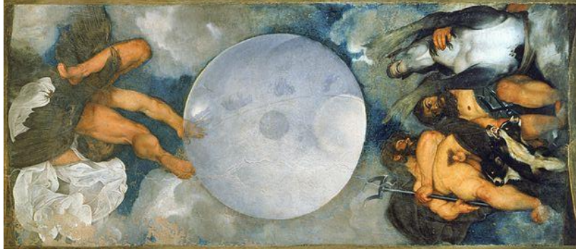
G.10: Michelangelo di Lodovico Buonarroti Simoni, "Jüpiter, Neptün ve Pluton", Fresko, yaklaşık 1597, Villa Ludovisi, Roma, İtalya

Barok dönem ustası Michelangelo Merisi da Caravaggio'ya, dönemin kardinali tarafından sipariş edilen ve kardinalin evinin tavanına "Jüpiter, Neptün ve Pluton" adlı eserinin felsefi boyutu derindir. Bu boyut, kardinalin, tüm doğal şeylerin; kükürt-hava (Jüpiter), cıva-su (Neptün) ve tuzlu toprak (Pluton) üçlü elementlerinden türetildiğine inanmasıyla bağlantılıdır. Figürsel olarak betimlenen bu üç element ve bir küreden oluşan kompozisyona, sanatçının kendi portresini yerleştirilmesi ilginçtir. Sanatçının portresi, sağda yer alan, Neptün ve Pluton arasındaki Jüpiter figüründe betimlenmiştir. Ortada yer alan göksel daire, iki erkek kardeşinin arasındaki Jüpiter tarafından, felsefe taşına, yani; yaşam iksirine dönüşebilmektedir. Bu dairesel form, elementlere ve dolayısıyla, maddi dünyaya hakim olabilmek ile bağlantılıdır. İnsanoğlu, tüm bunlara hakim olarak kendi ruhunu da kontrol edebilecektir (G.10).