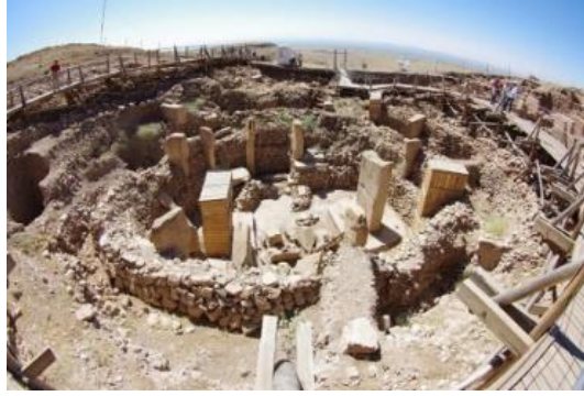
G.4: Göbeklitepe Tapınağı, (MÖ 9600), Şanlıurfa, Türkiye

Roma İmparatorluğu'nda da simgesel anlatıların yoğun olduğu pek çok dini yapı mevcuttur. Bu dairesel yapılara, İmparatorluğun da bir sembolü olarak kabul edilen Pantheon Tapınağı örnek verilebilir. Bu yapı, üzerinde 43 metre çapında bir kubbe ile tamamlanmıştır (MvVey,1983,ss,95). Tanrılara adanmış olan bu yapı, geometrik şekiller arasında sonsuzluğun en güçlü simgesel anlatımına sahip olan daire biçimi ile evrendeki birlik ve bütünlüğün de sembolik anlatsını taşımaktadır. Ayrıca, kubbe ortasında açılan daire formundaki oculus (sanal gerçekliğin penceresi), tanrının gözünü ifade etmekte ve bu dairenin hizasında duran insana yansıyan ışık ise, onu tanrıların gücüne erişirmektedir. Aynı zamanda, tüm bu yapılanma, İmparatorluğun tüm toplumlarının, bir gök kubbe altında birleştiğine yöneliktir (Şenyapılı, 2017, s.527) (G.3) .