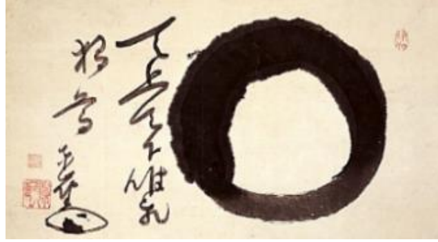
G.6: Ensō (Zen Dairesi), (Parşömen üzerine mürekkep), Enji, T. (Edo Dönemi)

Doğu Asya uygarlıklarının kültürlerine ait geleneksel bir mürekkep tekniği olan Ensō (Zen Daireleri) de; zen sanatının, saf ve spiritüel daire formlarına verilen isimdir. Tek hamlede kalın olarak çizilen bir formdur ( G.6 ). Zen Budizmi'nde daire; zihnin kontrolünden bağımsız, beden-ruh yaratımını ve bütünlüğünü sembolize eden bir formdur. An'da kalmayı başaran ve böylece aydınlanmaya ulaşabilen insanın halinin bir sembolüdür. Burada, kusursuz olmaya çalışmaktan çok, insanın ve evrenin olduğu gibi, akışta, dinginlikte, sonsuzlukta var olma hali söz konusudur.