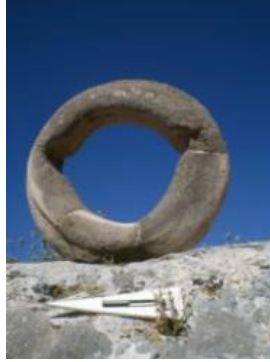
G.5: Gökbeği Tepe, Kireçtaşından yapılmış daire şeklinde heykel

Farklı kültürler içerisinde daire sembolünü, tarihi yapılarda da örneklemek mümkündür. Buna, Türkiye'de, Şanlıurfa'da kurulmuş olan ve insanlığın en eski yerleşim yeri olarak kabul