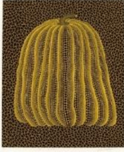
G.12: Yayoi Kusama, "Sarı Balkabağı", 1992, Japonya

dairenin geometrik karakterinden daha ziyade, içerisinde beni çeken ve sayısız varyasyonları olan bir iç kuvvet olduğu hissi almam olduğunu düşünüyorum" (Talekar, 2010, s.96). Sanatçının "Daire formu, yaşayan bir mucizedir" sözü de bu formun ne kadar etkisi altında kaldığını ortaya koymaktadır.