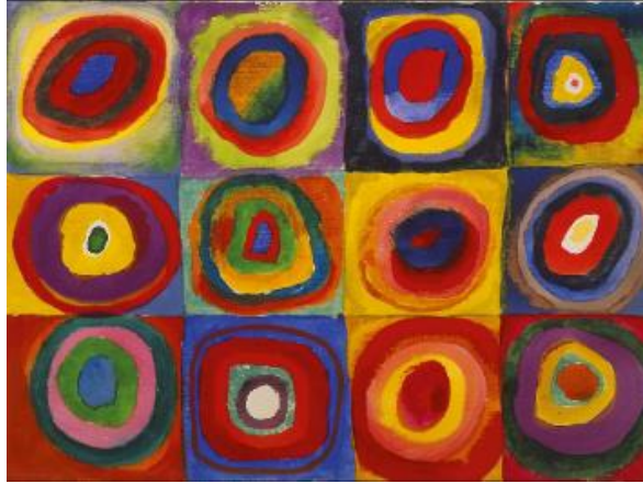
G.11: Wassily Kandinsky, "Renk Çalışması. Kareler İçinde Tek Merkezli Daireler", Tuval üzerine yağlı boya, 1913, Lenbachhaus Belediye Galerisi, Münih, Almanya

renk uyumu ve geometrik formlarla yapılan düzenlemeleriyle öne çıkmıştır. Özellikle, dairesel formlar ve renklerle, şiirli, müzikli bir anlatıma ulaşmıştır. Bu geometrik anlatım ile çağın iç yapısına ve iç dünyalara ait dinamizm yansıtmak amaçlanmıştır (Cançat,2023,s.201).