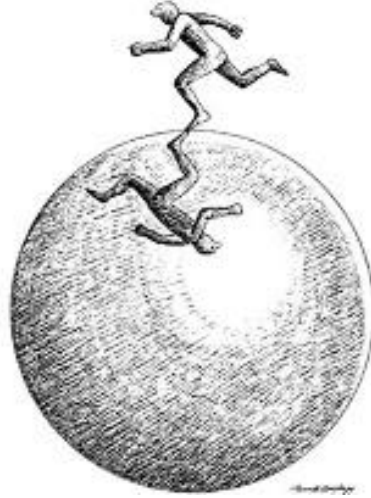
G.15: Faruk Çağla, "İsimsiz", Kâğıt üzerine rapido tarama, 1984

Sanatçının bu tür ifadeleri için daire formundan yola çıkması dikkat çekicidir.