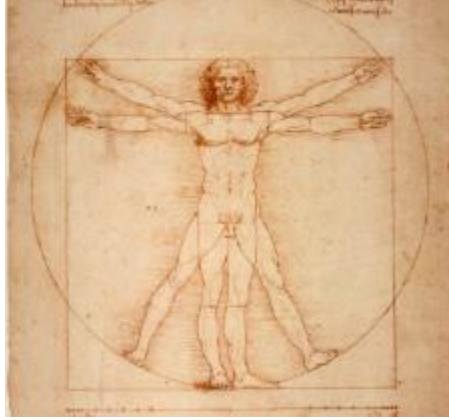
G.9: Leonardo da Vinci, "Vitruvius Adamı", Kâğıt üzerine mürekkep ve sulu boya, yaklaşık 1491, Akademi Galerisi, Venedik, İtalya

Dünyanın çeşitli yerlerindeki arkeolojik ve etnografik buluntularda dairesel formda pek çok esere rastlanmıştır. Bu yapılarda daire formu, ya eserin üzerine çizimler şeklinde uygulanmış ya da bizzat eserin kendisi dairesel formda yapılmıştır; sikke, takı, mühür, madalyon, tepsi, çanak-çömlek vs. örnek verilebilir. Bunların dışında; hat sanatı, minyatür sanatı, ebru sanatı, çini, halı, dokumalar ve bezeme örnekleri, günümüze doğru ise resim sanatı, grafik sanatı, hatta dijital sanat ve tasarım uygulamalarında, daire formu hem biçim hem de içerik olarak sıkça kullanılmaya devam etmektedir.