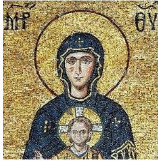
G 1: "Meryem Ana ve Çocuk İsa", (Mozaik detayı) 12. yüzyıl, Ayasofya Müzesi, İstanbul

Batı Afrika halkının geleneksel bir simgesi olan iç içe geçmiş üç daire ise; büyüklüğü, liderliği, karizmayı ve yayılmayı sembolize eder (Kissi,2019,s.30). Önemli dersler de veren bu ideografik form, aynı zamanda, yerleşik yaradılış düzeninin sembolü olarak da ifade edilebilmektedir. Avustralya Aborijinleri daire formunu; rüya öykülerinde, su birikinti ve toplanma yeri işaretleri olarak benimsemiş ve kullanmışlardır (Wilkinson,2021 ,s.284).