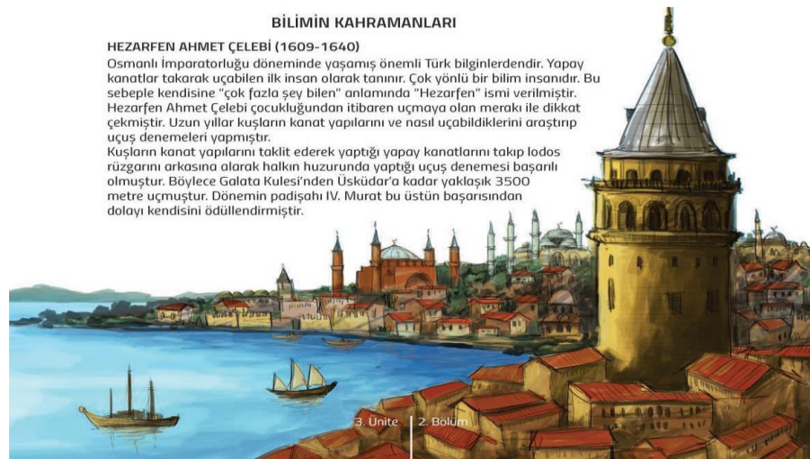
Şekil 1. MEB'e ait 5. sınıf fen bilimleri ders kitabında SKM örneği (Akter, Arslan ve Şimşek, 2022)

Tablo 3 incelendiğinde ders kitabında beş farklı kültürel miras unsur çeşidine yer verildiği belirlenmiştir. Ders kitabında dört farklı ünite de 29 kültürel miras unsuru belirlenmiştir. Bunlardan en fazla SKM (f=21) yer alırken SOKÜM (f=8) yer verilmiştir. Somut kültürel miras unsur çeşidinde ise taşınır kültürel miras (f=12) en fazla kültürel miras unsuru olup daha sonra taşınmaz kültürel mirasa (f=9) yer verilmiştir. Ders kitabında gösteri sanatları ve doğa evrenle ilgili bilgi uygulamalarına ise yer verilmemiştir. İlgili kültürel miras unsurlarına ders kitaplarında en fazla görsel (f=18) olarak yer verilirken metin içerisinde (f=11) belirtilmiştir. Ortaokul 5. sınıf fen bilimleri ders kitabında yer verilen kültürel mirasa ilişkin örnek aşağıda verilmiştir.