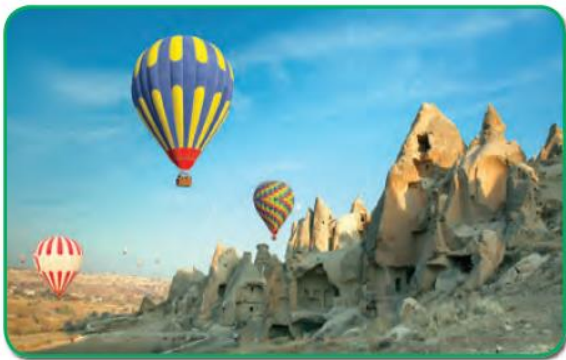
Şekil 8. Özel yayınevine ait 8. sınıf fen bilimleri ders kitabında SKM örneği (Yancı, 2018)

Tablo 10 incelendiğinde ders kitabında sadece taşınır ve taşınmaz kültürel miras olmak üzere iki farklı kültürel miras unsur çeşidine yer verildiği belirlenmiştir. Ders kitabında sadece bir üniteye yedi kültürel miras unsuru belirlenmiştir. Ders kitabında en fazla SKM (f=7) yer alırken bunlardan taşınır kültürel mirasa (f=4) en fazla yer alırken taşınmaz kültürel miras (f=3) olarak yer verilmiştir. İlgili kültürel miras unsurlarına ders kitaplarında en fazla görsel içerisinde (f=5) olarak yer verilirken metin içerisinde (f=2) belirtilmiştir. İlgili ders kitabında yer verilen kültürel mirasa ilişkin örnek Şekil 8'de sunulmuştur.