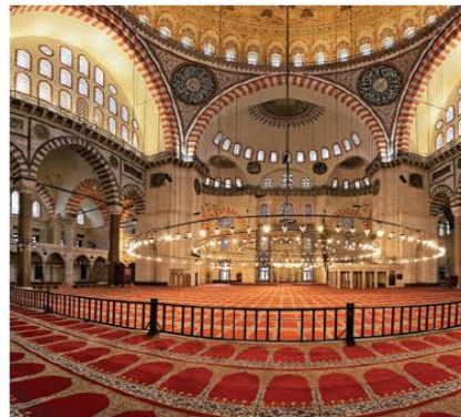
Süleymaniye Camii - İstanbul

Şekil 4. Özel yayınevine ait 6. sınıf fen bilimleri ders kitabında SKM örnekleri (Çiğdem, Minoğlu Balçık ve Karaca, 2018)