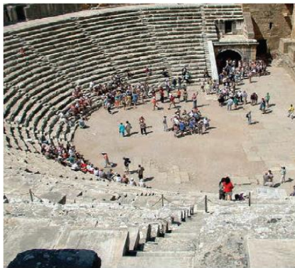
Aspendos Antik Tiyatro - Antalya

Tablo 6 incelendiğinde ders kitabında sadece SKM başlığı altında taşınmaz kültürel miras (f=14) unsuruna yer verildiği belirlenmiştir. Kültürel miras unsurlarının ders kitabında üç üniteye yer almıştır. İlgili kültürel unsurlar en fazla metin (f=8) içerisinde daha sonra görsel (f=6) olarak ders kitabında belirtilmiştir. İlgili ders kitabında yer verilen kültürel mirasa ilişkin örnek Şekil 4'te verilmiştir.