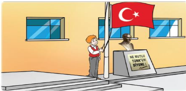
Şekil 7. Özel yayınevine ait 8. Sınıf fen bilimleri ders kitabında SKM ve SOKÜM örneği (Yiğit, 2022)

Tablo 9 incelendiğinde ders kitabında sadece sözlü gelenekler anlatımlar ve taşınır kültürel miras olmak üzere iki farklı kültürel miras unsuruna yer verildiği belirlenmiştir. Ders kitabında sadece bir üniteye dört kültürel miras unsuru belirlenmiştir. Bunlardan en fazla SKM (f=3) yer alırken SOKÜM (f=1) yer verilmiştir. Ders kitabında en fazla taşınır kültürel mirasa (f=3) yer verilmiş olup sözlü geleneklere ve anlatımlara (f=1) yer verilmiştir. İlgili kültürel miras unsurlarına ders kitaplarında en fazla görsel içerisinde (f=3) olarak yer verilirken metin içerisinde (f=1) belirtilmiştir. Ders kitabında bulunan kültürel mirasa ilişkin örnek aşağıda sunulmuştur.