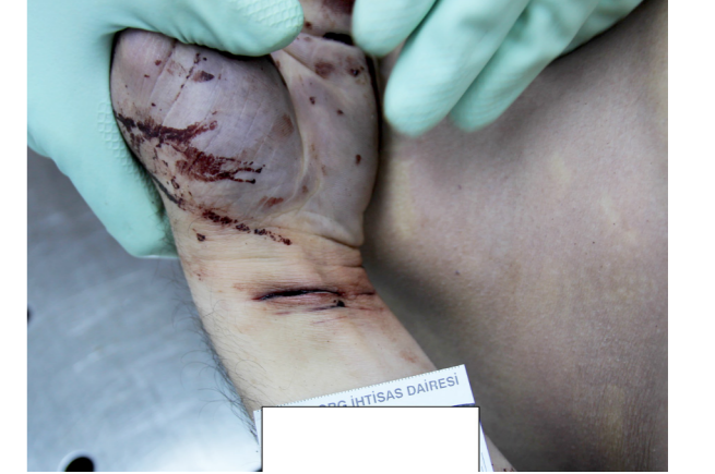
Resim 1. Olgu 1'e ait el bilek kesileri.

15-24 yaş aralığı intihar girişimi yönünden en fazla vakanın görüldüğü aralık olup %78'ini kadınlar,