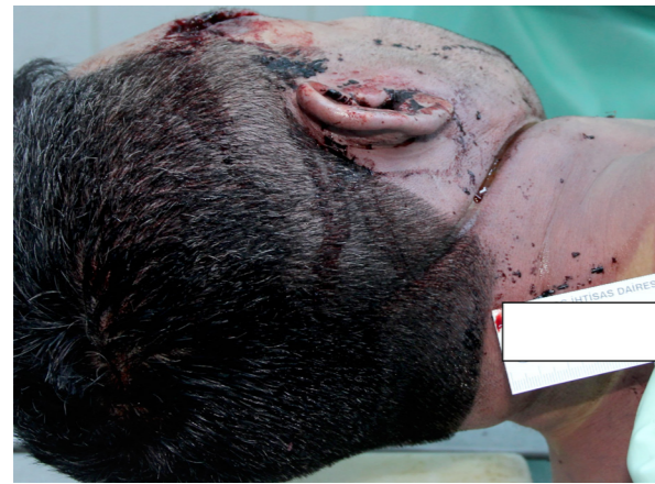
Resim 3. Olgunun 1'e ait telem.

30 yaşındaki erkek olgunun Çin Halk Cumhuriyeti vatandaşı olduğu, babası ile beraber Türkiye'ye ti-