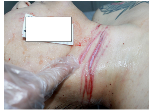
Resim 4. Olgunun 2'ye ait boyun kesileri.

Dünya Sağlık Örgütü intiharı "büyük bir kamu sağlığı sorunu" olarak tanımlamaktadır. Yine DSÖ