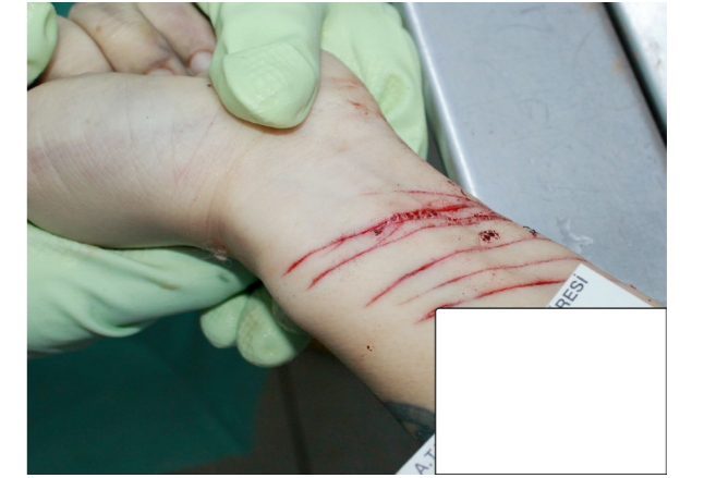
Resim 5. Olgunun 2'ye ait el bilek kesileri.

İkinci olguda kullanılan intihar yöntemleri kesici delici aletle yaralama ve yüksekten atlamadır. Boyun sağ tarafta bulunan ve 15 cm'ye kadar uzayan çok sayıdaki cilt ve cilt altına içine alan kesiler intihara yönelik ciddi girişimi göstermektedir. Fakat ilk girişimin başarısızlıkla sonuçlanmasının ardından olgu tarafından daha garanti görülen yüksekten atlama yöntemi kullanılmıştır. Yüksekten atlayarak intihar etme yöntemi ise ası ve ateşli silah kullanımının ardından üçüncü sırada yer almaktadır (6). İntihar girişimleri ve intihar arasında risk faktörleri açısından da kısmi farklılıklar bulunmaktadır. İntihar girişimlerinin intihar olguları açısından bir alarm, bir uyarı ma-