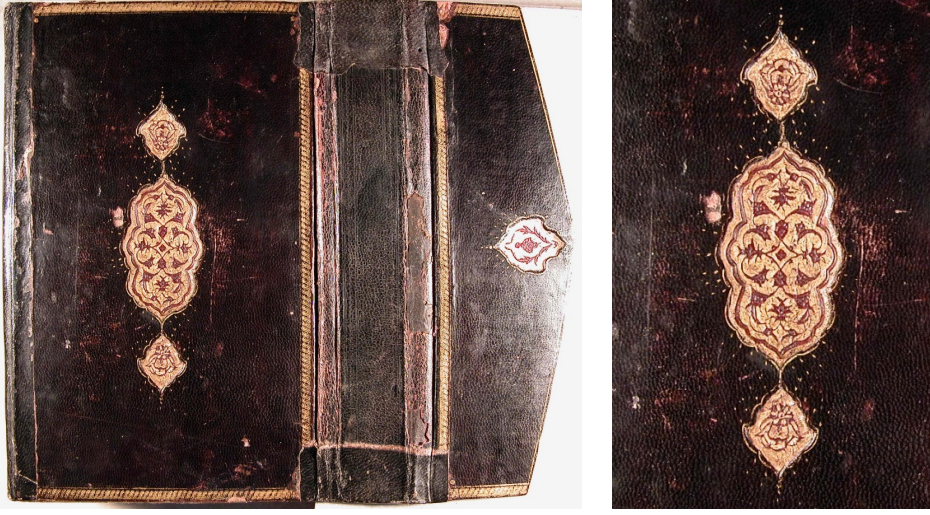
Fotoğraf 10: 4774 Demirbaş numaralı el-Hidâye fî şerhi'l-Bidâye

260 demirbaş numaralı Nefhatü'l-üns fî şerhi Ravzati'l-kuds adlı eser 195x120 mm. ölçülerinde olup, Abdülganî İbnü'l-Hâc Ali tarafından istinsah edilmiştir. Kitabın kapaklarındaki ve miklebindeki şemseler mülevven ve alttan ayırma tekniğinde süslenmiştir. Cilt kahverengi deriyle kaplanarak mülevven kısımları siyah deriyle yapılmıştır. Kapaklar sarmal zencereklerle çevrelenmiş, köşebent uygulamasına yer verilmemiştir. Gömme tekniğinde yapılan şemseler, kenarları dilimli ve oval formda olup etrafı altın tığlıdır. Yüzeyinde ¼ simetrik biçimde yer alan kompozisyonda kurdeler şeklinde birbirine bağlanan bulut motifleri ve zeminde hatâyî grubu motifler görülür. Miklebin ucunda bulut motifiyle tezyin edilmiş dilimli ve oval formda şemse mevcuttur. Eser, ketebe kaydına göre 1084 (1673-1674) tarihlidir. Şemseler ve bezeme kompozisyonu bakımından incelendiğinde cilt, eserin yazıldığı tarihle uyumludur ve XVII. yüzyıla atfetmek mümkündür (Fotoğraf 11).