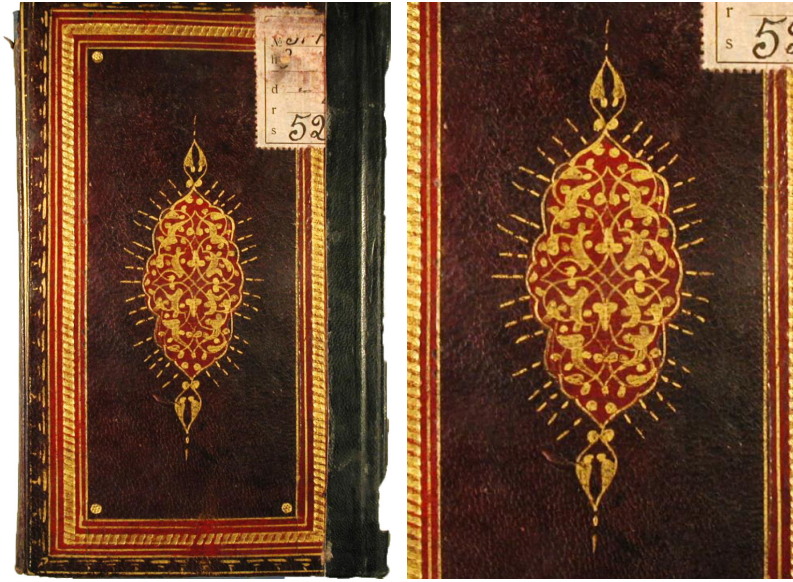
Fotoğraf 14: 36 demirbaş numaralı Meşâriku'l-envâri'n-nebeviyye min sıhâhi'l-ahbâri'l-Mustafaviyye

36 demirbaş numaralı Meşâriku'l-envâri'n-nebeviyye min sıhâhi'l-ahbâri'l-Mustafaviyye adlı eser 175x105 mm. ölçülerindedir. Bordo renkli deriyle kaplanan eserin her iki kapağı ve miklebi aynı düzende yapılmıştır. Ciltte şemselerin zemini ve zencerekli cetvellerin içinde kalan boşluklar kırmızıya boyanarak mülevven tekniği uygulanmıştır. Aynı zamanda şemselerde yekşah tekniği görülmektedir. Kapak köşelerine birer altın nokta yerleştirilmiştir. Kapakların ortasındaki şemseler ortası bombeli, kenarları dilimli dikdörtgen şeklindedir. Şemse kompozisyonu, kıvrım dalların üzerindeki rûmî ve palmet motiflerinden oluşmaktadır. Dilim aralarına tığlar çekilen şemselerin uçlarında salbekler mevcuttur. Miklep kapakla uyumlu bir şekilde düzenlenmiş, üçgen biçimli uç kısmına dilimli oval bir şemse yerleştirilmiştir. Eser 1166 (1752-1753) yılında yazılmıştır. Kompozisyon ve teknik özellikleri bakımından cilt, eserin yazıldığı döneme, XVIII. yüzyıla atfedilebilir (Fotoğraf 14).