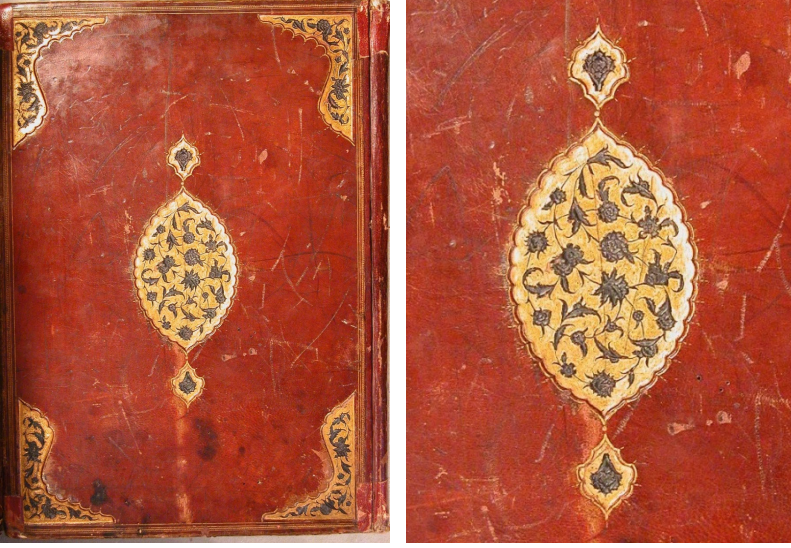
Fotoğraf 3: 5554 Demirbaş numaralı el-Keşşâf an hakâiki gavâmizi't-tenzil ve uyûni'l-ekâvil fi vücûhi't-te'vil

\frac{1}{4} simetrik olarak düzenlenmiştir. Ortada palmet şeklindeki dört kartuş altına boyanmış, zeminde ise siyah deri ince bir işçilikle rûmî, palmet ve lotustan oluşan bir kompozisyonla tezyin edilmiştir. Şemselerin dilim araları altın tıgıdır. Uçlarına yerleştirilen palmet şeklindeki salbekler, rûmî ve palmetlerle süslenmiştir. Köşebentler şemsenin \frac{1}{4} büyüklüğünde düzenlenmiş, uç kısımlarına yarım salbekler yerleştirilmiştir. Cildin sırt bölümü süslemesiz olup, sertap kısmında da yalnızca kenarlarına cetveller çekilmiştir. Miklepte kapaklardaki süslemenin \frac{1}{2} si görülmektedir. Eserin ke-tebesi bulunmadığından tarihi bilinmemektedir. Ciltteki şemselerin formları, süsleme kompozisyonu ve tekniği göz önüne alındığında Konya Mevlânâ Müzesi'ndeki XVI. yüzyıla tarihlenen 64 numaralı eserin cildi 17 ve Süleymaniye Kütüphanesi Fatih bölümündeki 3815 numaralı eserin cildine 18 benzemektedir. Bu sebeple cilt XVI. yüzyıla tarihlendirilebilir (Fotoğraf 4).