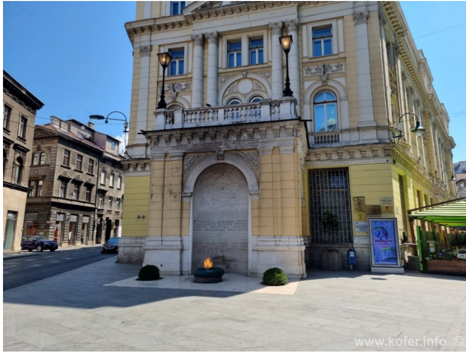
Görsel 6. Sönmeyen Ateş (Kofer, 2019).