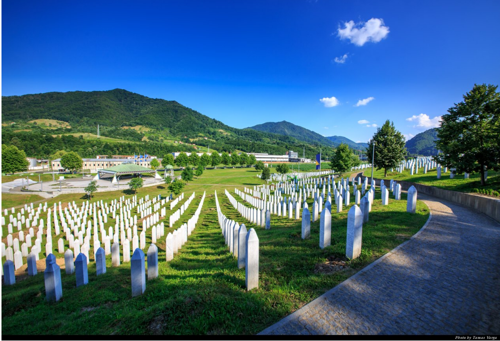
Görsel 9. Srebrenitsa-Potočari Anma Merkezi ve Mezarlığı (Varga, 2024).

Birçok karanlık turizm sitesi gibi, Srebrenitsa Soykırım Anıtı da sanal turlar sunmaktadır. Sanal turlar, turistlerin ziyaretin neleri içereceğini anlamalarına ve ziyaretin gerektirdiklerini uygulamalarına yardımcı olmaktadır (Restrepo-Harner, Marsico & Kerr, 2023).