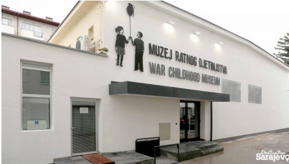
Görsel 4. Savaş Çocukluğu Müzesi (Destination Sarajevo, 2020).