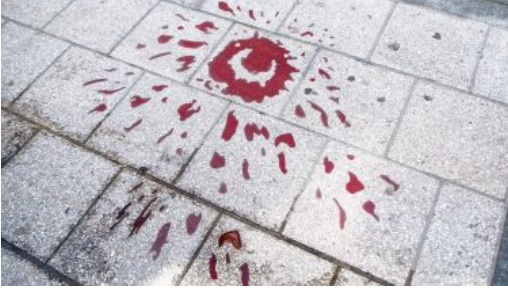
Görsel 5. Saraybosna Gülleri (Destination Sarajevo, 2024).