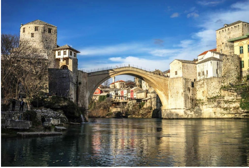
Görsel 8. Mostar Köprüsü.

eklenmiştir (Forde, 2016, s. 476; Mepa News, 2021; Uluengin & Uluengin, 2015, s. 336). İnşa edilen yeni köprünün üzerinde, üzerinde "93'ü Unutmayın" yazısı yer alan, eski köprüye ait bir kalıntı yer almaktadır (Wise, 2011, s. 13). Yeni köprünün Mostar ve Bosna-Hersek halkına, yeni Mostar Köprüsü'nün bölünmüş bir halkı birleştirmek için barış içinde inşa edildiğini hatırlamalarına yardımcı olması umulmaktadır (Armaly vd., 2004, s. 16).