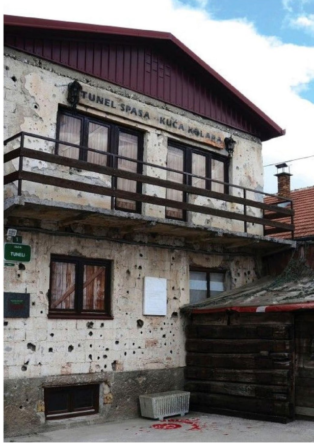
Görsel 2. Saraybosna Tünel Müzesi (Farley, 2018).