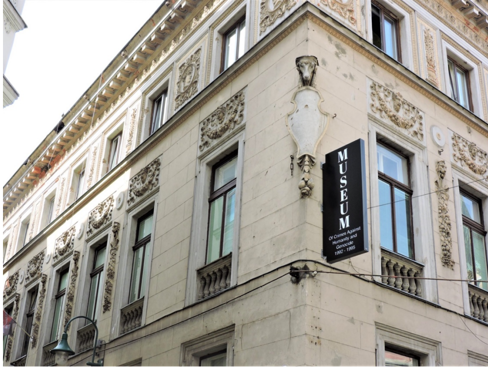
Görsel 3. İnsanlığa Karşı Suç ve Soykırım Müzesi (Visit Sarajevo, 2024).

Müzede ayrıca Lahey'deki Eski Yugoslavya Uluslararası Ceza Mahkemesinde (ICTY) görülen savaş suçu davalarının arşivi, Bosna-Hersek genelindeki toplama kampları ve toplu mezarlara dair bilgiler ve belgeseller de bulunmakta, ciltler dolusu kayıtlarda öldürülen kişilerin isimleri, yaşları, ölüm tarihleri sıralanmaktadır (Besic, 2018; Söylemez, 2019). Müze sahip olduđu zengin arşiv ile 1992-1995 döneminde Bosna-Hersek'te yaşanan olayların araştırılması ve anlaşılması için multidisipliner bir yaklaşım sunmaktadır (Viator, 2023). "Kuşatma Altındaki Şehir" ve "Cezasızlığın Sonu - Mahkeme Önünde Cinsel Şiddet" ve korkularını yenerek mahkemede ifade veren mağdur ve tanıkları konu alan "Onların Gözünden" gibi savaşla ilgili filmlerin de gösterildiđi müzede (Tolj, 2016) ayrıca ziyaretleri daha gerçekçi kılmak için bir toplu mezar simülasyonu ve bir hücre hapsi sunulmaktadır (Safarway, 2023).