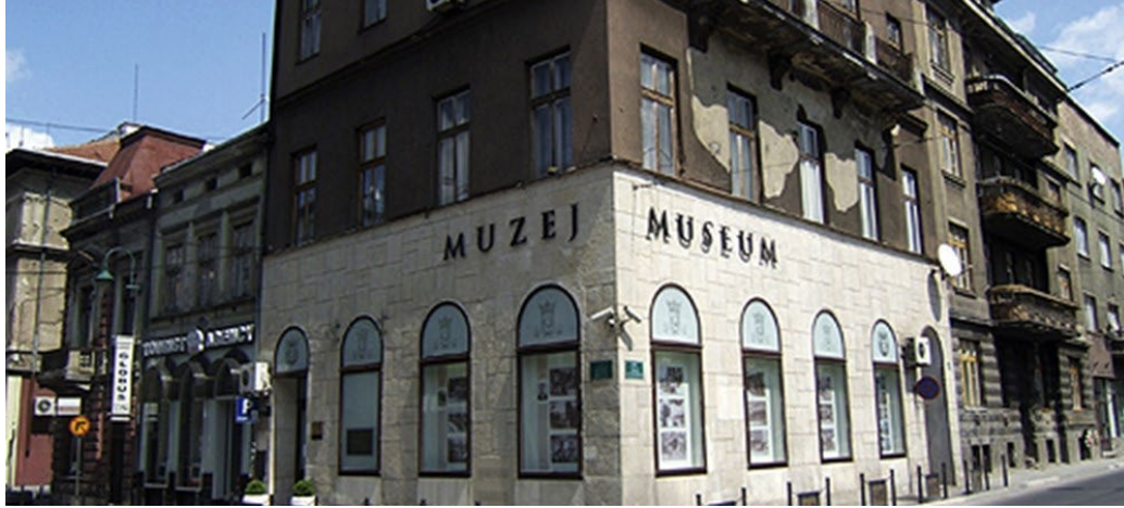
Görsel 1. Franz Ferdinand Suikast Alanı ve Müzesi (Museums of The World, 2024).

Dolayısıyla, bu alanların önemine dair değerlendirmeler, ziyaretçilerin beklentilerine ve turizm deneyimlerinden ne beklediklerine göre deđişiklik gösterebilmektedir.