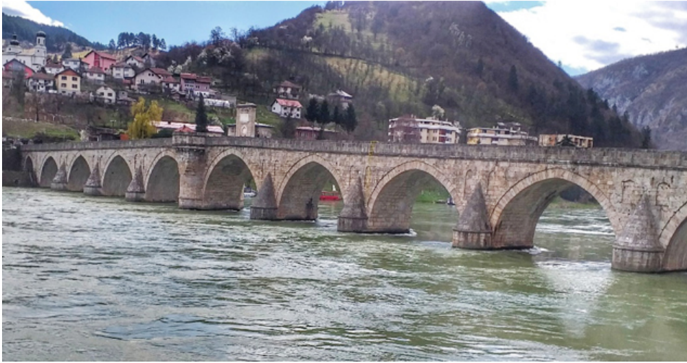
Görsel 10. Drina Köprüsü.

Vişegrad kasabası, 1992-1995 Bosna Savaşı sırasında Bosnalı Sırp tarafından başlatılan etnik temizlik ve soykırım harekâtlarının merkezi haline gelmiştir. Bu dönemde Drina Köprüsü, Sırp askerlerinin Müslüman Boşnaklara karşı işlediği katliamların simgesi olmuştur. Köprü, binlerce Boşnak'ın cesetlerinin Drina Nehri'ne atıldığı, nehrin turkuaz sularının kanla kıvılcı boyandığı ve yıllar sonra baraj gölünde cesetlerin bulunduğu bir trajediye tanıklık etmiştir. Vişegrad'daki bu olaylar, köprüyü bir ölüm simgesi haline getirmiş ve Bosna Savaşı'nın en karanlık yüzünü yansıtan bir sembol olarak öne çıkarmıştır (Çetinkaya, 2013; United Nations - International Criminal Tribunal for the former Yugoslavia, 2024; Vulliamy & Jelacic, 2005). Drina Köprüsü, bu trajik geçmişi ve sembolik değeriyle savaş turizminin en çarpıcı örneklerinden biri olarak anılmaktadır. Bu yüzden de belki de dünya üzerindeki "en hüznü köprü" olarak nitelendirilebilir (Popović, 2023; Totejo Türkiye, 2024).