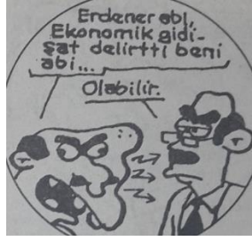
Çizim 1: Erdener Abi'nin, ekonomik konjonktüre yönelik takındığı kayıtsız tavır

Erdener Abi, evi karşılığında arsa ve araba takası önerisinde bulunarak piyasaya ağzıyla konuşan birini terslemektedir (Ertem, 2001: 60).