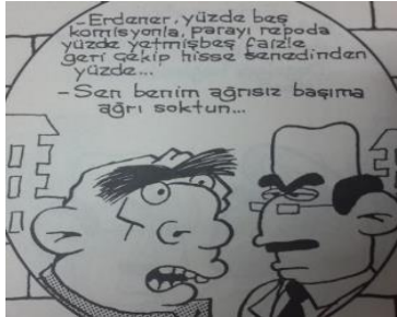
Çizim 2: Erdener Abi'nin, maddiyata dayalı konulara ilişkin tepkisini betimleyen bir çizim