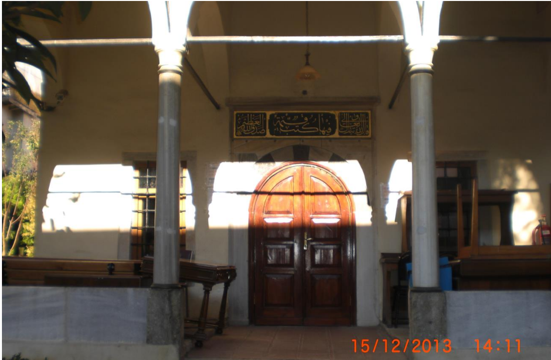
EK 7: Hacı Selim Ağa Kütüphanesi Giriş Kapısı ve Kitabesi