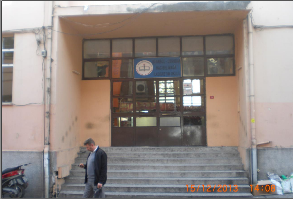
EK 4: Hacı Selim Mektebi'nin şimdiki hâli