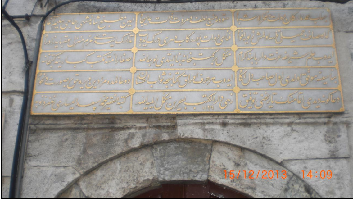
EK 6: Hacı Selim Ağa Kütüphanesi Avlu Kapısı Kitabesi