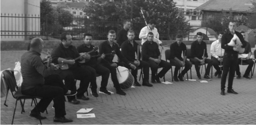
Fotoğraf 3 Makedonya Halk Müziği icrası - Goce Dolcev Üniversitesi Müzik Sanatları Fakültesi 12.06.2016