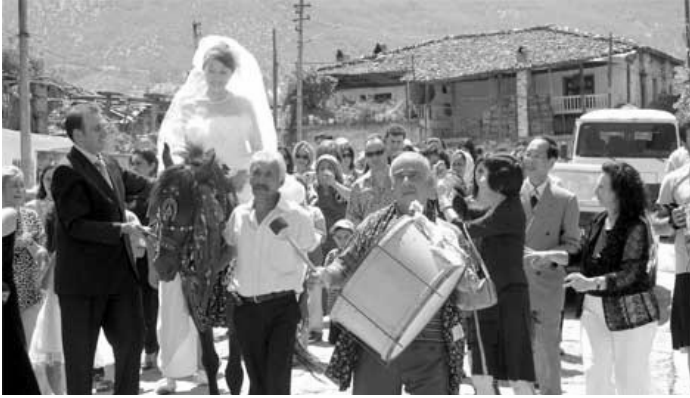
Fotoğraf 8 Anadolu Düğünü