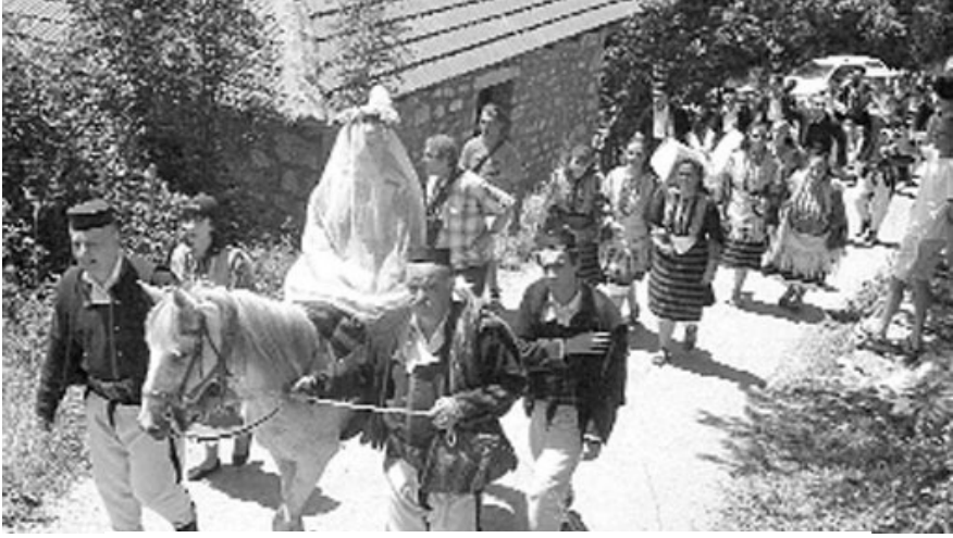
Fotoğraf 9 Makedon Düğünü Величествен Јубилеј На Галичка Свадба, 15. 07. 2012