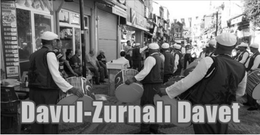
Fotoğraf 18Makedonya’da düzenlenen yağlı güreş turnuvasından (golcukhaber.com.tr 17.05.2016) ve Edirne Kırkpınar Güreşlerine halkı davet (edirmehaber.org 20.07.2016)