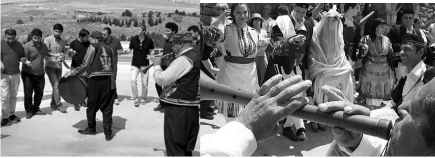
Fotoğraf 12 Anadolu Düğünü(www.davulzurnakiralama.com) ve Ma- kedon Düğünü (www.mkd-news.com)

İki zurnanın yer aldığı Makedon eğlencelerinde, genellikle ikinci zurna ilkinde eşlik eder. İlk zurna ana melodiyi çalarken, diğeri eşlikçidir. Bazen iki zurna sürekli unison (tek ses); bazen de oktav aralığında veya üçlü aralıkta da çalabilmektedirler. Zurna çalan kişi performansı esnasında sık sık doğaçlamalara yer verir (Juhasz 2002: 2; Angelov ile kişisel görüşme 09. 06. 2016). Türk eğlencelerinde de benzer bir durum vardır. İki zurnanın yer aldığı performanslarda genellikle bir zurna ana melodiyi çalarken, diğeri “dem ses” tutarak ona eşlik eder. Ancak tıpkı Makedonya’da olduğu gibi iki zurnanın aynı sesi çaldığı da görülebilir.