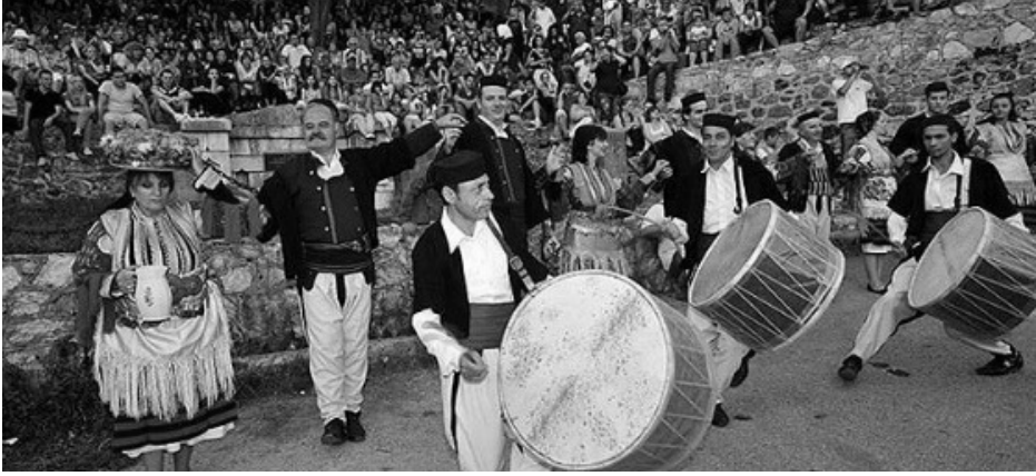
Fotoğraf 11 Makedon Düğünü