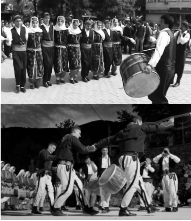
Fotoğraf 14 Türk düğünü (dimobetchev.tripod.com 07.07.2016) ve Makedon düğünü (travelmacedonia.info 19.07.2012)

kına günü erkek evinden kız evine giden davulcu, zurnacı ve kınacıya, kız evinden havlu, heybe hediye edilir.