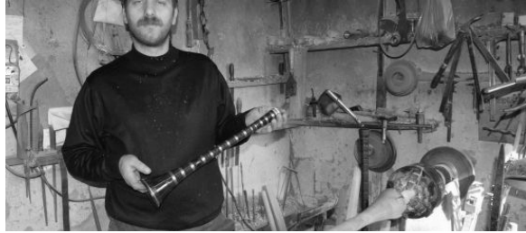
Fotoğraf 6 Zurna Yapımı

bakımından zurna ile tamamen paraleldir. Aşağıda solda Anadolu zurnasının, sağda ise Makedon zurlasının yapım aşamalarından fotoğraflar sunulmaktadır.