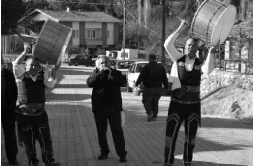
Fotoğraf 10 Anadolu Düğünü