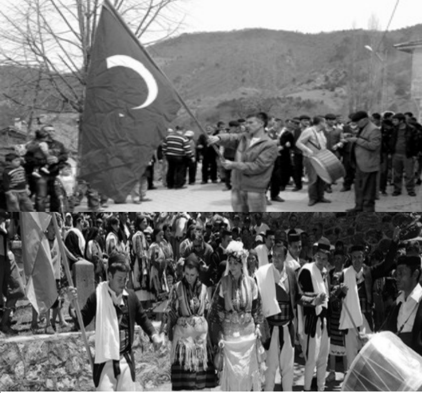
Fotoğraf 13 Türk düğünü ve Makedon düğünü

(zurna) ve Makedon bayrağı ile birlikte, Makedon düğünlerinin vazgeçilmez çalgısı olmuştur. Bu milli kimlik yükleme, Anadolu düğünlerinde, asker uğurlamalarında da görülür. Bayrağın /sancağın davul ve zurna ile birlikte yer alışı, daha önce de değinildiği üzere binlerce yıllık bir Türk geleneğidir.