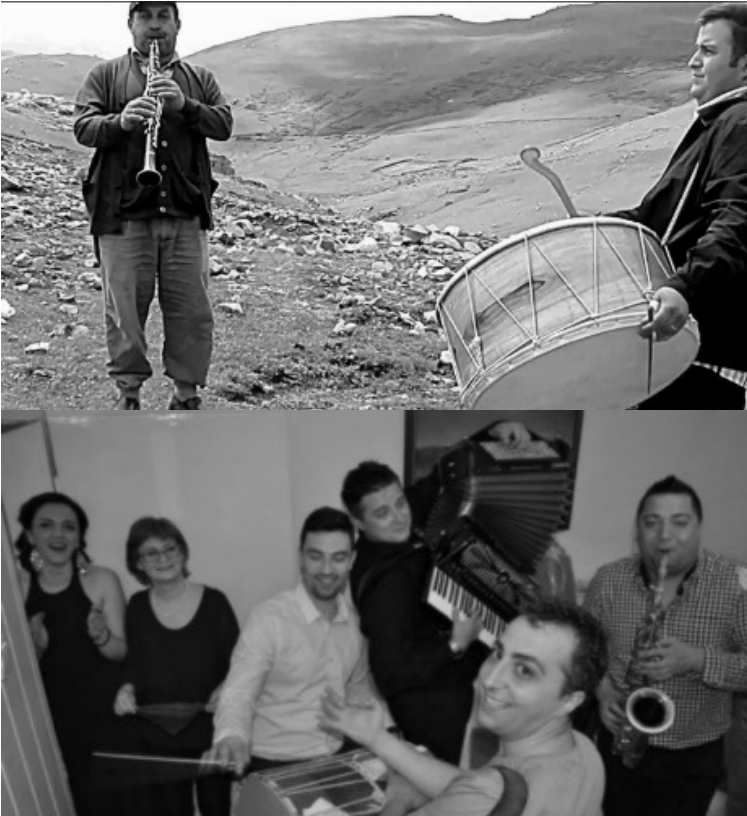
Fotoğraf 19 Davul - Klarnet (Türkiye Aydındere) ve Davul-Saksafon-Akordeon (Makedonya)