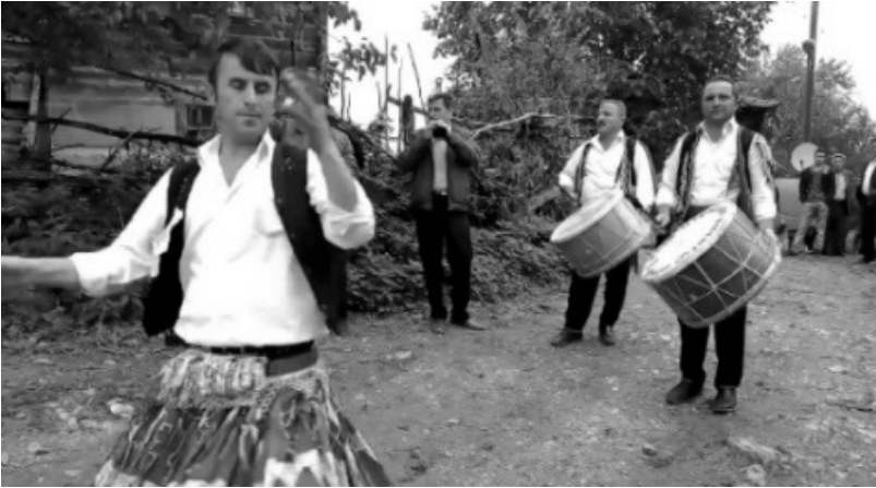
Fotoğraf 16 Köçekler ve davul – zurna (youtube gerze - davul zurna ve köçek; hürriyet.com.tr)

Makedon düğünlerine baktığımızda yaygın ve gelenekselleşmiş bir tema ile karşılaşırız. Makedonya'da davul şovu, en önemli geleneklerden birisi halindedir. Davulcunun yerde dik duran davulu, diz üstüne çökerek çaldığı anda, bir kişinin tek ayağı ile davula basması çok sık görülmektedir.