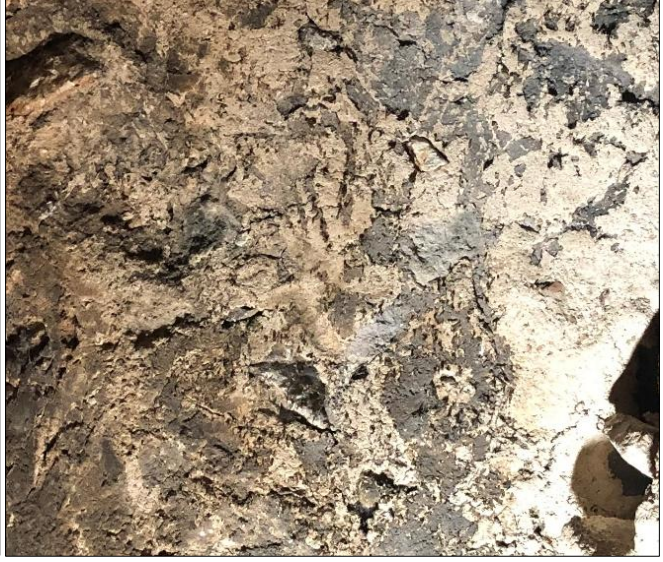
Şekil 5. Hamsa betimini gösteren fotoğraf