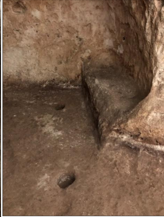
Şekil 7. Zemine açılan masa ayaklığı (Kazı arşivi)