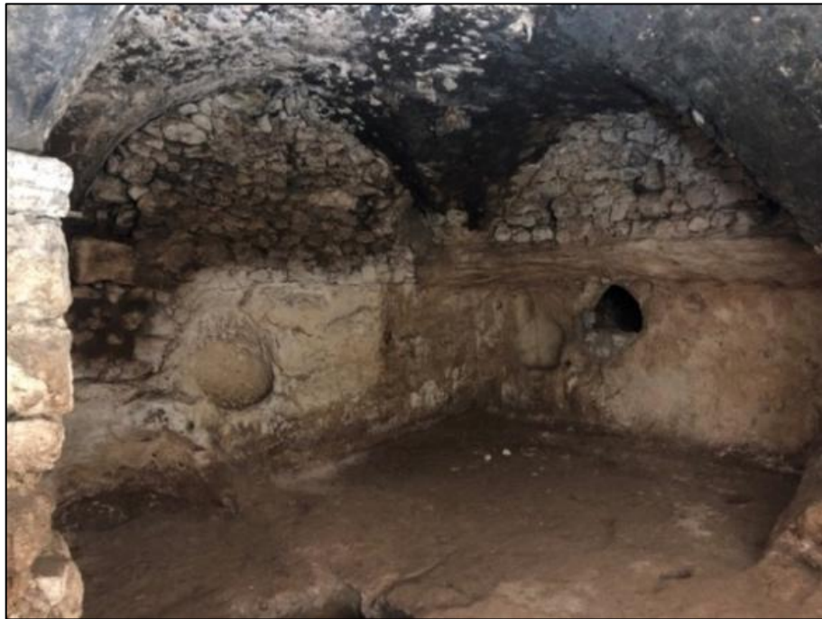
Şekil 1. A-10 mekânı genel görünümü (Kazı arşivi)