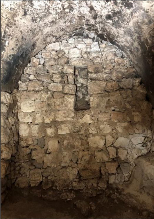
Şekil 6. Yapının güney duvarına açılan pencere