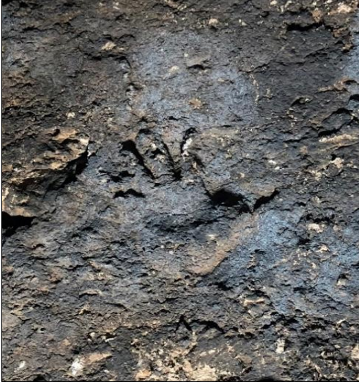
Şekil 4. Hamsa betimini gösteren fotoğraf ve çizim