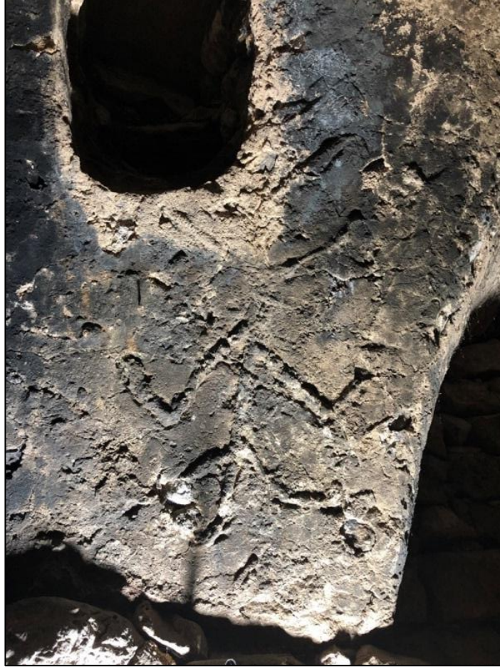
Şekil 8. Bitkisel motif