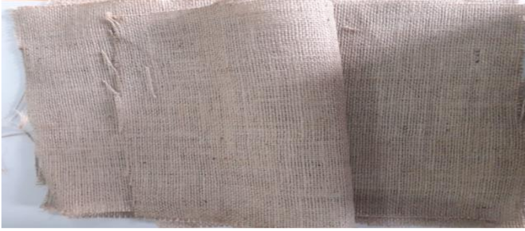
Şekil 1. Bitkisel Jüt Lifi