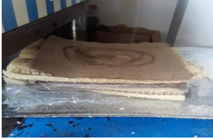
Şekil 3. Test Örneklerinin Hazırlanması

Takviye elemanlarının hassas tartı ile ağırlıkları ve kumpas yardımı ile kuru haldeki kalınlıkları belirlenmiştir. Belirlenen ağırlık ve kalınlığa göre matris elemanının miktarı hesaplanmış olup matris elemanı olarak kullanılan epoksiye %30 oranında sertleştirici eklenmiştir. Kompozit malzemelerin üretilmesi için iki adet metal plaka kullanılmıştır. Kompozit malzemelerin kalıptan rahat bir şekilde ayrılması için kalıp ayırıcı kullanılmıştır. Takviye elemanı olarak kullanılan lifler elle yerleştirme yöntemiyle kalıplara dizilmiş ve matris elemanı her bir katman arasında gelecek şekilde kalıba dökülmüştür. Isıtılmış plakalara sahip bir hidrolik pres yardımıyla kalıp dikey ekseninde sıkıştırılmıştır. Alttaki plaka makinenin tablasında sabitken üstteki plaka istiflenmiş numuneleri sıkıştırmak için PLC tarafından 5 bar basınç ile 100 dakika boyunca 85 °C'da bekletilmiştir. Sıkıştırma işleminden sonra numuneler 72 saat soğutulmaya bırakılmış ve daha sonra kalıptan çıkarılmıştır. Hazırlanana numuneler CNC Router kullanılarak ısı iletim katsayısı ölçümü için uygun numuneler kesilmiştir, Şekil 4. Isı iletim katsayısı ölçümü için çapı 50.80 mm olacak şekilde numune alınmıştır. Her bir ölçüm için kompozit plakadan ikişer adet kesilmiştir, Şekil 5. Daha sonra üretilen biyokompozit malzemelerin termal özelliklerinin belirlenmesi için ısı iletim katsayısı testleri yapılmıştır.