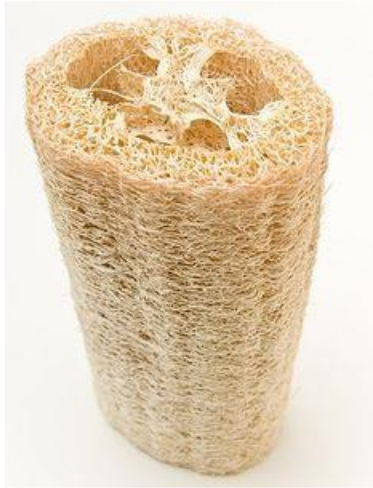
Şekil 2. Bitkisel Kabak Lifi

Bu çalışmadaki amaç doğal liflerin (kabak, jüt) ve onların hibritlenmesi ile elde edilecek numunelerin termal özelliklerinin karşılaştırılmasının yapılmasıdır. Bu sebeple, hazırlanan kabak lifi takviyeli kompozit numuneler için 4 kat kuru kabak, jüt takviyeli kompozit numuneler için 10 kat kuru jüt lifi kullanılmıştır. Hibrit numuneleri hazırlamak için ise kabak lifi – jüt takviyeli kompozit için 1 kuru kabak lifi, 4 kuru Jüt ve 1 kuru kabak lifi kullanılmıştır. Jüt – Kabak lifi takviyeli kompozit için 2 kuru jüt, 2 kuru kabak lifi ve 2 kuru jüt kullanılmıştır, Şekil 3.