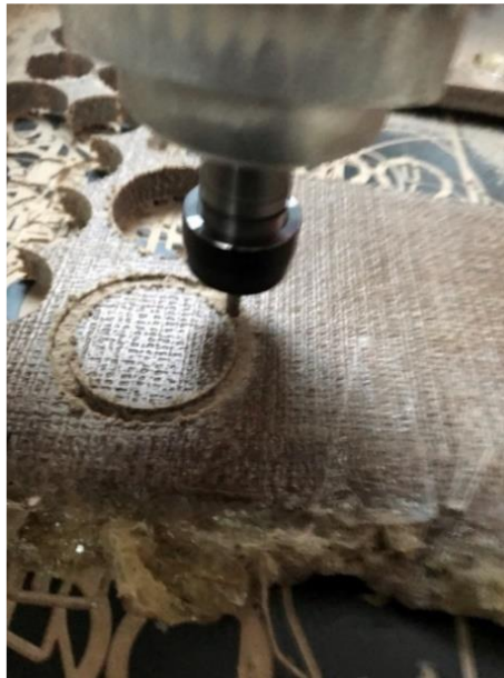
Şekil 4. Test Örneklerinin CNC ile Kesilmesi

Takviye elemanlarının hassas tartı ile ağırlıkları ve kumpas yardımı ile kuru haldeki kalınlıkları belirlenmiştir. Belirlenen ağırlık ve kalınlığa göre matris elemanının miktarı hesaplanmış olup matris elemanı olarak kullanılan epoksiye %30 oranında sertleştirici eklenmiştir. Kompozit malzemelerin üretilmesi için iki adet metal plaka kullanılmıştır. Kompozit malzemelerin kalıptan rahat bir şekilde ayrılması için kalıp ayırıcı kullanılmıştır. Takviye elemanı olarak kullanılan lifler elle yerleştirme yöntemiyle kalıplara dizilmiş ve matris elemanı her bir katman arasında gelecek şekilde kalıba dökülmüştür. Isıtılmış plakalara sahip bir hidrolik pres yardımıyla kalıp dikey ekseninde sıkıştırılmıştır. Alttaki plaka makinenin tablasında sabitken üstteki plaka istiflenmiş numuneleri sıkıştırmak için PLC tarafından 5 bar basınç ile 100 dakika boyunca 85 °C'da bekletilmiştir. Sıkıştırma işleminden sonra numuneler 72 saat soğutulmaya bırakılmış ve daha sonra kalıptan çıkarılmıştır. Hazırlanana numuneler CNC Router kullanılarak ısı iletim katsayısı ölçümü için uygun numuneler kesilmiştir, Şekil 4. Isı iletim katsayısı ölçümü için çapı 50.80 mm olacak şekilde numune alınmıştır. Her bir ölçüm için kompozit plakadan ikişer adet kesilmiştir, Şekil 5. Daha sonra üretilen biyokompozit malzemelerin termal özelliklerinin belirlenmesi için ısı iletim katsayısı testleri yapılmıştır.