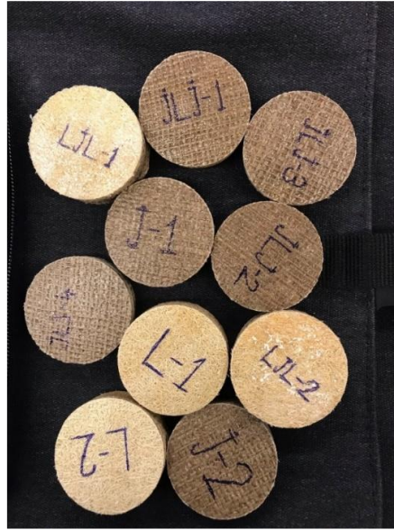
Şekil 5. Kompozit Numuneler

Teste hazır olan numunelerin ısı iletkenlikleri Maden Tetkik Arama (MTA) firmasında bulunan deney cihazı ile ölçülmüştür. Deney cihazı radyal ısı iletim ölçüm sisteminden oluşmaktadır. Bu ölçüm sisteminde ısıtıcı ve soğutucu bölümler bulunmaktadır. Soğutma soğutucu tarafta su ile yapılmaktadır. Sıcaklıklar termokopul ile ölçülmektedir, Şekil 6. Deney cihazında ısı pirinç bölümden verilmektedir. Isıtıcılar elektrikli ısıtıcıdır. Cihazda pirinçten soğutucu bölümler bulunmakta olup hortumlar vasıtası ile soğutma gerçekleştirilir. Fourier kanununa göre herhangi bir yönde geçen ısı miktarı aşağıdaki formül ile bulunur. Burada k termal iletkenlik katsayısıdır. Cihaza verilen ısıtıcı rezistansa verilen güç dolayısıyla ısı miktarı bilindiğinden diğer veriler yardımıyla formül (1) ile termal iletkenlik katsayısı hesaplanabilir.