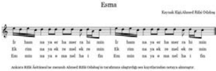
Şekil 9. Esmâ -2-

Bu esmanın devamında aynı melodiyle “ Ekrimna Yâ Ekreme'l- Ekremîn ”, “ İrhamnâ Yâ Erhame'r-Râhimîn ” ve “ Emminnâ Yâ Emâne'l Hâifîn ” güfteleri de okunur. Zikri idare eden kişi bu güfteleri en son birer defa nağmesiz okur ve dervişân “ Amin ” der. Akabinde zikri idare eden kişi istiâze ve besmele çeker “ Hasbi Rabbi Cellallah ” diyerek başlanılan esmayı cumhûren okutur. Ardından Ahzab sûresi 56. ayet okunur. Bu esmanın notası aşağıda gösterildiği şekildedir: