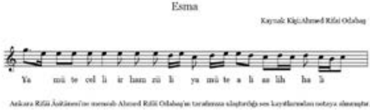
Şekil 8. Esmâ -1-

İstiğfardan sonra esmâlara geçilir. Notaları aşağıda gösterildiği şekildedir: