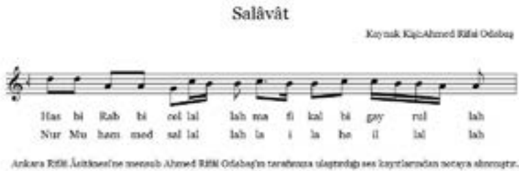
Şekil 10. Salâvât

Bu esmanın devamında aynı melodiyle “ Ekrimna Yâ Ekreme'l- Ekremîn ”, “ İrhamnâ Yâ Erhame'r-Râhimîn ” ve “ Emminnâ Yâ Emâne'l Hâifîn ” güfteleri de okunur. Zikri idare eden kişi bu güfteleri en son birer defa nağmesiz okur ve dervişân “ Amin ” der. Akabinde zikri idare eden kişi istiâze ve besmele çeker “ Hasbi Rabbi Cellallah ” diyerek başlanılan esmayı cumhûren okutur. Ardından Ahzab sûresi 56. ayet okunur. Bu esmanın notası aşağıda gösterildiği şekildedir: