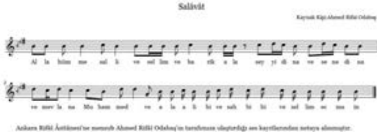
Şekil 3. Salâvât

Salâvâtı imam efendi, “ salâten tûncinâ ” diye başlayan duayı, akabinde “ subhânallâhi ve'l-hamdü lillâhi ” diye başlayan duayı okur. Ardından müezzin efendi ilk ayetlerini sesli, kalanlarını sessiz okuyacak şekilde İhlas, Felak, Nas, Fatıha, Ayete'l-Kürsî, ayetlerini okur ve dervişler içinden tekrar eder. Âl-i İmrân 18, 26 ve 27. ayetler ise cumhûren okunur. Bu ayetlere müezzinin takdir ettiği makama göre dervişan uyum sağlar. Genellikle tesbihatta rast, seghâh bazen de uşşak makamının kullanıldığı görülmektedir. Akabinde 33'er “Subhanallah”, “Elhamdülillah”, “Allahuekber” tesbih edilir. Devamında duadan sonra 21 defa kelime-i tevhid getirilir. “ Lailâhe ” derken başlar sağa “ illallah ” derken başlar sola dönmektedir. Ardından salâvât-ı şerifler okunur. “ Allahümme salli ve sellim ala seyyidina Muhammedin nebiyyi'l-ümmiyyi'l-Kureyşiyin ” ve “ Allahümme salli ve sellim ve bârik ala nûrike'l-esbâk ” olarak başlayan salâvâtlar okunur. Ardından “ Allahümme ve bi'l-hakki enzeltehu ve bi'l-hakki nezel ” diye başlayan Kur'ân-ı Kerim kıraat duasını imam kendisi okur. Akabinde cumhûren Fatıha, Amene'r-rasulü ve Mülk sûreleri okunur. Bazen de Vâka suresinin okunduğu da bilinmektedir.