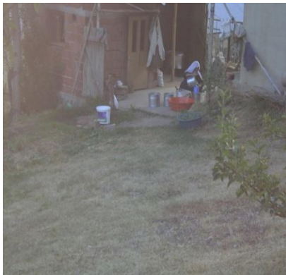
Resim 8. Süt Damı

Kadınlar genellikle imece usulüyle ekmek ve süt ürünleri yapma faaliyetleriyle bir araya gelirler. Ekmek yapma faaliyeti, özellikle kış aylarında, süt ürünleri yapma faaliyeti ise, özellikle bahar ve yaz aylarında kadınların bir araya gelmesini sağlayan işlerdir. Kış ayları dışında kullanılan “süt damı”, hem sosyalleşme hem de iletişim mekânıdır.