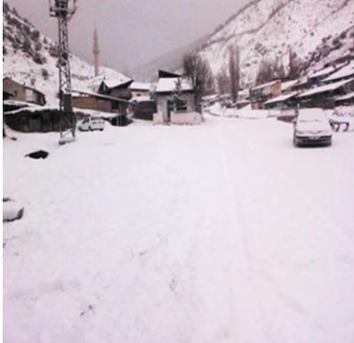
Resim 3. Resim 3. Kışın hava sıcaklığı ort. -15; en çok -40 derecedir

yatma yeri, seki olarak adlandırılan oturma yeri ve soba; sofada yataklar, çamaşırlar, günlük kullanılan araç gereçler bulunmaktadır. Banyo yoktur, tuvaletler ise evin dışında ve yakınında bir yerdedir. Bazen iki katlı da yapılan evlerin üst katı kerpiç, alt katı taş duvar, çatısı ise sactır. Her evin mutlaka bazen ayrı, bazen de bitişik yapılmış; içerisinde yiyecekler, mutfak takımları vb. bulunan bir kileri vardır.