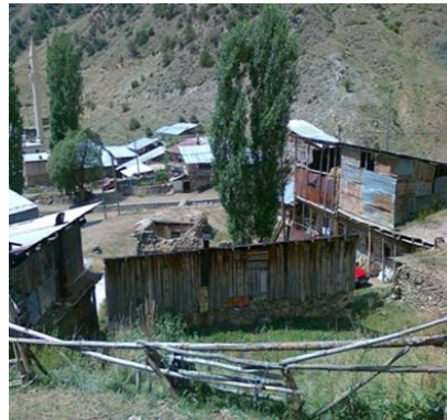
Resim 5. Bazı evler ahıra çok yakın, bazıları ise yaklaşık 100 metre mesafededir.