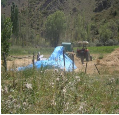
Resim 7. Patozla buğdayı sapından ayıran yaşlı karı-koca

Köyde arazilerin çoğunluğu taşlık, işlenebilir topraklar azdır. 100 dönüm işlenebilir sulu tarlası olan büyük mülk sahibi olarak görülmektedir. Genellikle işlenebilir tarlalar 30-50 dönümlüktür. Çiftçilere mazot desteği vermek için işlenebilir topraklarının kaydedildiği listede en az 6 dekar, en fazla ise 101 dekar yere sahip oldukları tespit edilmiştir. İşlenebilir topraklarda ilkbahar aylarında tohumlar ekilir, mahsul yaz sonlarına doğru toplanır.