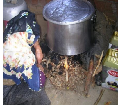
Resim 9. Süt Damında birikmiş sütü kaynatan bir nine

Küçük bir yer olan süt damında ürünler ortak üretilir. Hayvanlardan sabah ve akşam olmak üzere günde iki kez sağılan süt, süt damına getirilir ve her süt sahibinin getirdiği sütün miktarı belirlenerek bir kazanda birleştirilir. Bir kişi için 2 ila 10 günlük bir sürede birleştirilerek çoğaltılan süttten peynir, yağ, kaymak ve ayran yapılır ve sıra ikinci kişiye geçer. Süt sahibi kişi sayısına göre devam eden bu işlem bir çeşit borç-alacak ilişkisidir. Böylece sırayla tüm süt sahibi köylü üretilen süt ürünlerinden yararlanmış olur.