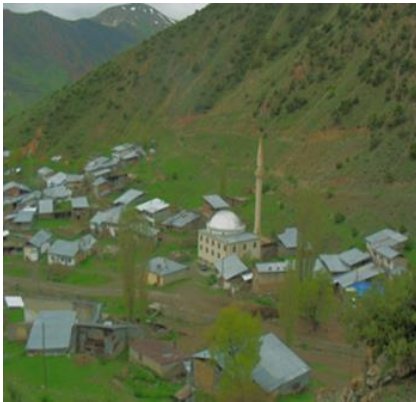
Resim 1. Ülkemizde çoğunlukta olan toplu köy tiplerinden biridir.

İnanmış Köyü, Erzurum ilinin kuzeydoğusunda Doğu Karadeniz ve Doğu Anadolu Bölgelerinin kesişim noktasında yer alan Oltu ilçesine bağlıdır. Erzurum iline 80 km. Oltu ilçesine ise 28 km. uzaklıktadır. Karasal iklim koşullarının etkisi altındaki Köyde yazlar genellikle ılık, kışlar ise soğuk ve kar yağışlı geçer.