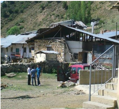
Resim 4. Sac kaplı çatılar, ot depolama yeri ve kiler olarak kullanmaya elverişli hale gelmesi için yüksek tutulmuştur.

1990'lı yılların sonlarına doğru Köyde fark edilir bir değişim yaşanmıştır . Bu sosyal değişim en çok evlerde gözlenmiştir . Tek katlı daire tipinde ve geçmişe göre daha modern yapılan evlerde evli çocuklar için ayrı kapılı oda-sofa bölmesinin yerini, sayısı 3'e 4'e çıkan ve yatak odası, misafir odası, oturma odası şeklinde ayrılan odalar alır. Mutfaklarda tabak, tencere gibi araç gereçlerin bulunduğu dolaplar ve yemek pişirmek için tüple kullanılan bir ocağın yer aldığı bir düzen kurulmuştur . Banyo yeri yapılır, tuvalet içeriye alınır.1990'lı yıllarla beraber artık evlerin yanında, ot depolarının (merek), ahırların üzeri de sacla örtülmüş, telefon, çamaşır makinası, buzdolabı, bulaşık makinası, televizyon, elektrikli fırın vb. aletler görülmeye başlamıştır. Bugün özellikle buzdolabı ve telefon hemen hemen her evde vardır. Isınma için 1990'lı yıllar ve öncesinde neredeyse köyün tamamı tezek ve odun kullanmaktayken; şimdi çok az tezek, çoğunlukla odun-kömür kullanılmaktadır. Kömürün hava kirliliğine sebep olduğu köylülerce sıklıkla vurgulanmasına rağmen, hem köyde odun getirecek genç kalmaması, hem de sosyal yardım olduğu için bedava olması kullanımı artırmaktadır.