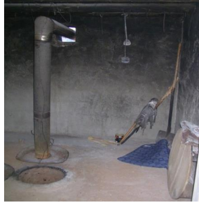
Resim 10. Süt Damında birikmiş süttten Kadınların ekmek pişirmek kaymağını ayıran bir nine ıya geldikleri tandır yeri

Geçimlik ekonominin egemen olduğu Köyde genellikle gelir, göç etmiş köylülere satılan çoğunlukla patates ve peynir; seyrek olarak ise bal, tereyağı, buğday, fasulye, mısırdan sağlanmaktadır. Köye en yakın pazar Oltu İlçesindedir. Oltu'da Çarşamba günleri kurulan ve yöresel ürünlerin de satıldığı pazar yanında; Cumartesi günleri kurulan hayvan pazarı da bulunmaktadır. Her iki pazara da çevre köylerden ilgi büyüktür. Pazar, köylülerin sadece maddi ihtiyaçlarını gidermelerini değil, aynı zaman da çevre köylerin Oltu'da buluşmasını ve haberleşmesini sağlayan sosyalleşme mekânıdır.