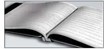
Tablo 3. Kişisel ve Mesleki Değerler