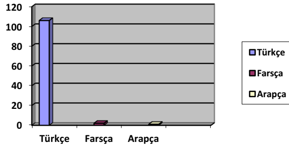
Tablo 3. Taşpınar Halısı Terimlerinin Kökeni

Veriler sonucu ortaya çıkan kelimelerin kökenlerini ait bu grafiğe baktığımızda, kelimelerin %99'una yakını Türkçe olarak karşımıza çıkmaktadır. Sözlükte, Arapça kelimeler (Ar.), Farsça kelimeler ise (Far.) kısaltması ile belirtilmiştir.