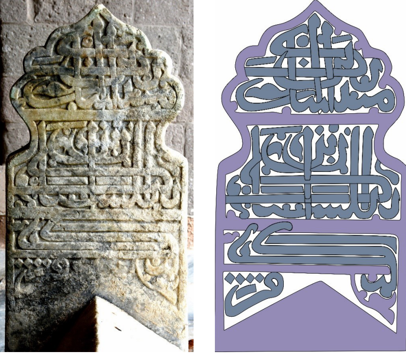
Resim 4: Ahmed Gazi'nin Ayak Tařının İ Yüzü (Bein Ahmed Gazi Medresesi)