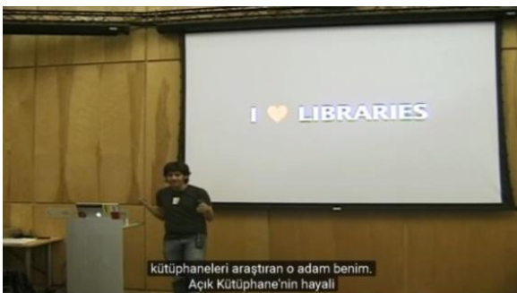
Ekran alıntısı-3: Kişisel video kayıtları

Swartz bütün enerjisini kamusal bilgiye açık ve özgür erişim projelerine harcar. Bunlardan biri de Open Library projesidir. Kütüphanelerde kapalı kalan bilgi hazinelerine kolayca ulaşabilmenin çok önemli olduğunu söylediği çeşitli konferanslar verir. Bu kültürel mirası bir