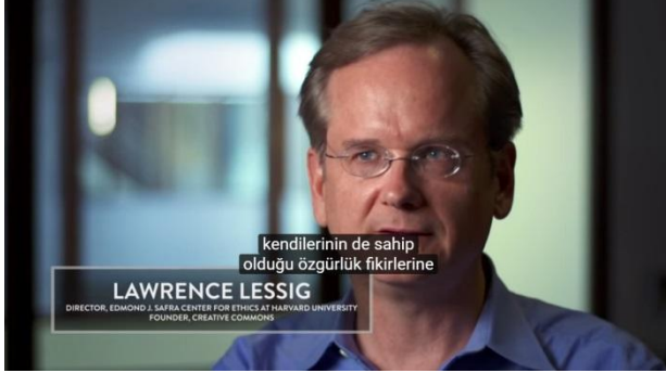
Ekran alıntısı-1: Lawrence LESSIG - Hukuk Profesörü