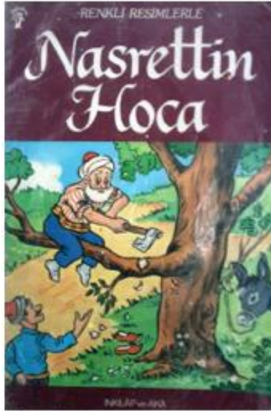
Resim 5: Binddiği Dalı Kesen Nasrettin Hoca.

Kaynak: Renkli Resimlerle Nasrettin Hoca, (1984) Resimleyen: Derman Över, İnkılap Yayınları, İstanbul.