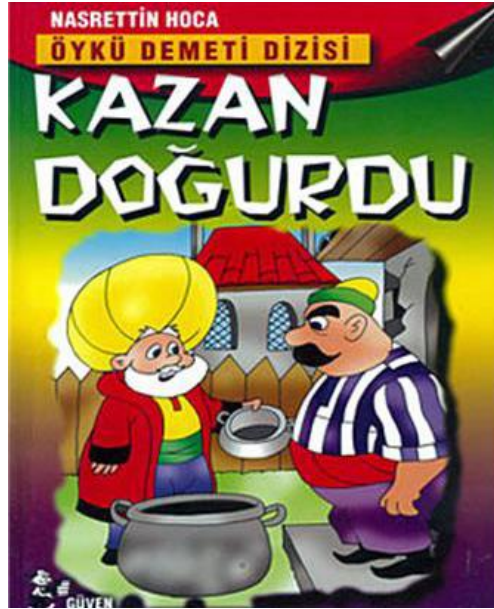
Resim 4: Sarı Kavuklu Nasrettin Hoca