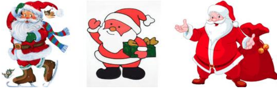
Resim 6: Noel Baba tiplemeleri