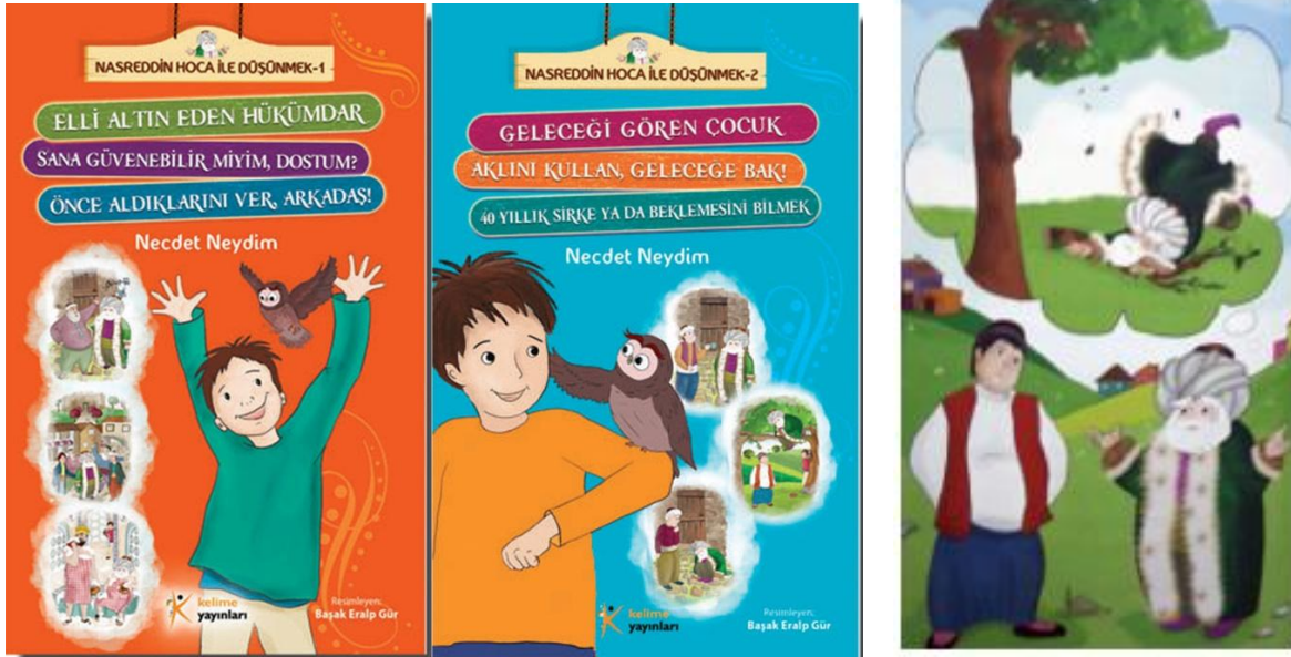
Resim 3: Kürklü Nasrettin Hoca

Kaynak: Nasrettin Hoca ile Düşünmek, (2012) Resimleyen: Başak Eralp Gür, Kelime Yayınları, İstanbul.