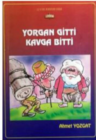
Resim 2: Elinde Yay Olan Nasrettin Hoca Tiplemesi

Kaynak: Yorgan Gitti Kavga Bitti (2010). Resimleyen: Ahmet Yozgat, MEB Çocuk Edebiyatı Dizisinden Nasrettin Hoca Kitabı, Ankara.