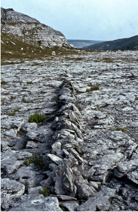
Görsel 1: Richard Long, İrlanda'daki çizgi, 1974.

pratikleri ortaya koyan, bedeniyle kenti deneyimleyen ve keşfeden sanatçının kendisi de bir performans aracına dönüşebilmektedir” Gümğüm (2020, s. 208). Sanatçıların gerçeğin izini kentlerde, sokaklarda arayışı, durumlar inşa ederek ve eleştirel sanat pratikleri ortaya koyarak gerçekleşmektedir. Çağdaş sanatta yürüme eylemini kullanan sanatçılar, mekanın kendilerine sağladığı olanaklar dahilinde yaşadıkları deneyim, gözlem, hissiyat ve materyallerle farklı sanat pratiklerini gerçekleştirilebilmektedir. Çağdaş sanatta yürüme örneklerine bakıldığında doğadaki malzemeleri kullanarak insan-doğa uyumu ile yürüyüş gerçekleştiren Long, kendi kişisel haritalarını çıkararak dünya üzerinde iz bırakmayı hedeflemiştir. Dünya üzerindeki doğada bulunan nesnelere kullanarak bunları sanat eseri haline dönüştürmüştür. Bir gezgin gibi yürürken doğada bulunan malzemeleri kullanması da doğaya saygısını ifade etmektedir. Long, yürürken doğayı iyi bir şekilde gözlemleyip dikkatini çeken nesnelere bir araya getirerek sanatını özgürce ifade etmiş, anı yaşamış ve duygu - düşüncelerini somutlaştırarak bir yapıt haline getirmiştir (Görsel 1).