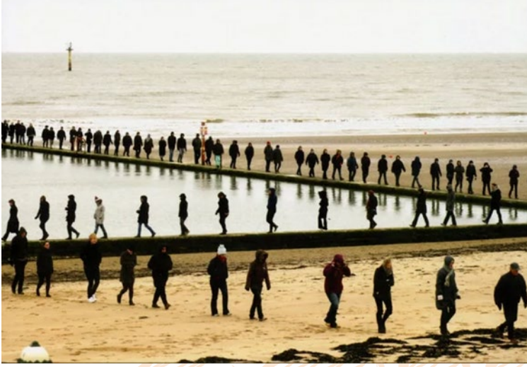
Görsel 2: Hamish Fulton, Yürüyüş 2: Margate Deniz Havuzu, 2010.

Çağdaş sanatta yürüme örnekleri denince akla gelen bir diğer isim Hamish Fulton'dur. Fulton yürüyüşlerini sanat haline getirmiştir. Yürüme'yi bir sanat formu, eğlence, hareket ve düşünme biçimi olarak kullanır. Yürüyüşlerinde herhangi bir eser bırakmaz ve sadece yürüme eyleminin kendisini önemser (Görsel 2).