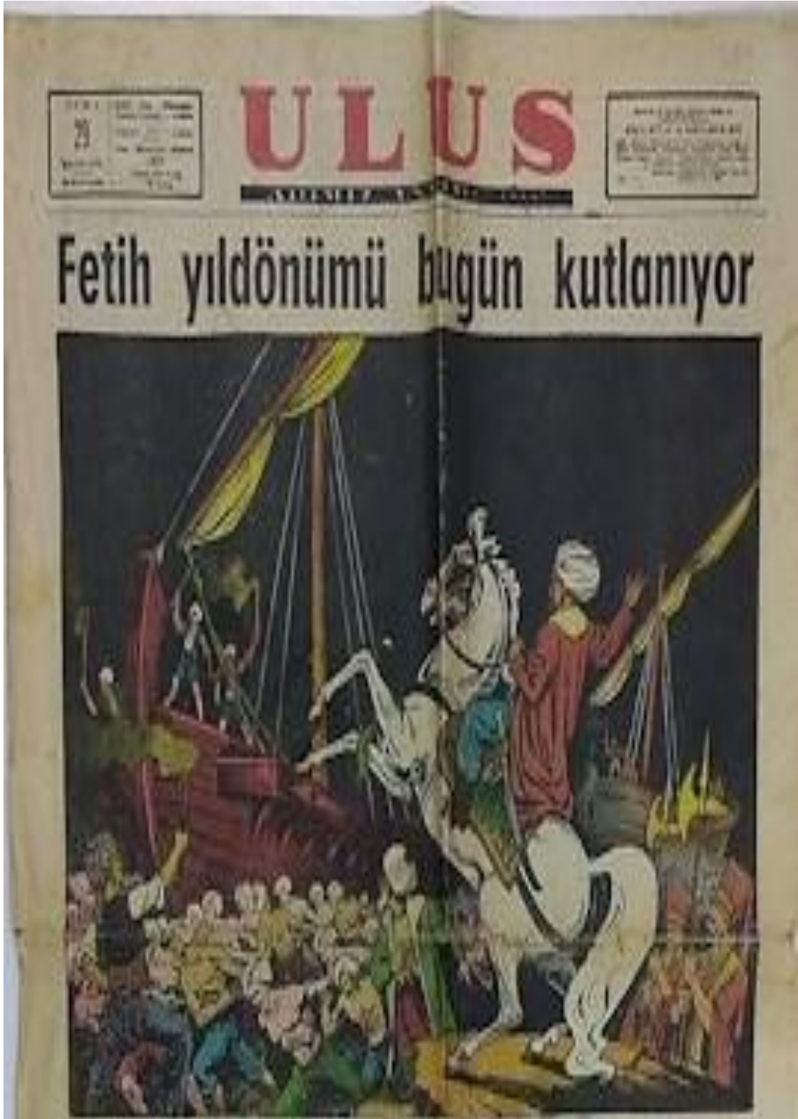
Ek:4- 29.05.1953 tarihli Ulus gazetesi