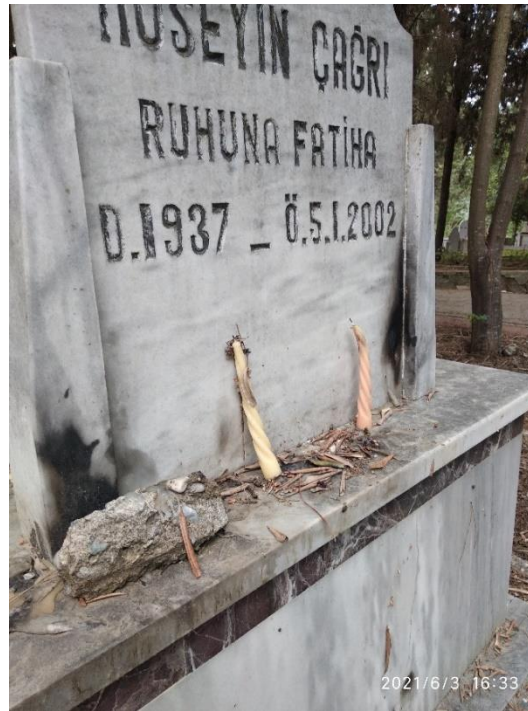
Görsel 11: Mum Yakma Ritüeli, Adana Buruk Mezarlığı, (Savur, 2023: 254).

Ateş ve duman, Altaylarda bir temizlik ve arınma şeklidir. Buryatlar, cenaze töreninde cenaze alanının önüne ateş yakmaktadırlar. Cenaze sahibi aileler, kötü ruhlardan dumanla arınıp temizlenmek adına ateş yakıp üzerinden atlamaktadırlar (Harva, 2014: 187). Ateş üzerinden atlamamanın arındırıcı ve şifa verici olduğuna inanan bir diğer topluluk da Karaylardır (Dilek, 2021: 112). Türkmenlerin mezarın başında ateş yakmaları eskiden beri süregelen ritüellerinden biridir. Bulgar Dağı Türkmenlerinin, gece ölünün yıkandığı yerde ve mezarın başında ateş yakıldığı görülmektedir (Ögel, 2014: 666). Türk şamanları, şaman vefat ettiğinde yattığı yeri kırmakta, kötü ruhların kovulması adına yere yatırılan şamanın başucunda mum yakılıp bekletilmektedir (Bayat, 2019: 263).