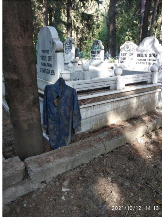
Görsel 12: Kıyafet Asma Ritüeli, Adana Akkapı Mezarlığı, (Savur, 2023: 216).

Kıyafet asma ritüeli atalar kültü inancıyla bağlantılıdır. Bu uygulama, mezarda yatan kimsenin sevdiği bir nesnenin mezar taşına bırakılması veya kıyafetinin asılması şeklinde gerçekleşmektedir. Ölen kimsenin ruhunu memnun etmek, onu anmak ve sevgi, saygı göstermek adına yapılan bir uygulamadır (Savur, 2023: 162). Ölünün cenin pozisyonunda gömülerek eşyalarının da mezara koyulması Türkistan coğrafyasında görülmektedir (Yıldız Altın, 2021: 195).