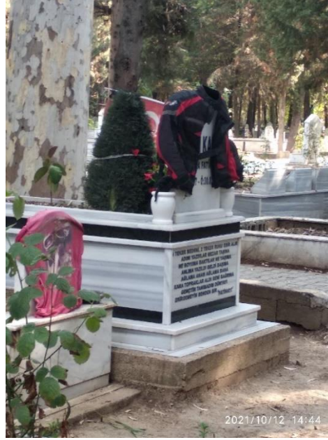
Görsel 14: Kıyafet Asma Ritüeli, Adana Kabasakal Mezarlığı, (Savur, 2023: 217).