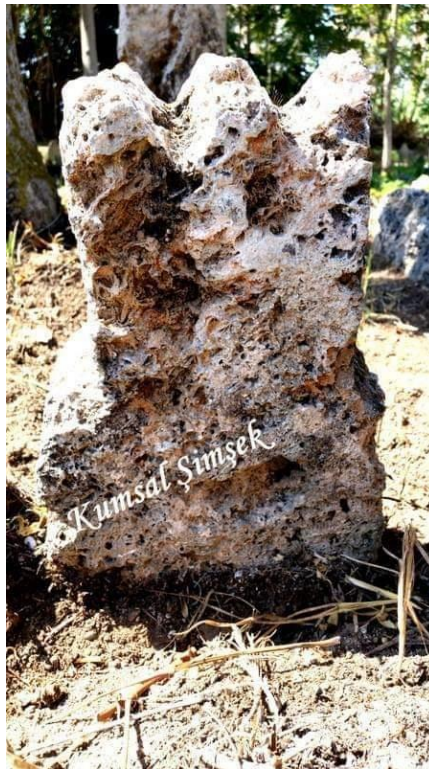
Görsel 5: Umay Ana Tacı Formlu Mezar Taşı, (Şimşek, 2018).

Umay Ana çeşitli biçim ve formlarda Türk toplumlarında tasvir edilmektedir. Kırgız halkının anlattığına göre Umay Ene, yeryüzünde olduğunda izi bazı kayalarda ve taşlarda kalır. Bunlar Umay Ene'nin tahtı olarak adlandırılır (Dilek, 2021: 849). Nitekim Umay, mezar taşlarında ve çeşitli heykelerde üç yapraklı bir taç veya üç boynuz süslü bir başlık formunda tasvir edilmektedir. Adana'daki mezarlarda “Umay Ana Tacı” şeklinde mezar taşları da tespit edilmiştir. Bu durum Adana'daki mezarlıklarda da görölmektedir ve 5, 6, 7 numaralı görsellerde örneklendirilmiştir.