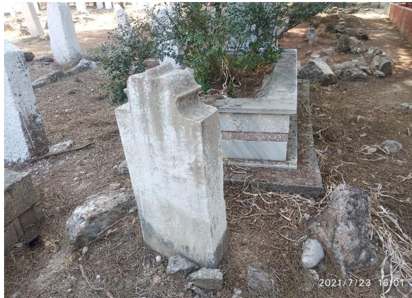
Görsel 7: Umay Ana Tacı Formlu Mezar Taşı, Adana Buruk Mezarlığı, (Savur, 2023: 224).

Taşeli Yöresi'nde gelinin eline verilen mendilde, gelinin atının yularında, Umay tasvirleri ve Umay Ana tacı (üç şualı) işlendiği görülmektedir (Kayabaşı, 2016a: 150). Adana'da tarihi belli olmayan kadın mezar taşlarının çoğunda Umay Ana tacı motif olarak işlenmiştir. Umay Ana'nın ölen kimseleri himayesi altına alarak kötü ruhlardan koruyacağına, merhamet göstereceğine inanılmakta ve kadın mezar taşlarına da bu form yansımaktadır. Bu durum hem doğumda hem de ölümdede Umay Ana'nın insanlara yardımcı olduğu düşüncesini doğurmaktadır.