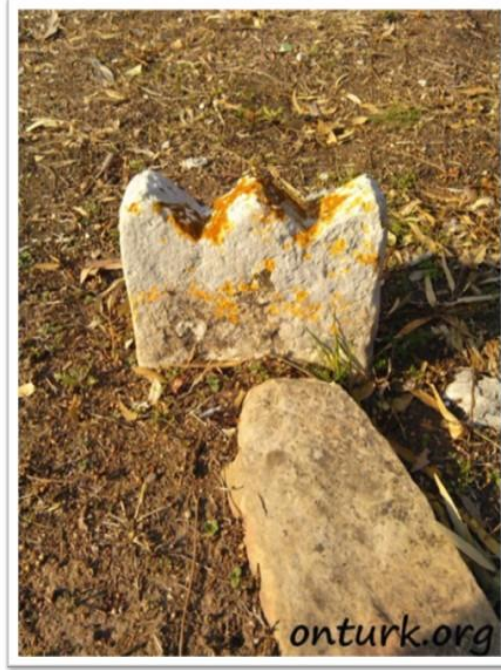
Görsel 6: Umay Ana Tacı Formlu Mezar Taşı, (Baytok, 2015).

Tasvirlerden görülen Umay Ana tacı formu Adana'da bulunan ismi ve tarihi belli olmayan bir mezar taşında tespit edilmiştir.