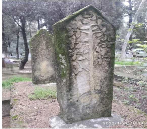
Görsel 1: Ağaç Motifli Mezar Taşı, Adana Asri Mezarlığı (Savur, 2023: 210).

Türk geleneklerinde mezarın başına ağaç dikilmektedir. Dikilen ağaç yeşerip hızlı bir şekilde göğe doğru serpilirse mezarda yatan kişinin Tanrı katında mekânının olduğuna inanılmaktadır (Ergun, 2004: 337). Mezarlıklara bu sebeple ağaçlar dikilirken, kutsalın dokunulmazlık kazandırdığı mezar taşlarına da ağaçla bağlantılı motifler işlenmektedir. Bu durum Adana'daki mezarlıklarda da görülmektedir ve 1, 2, 3, 4 numaralı görsellerle örneklendirilmiştir.