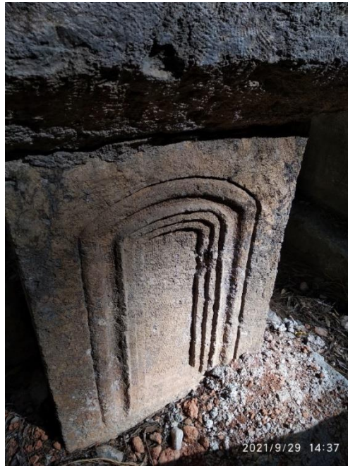
Görsel 8: Eşik Motifli Mezar Taşı, Adana Kozan Merkez Mezarlığı, (Savur, 2023: 228).

Eşik, Türklerin gündelik hayatlarında var olan inanış ve ritüellerinde adı geçen tasvir ve motiflerden biridir. Eşik hem kapının önü hem göğe açılan bir kapı görevindedir. Yer ve ruh âlemlerini birbirinden ayıran bir sınır işlevi gördüğü de aktarılmaktadır. Eşik, çok durulması sakıncalı ve hemen geçilmesi gereken bir yer olarak bilinmektedir (Türkyılmaz, 2019: 154-155). Anadolu’da eski Türk inanç sisteminde yer alan eşik iyesi ve ona bağlı inanmaların tamamı ortadan kalktığı hâlde eşiği kutsama ve onunla ilgili yasakların büyük bir kısmı devam etmektedir (Dilek, 2021: 317). Eşiğin, tasavvuf inancında dışardan içeriye girmek ve zahirden batına ulaşmak gibi çeşitli anlamları da vardır. Bu geçiş, eşikten geçmekle sona ermektedir. Kutsal olmasından dolayı eşiğe basılmamaya dikkat edilir ve içeriye girişte eşik öpülür. Eşiğe baş koymak vb. ifadeler bu inanç bağlamında gelişmiştir. “Beşikten eşiğe kadar” ifadesiyle beşik ile doğum sembolize edilirken, eşik ile ölüm sembolize edilmektedir (Kaya, 2014: 331). Ölüm ile insan farklı bir ortama ve dünyaya geçiş yapmaktadır. Adana il merkezinde ve Kozan ilçesinde bir mezarda; mezar taşına kapı girişi, mezarın ayak ve baş kısmına eşik tasviri yapıldığı tespit edilmiştir. Bu durum 8 numaralı görselde örneklendirilmiştir.