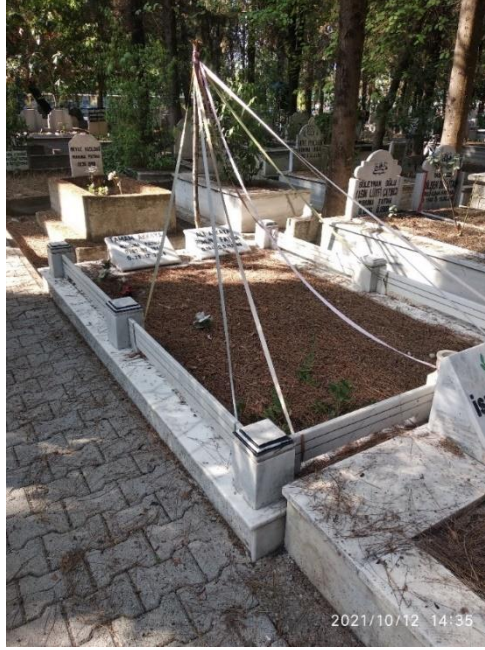
Görsel 15: Kurdele Asma Ritüeli, Adana Akkapı Mezarlığı, (Savur, 2023: 215).

üzerine gerildiği veya mezar taşına kuşak gibi bağlandığı tespit edilmiştir. Bu durum 15 numaralı görselde örneklendirilmiştir.