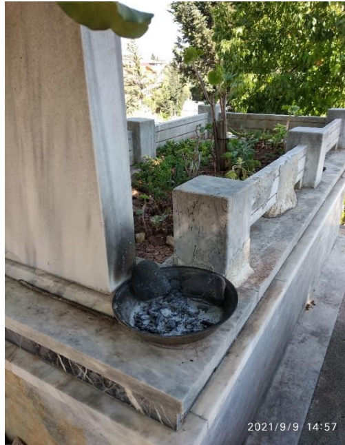
Görsel 10: Tütsü Yakma Ritüeli, Adana Sülüklüpinar Mezarlığı, (Savur, 2023: 213).

Türk kültüründe ölüme sebep olan ruhlardan arınmak adına tütsü kullanılmaktadır. Kötü ruhları ölen kişiden arındıracağı ve kaçıracağı inancıyla öd ve günlük ağaçlarından tütsüler yapılmaktadır. Kırgızlar, alasta adı verilen tütsüyü ölüm ruhunun zararlarından korunmak için yakmaktadırlar (Yeniay vd., 2022: 242-243). Anadolu'da daha çok doğum, ölüm, hastalık ve nazar değmesi gibi durumlarda tütsü yakılmaktadır (Dilek, 2021: 834). Adana'da mezarlıklarda günlük ağacından imal edilen bahur adı verilen tütsülerin yakıldığı görülmektedir. Bu durum 10 numaralı görselde örneklendirilmiştir.