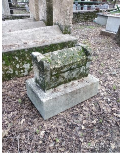
Görsel 9: Beşik Motifli Mezar Taşı, Adana Asri Mezarlığı, (Savur, 2023: 228).

beşik olması düşüncesiyle bu mezarların yapıldığı düşünülmektedir. Bu durum 9 numaralı görselde örneklendirilmiştir.