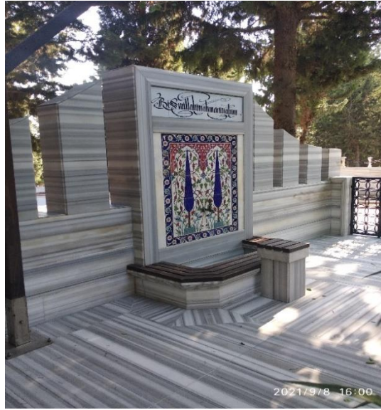
Görsel 2: Ağaç Motifli Mezar Taşı, Adana Kabasakal Mezarlığı (Savur, 2023: 213).