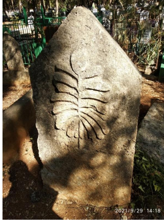
Görsel 3: Ağaç Motifli Mezar Taşı, Adana Kozan Merkez Mezarlığı, (Savur, 2023: 211).

Hurma, cennete özgü bir ağaç ve meyve olarak kabul edilmektedir. Adana’da bulunan mezar taşlarında hurma ağacının motif olarak işlendiği görülmektedir. Mezar taşında hurma ağacının bulunması kişinin hac görevini ifa etmiş olduğu anlamına gelmektedir (Savur, 2023: 158).