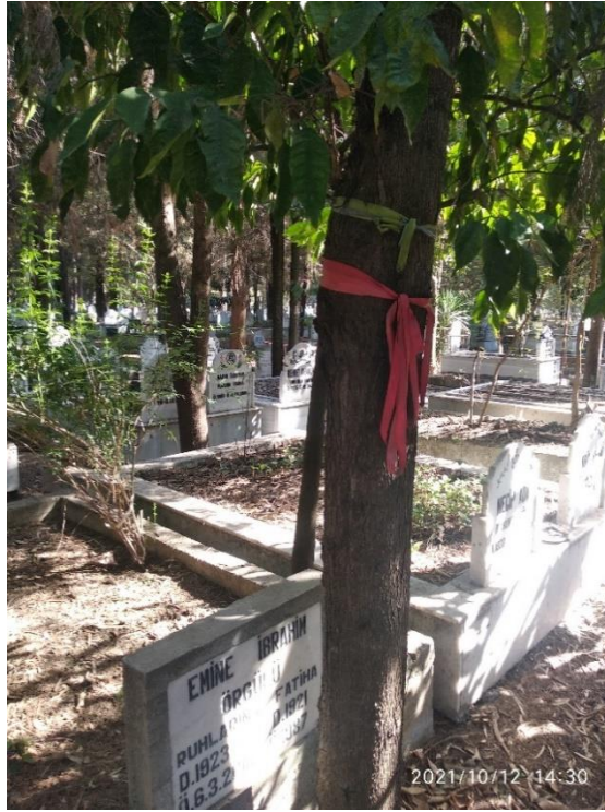
Görsel 4: Ağaç Motifli Mezar Taşı, Adana Kabasakal Mezarlığı, (Savur, 2023: 207).

Adana'daki mezarlara, servi, çınar, söğüt, çam vb. ağaçların da dikildiği görülmektedir. Meyve veren ağacın mezarlara dikilmeyeceği ve meyvesiz ağaçların gölgesinden ölünün faydalanacağı inancıyla çam, söğüt, çınar, servi gibi ağaçların dikildikleri tespit edilmiştir (Savur, 2023: 159). Servi ağacının Adana mezar taşlarında motif olarak kullanılmıştır. Göğe doğru yükselen serviler düzgün boyları ile sonsuz bir hayatı sembolize etmektedirler (Ergun, 2004: 235). Türklerin İslamiyet'i kabulünden sonra hayat ağacı varlığını cennet ağacı olarak zikredilen servi ağacına bırakmıştır. Servi, elife benzeyen şekliyle vahdaniyeti, doğruluğu; yaz kış yapraklarını dökmemesiyle ölümsüzlüğü, göklere doğru uzanması, boyuyla Allah'a kavuşmayı simgelemekte; çıkardığı seslerle Allah'ı zikrettiğine inanılmaktadır (Çetin ve Yayık, 2021: 487). Servi ağacı, ölüm ve fanilik sembolleri ile bağlantılıdır. Yaz ve kış aylarında yeşil kalması, özel bir kokusunun olması, her zaman dik durması ile ruhun yükselerek Allah'ın katına çıkışını temsil etmektedir. Servi ağacı rüzgârda sallanırken çıkan sesin "Hû" sesine benzediğine ve Allah'ı zikrettiğine inanılmaktadır. Ve bu "Hû" sesiyle yatan kişinin günahlarından arınacağı, günahlarının affolunacağı, gün geldiğinde servi ağacı kurursa yatan kişinin günahlarının sona ereceği, biteceği aktarılmaktadır (Arslan, 2014: 7). Nitekim, hayatın başlaması ve son bulması hayat ağacının bir uzantısı olan servi ağacı ile sembolize edilmektedir.